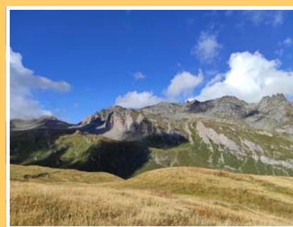
Lumières somptueuses dans le haut vallon du Versoyen.