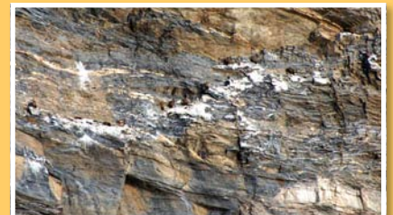
1m de haut, 2,50m d'envergure... et pourtant si mimétiques sur une paroi !