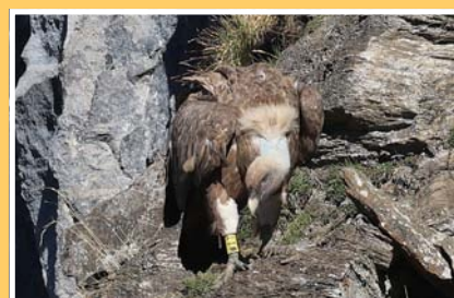
La lecture de bagues permet de renseigner sur la provenance des oiseaux et sur leurs circulations à grande distance.