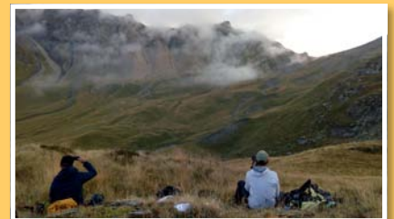
Malgré les apparences, une soirée comptage n'est pas qu'une soirée contemplation.