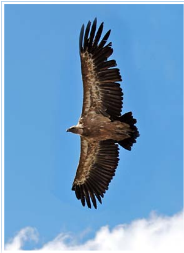
Dernier «round» avant le coucher.

Malgré la présence de bandes nuageuses sur les versants tout l'après-midi qui se sont en général élevées en soirée, la visibilité a globalement permis un bon décompte des oiseaux perchés en paroi le soir. Mais, pour la région, les vautours ont aussi pu se déplacer très tard : encore des retours au dortoir observés à plus de 20h30, alors que les arrivées commencent traditionnellement dès le début de l'après-midi.