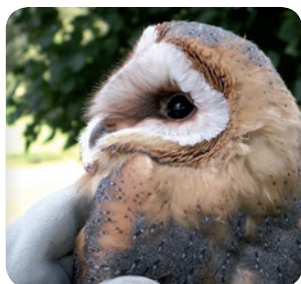
Effraie des clochers

Afin de venir en aide à la faune sauvage en détresse, des projets de création ou d'agrandissement de centre de sauvegarde LPO sont à l'étude.