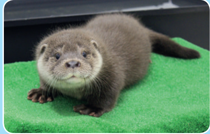
Jeune loutre en soins