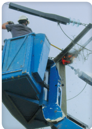
Nid de cigogne en feu

Les accidents et les dégazages illicites entraînent des pollutions et marées noires qui sont une grave menace pour l'ensemble de la faune marine et côtière. Les naufrages de pétroliers, comme celui de l'Erika en 1999 ou du Prestige en 2002, sont des catastrophes qui tuent des milliers d'oiseaux. La LPO porte régulièrement plainte devant les tribunaux pour dénoncer ces actes. Malheureusement, les pollutions sont récurrentes et les accidents restent un risque permanent : chaque hiver, des oiseaux mazoutés sont recueillis.