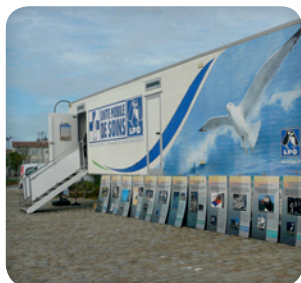
UMS LPO Wildpeace

La LPO peut également compter, grâce à la participation de plusieurs centaines de bénévoles, sur des réseaux de collecte locaux répartis sur l'ensemble du territoire.