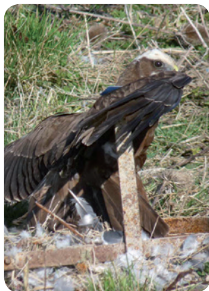
Busard des roseaux piégé