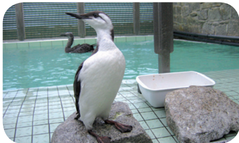
Guillemot de Troil