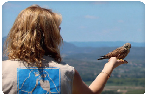
Relâché d'un faucon crécerelle