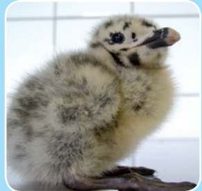
Poussin de goéland