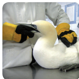
Fou de Bassan