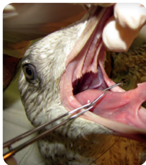
Goéland argenté hameçonné