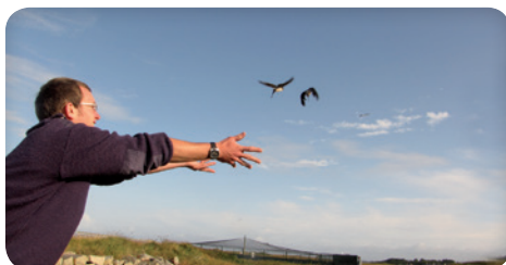
Hirondelles de fenêtre