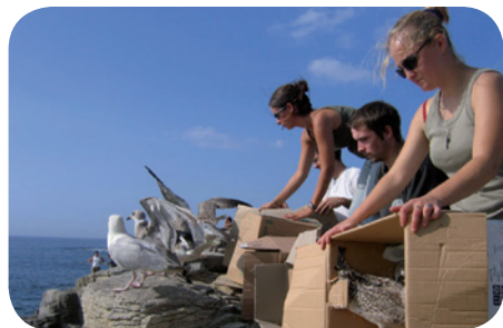
Relâcher de goélands