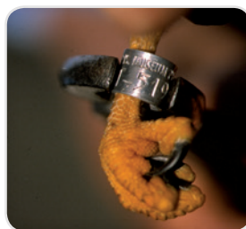
Baguage d'un faucon crécerelle

Envoyez ces informations au Centre de Recherches par le Baguage des Populations d'Oiseaux (CRBPO) - 55 rue Buffon - 75005 PARIS - 01 40 79 30 78 - https://crbpo.mnhn.fr/