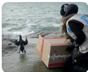
Relâché d'un Guillemot de Troil

Grâce à la mobilisation de tous, plus de 60% des animaux soignables dans les centres de sauvegarde LPO sont relâchés.