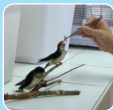
Hirondelles de fenêtre

remplacez-le dans le nid. Les oiseaux, contrairement aux mammifères, ont un odorat très peu développé. Aussi, sachez que le fait de les toucher n'entraînera aucun rejet par les parents.