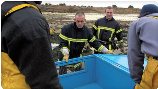
Sapeurs-pompiers de Lannion