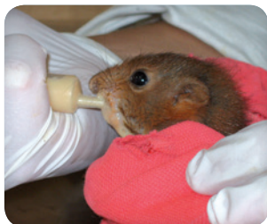
Écureuil roux au nourrissage