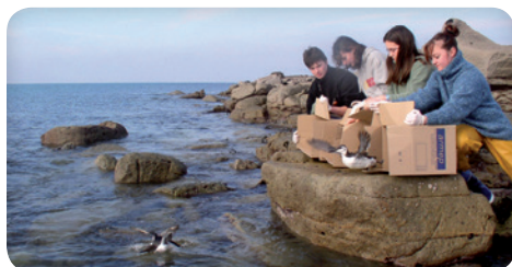
Guillemots de Troil