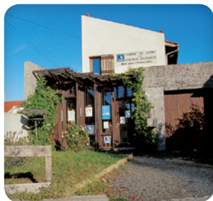
Centre de la LPO Auvergne

f • Le centre de la LPO PACA à Buoux (Vaucluse) : créé en 1996, il est géré par la LPO depuis 2006 et accueille toutes espèces confondues, principalement des rapaces ainsi que quelques petits mammifères.