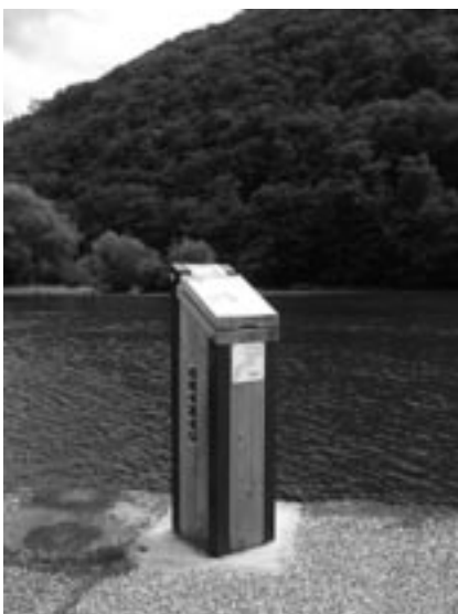
Un sentier d'interprétation sur les oiseaux à Besançon

La ville de Besançon est un lieu de passage et de nidification pour de nombreuses espèces d'oiseaux. Du faucon pèlerin guettant la ville du haut de la citadelle jusqu'au harle bièvre se nourrissant dans le Doubs, les habitants à plume ont été mis à l'honneur grâce à la mise en place d'un parcours de sensibilisation tout au long du Doubs. Ce parcours, réalisé en partenariat avec la Ville de Besançon et du CPIE du Haut-Doubs, est constitué de 12 bornes en métal et en bois permettant de découvrir la vie d'une trentaine d'espèces sédentaires et