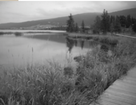
Le lac des Rousses depuis le Rocher