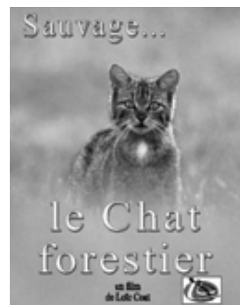
Filmographie de Loïc Coat