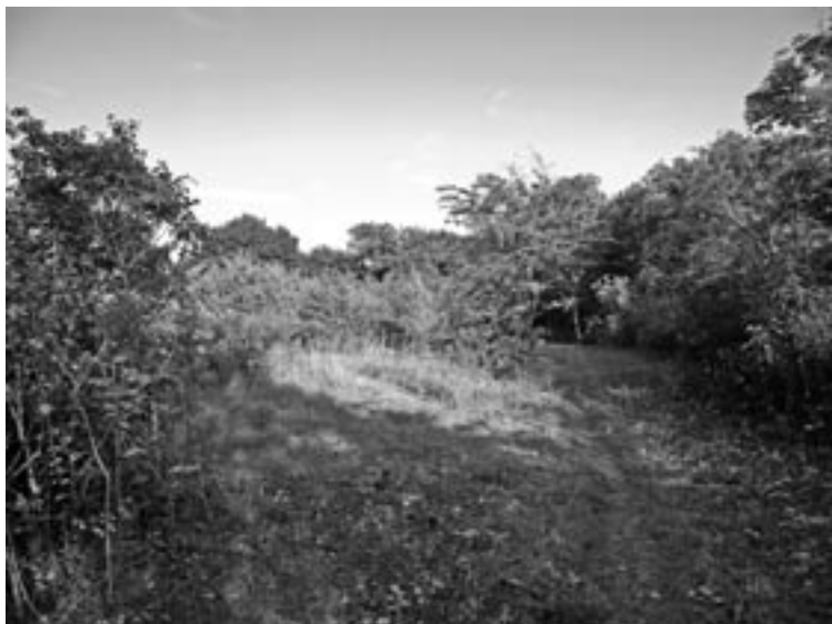
Le résultat du chantier réalisé par les jeunes de la PJJ