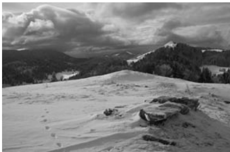
Sur le Crêt au Merle, la trace du lynx se moque de la frontière entre l'Ain et le Jura

Situer le Haut-Jura parmi les limites administratives et les réalités géographiques n'est pas chose aisée. D'autant plus que le massif montagneux a donné son nom au département entraînant parfois quelques confusions si l'on a oublié ses cours de géographie de l'école primaire ! L'usage local définit le Haut-Jura comme la partie la plus élevée du département du Jura. Celle-ci est la plus connue au travers de ses activités touristiques et recouvre principalement le secteur allant des Rousses aux Bouchoux ; c'est le Haut-Jura dont nous parlerons dans ces lignes. Une définition moins restrictive s'appuyant sur la géographie intègre l'ensemble des plissements spécifiques du relief jurassien au-delà des plateaux. Le Haut-Jura s'étend alors principalement sur trois départements français et sept cantons suisses.