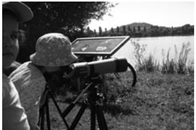
Des animations réussies à Vesoul et au Lac de Vaivre

migratrices. Des aquarelles et des dessins au trait donnent vie aux sujets abordés : la migration des milans, la désertion des collines par le bruant fou, la pêche du martin ou encore le ballet des martinets.