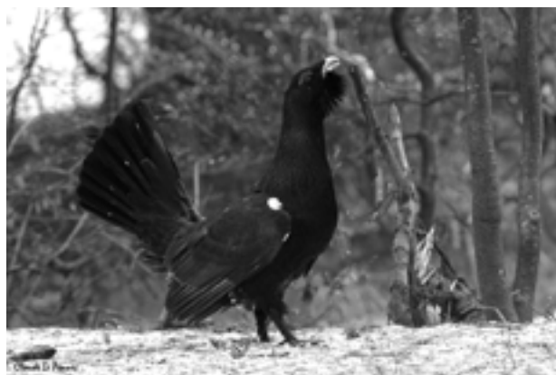
Le grand tétras © Claude Le Pennec

Des rencontres avec le lynx, vérifier l'éclosion dans un nid de chevêchette au passage et une parfaite connaissance des sentiers, car le relief accidenté ne favorise pas la prospection. Il se définit comme un homme de terrain qui transmet des informations. Désormais en retraite, son programme naturaliste est encore plus chargé entre le groupe Tétrás, la société des naturalistes de Saint-Claude, le suivi du faucon pèlerin, les animations, les expositions et toujours quelques longs affûts.