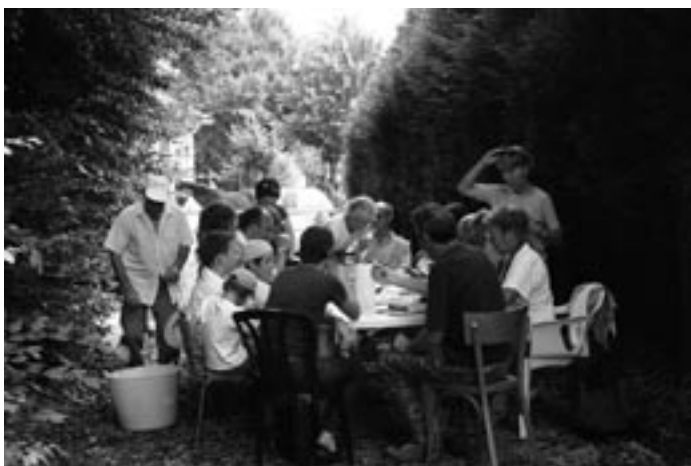
Atelier Refuge LPO à Lavernay