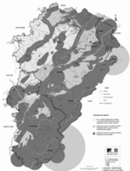
Synthèse des contraintes liées à l'implantation de parcs éoliens en Franche-Comté

La LPO Franche-Comté a donc analysé au cours du printemps les enjeux aviens en Franche-Comté par rapport à l'installation de parcs éoliens. Ce travail a été subventionné par la DIREN Franche-Comté. L'étude propose des méthodes de suivi à mettre en œuvre dans le cas de projets éoliens. Elle présente également les espèces les plus sensibles aux éoliennes ainsi que leur comportement au travers de fiches par espèce ainsi qu'une cartographie des zones les plus sensibles de part la présence d'espèces à partir des connais-