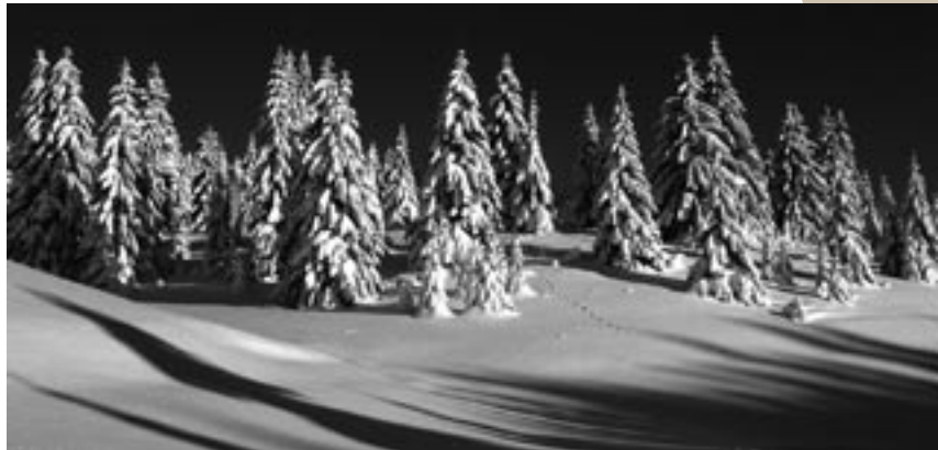
Epicéa sous la neige, image du Haut-Jura

toute nouvelle espèce nicheuse de la région. Cette espèce est dépendante des forêts à caractère naturel. Dans la forêt et en lisière, on rencontre des espèces liées à la présence de l'épicéa, le beccroisé des sapins, le tarin des aulnes ou le merle à plastron. La limite entre la forêt et la pelouse d'altitude permet la rencontre avec le venturon montagnard, un granivore endémique d'Europe occidentale. Chez les amphibiens, le triton alpestre au magnifique ventre orangé est particulièrement bien adapté aux mares et trous d'eau en forêt. On le rencontre dans les ornières forestières laissées par les engins de travaux forestiers. Autre espèce colorée, la salamandre tachetée fréquente les cours d'eau de tout le Haut-Jura ainsi que ces mêmes ornières. Le lynx boréal est sans aucun doute le mammifère le plus emblématique de ces milieux. Il fréquente les grands espaces boisés dans lesquels il peut se déplacer en toute sécurité, mettre bas et se nourrir de chevreuils ou de chamois. Le retour durable du loup dans le Haut-Jura redonnera aux massifs forestiers du Jura un caractère sauvage qui leur a fait défaut durant de nombreuses années. Le chamois et le chevreuil côtoient le blaireau, la martre, ou encore le chat forestier qui possède l'essentiel de sa population dans le nord-est de la France.