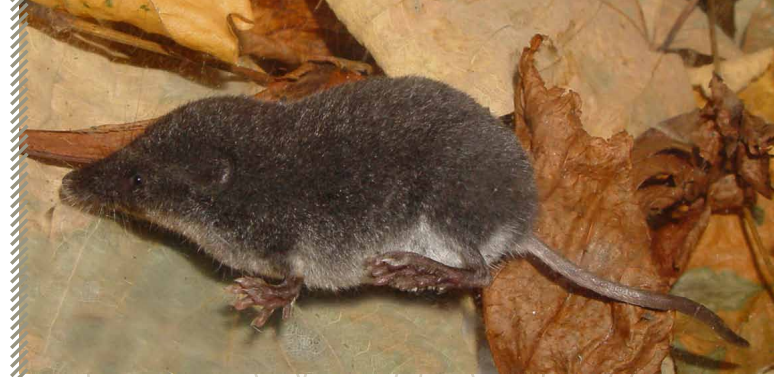
Crossope de Miller © Markus Nolf