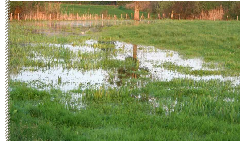
Prairie inondée, un milieu favorable à la Grenouille des champs