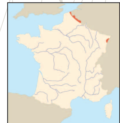
Répartition de l'espèce en France