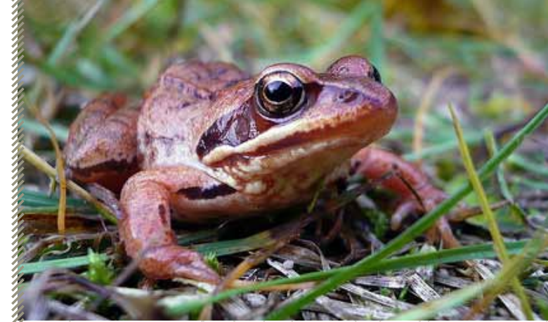
Grenouille des champs

Rédaction : Jean-Philippe Paul - Mise à jour : mai 2011