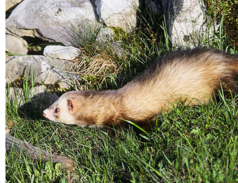
Putois européen

Rédaction : Nathalie Dewynter et Christophe Morin – mise à jour : septembre 2011