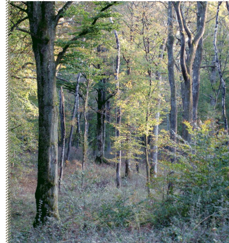
Habitat type du Putois européen