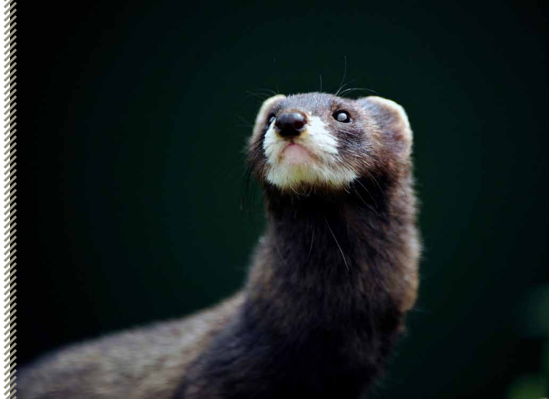
Putois européen

En France, le putois fréquente principalement les milieux humides, notamment les marais et rives de cours d'eau. On l'observe également en paysage bocager et, bien qu'il soit absent des forêts profondes, il occupe toutefois les lisières et les cours d'eau qui les traversent. Très anthropophile en période hivernale, il s'approche des habitations pour coloniser les bâtiments annexes (granges, étables...) qui abritent de nombreux rongeurs en cette saison. Les densités de population souvent basses dépassent rarement les 5 individus pour 1000 ha dans les habitats les plus propices. L'activité est principalement nocturne et son rythme est étroitement corrélé à celui de ses proies principales. Son régime alimentaire, variant en fonction des saisons, est presque exclusivement carnivore. Il consomme essentiellement de petits rongeurs (campagnols, mulots...) et amphibiens et se nourrit aussi de lagomorphes et d'oiseau, plus occasionnellement de musaraignes, de nourriture pour chats, de déchets carnés... Le putois est un animal solitaire au comportement territorial marqué en dehors de la saison de reproduction. L'époque du rut se situe en mars-avril mais peut s'étendre jusqu'en août. La femelle donne naissance à 3 à 7 petits qui atteindront la maturité sexuelle dès l'âge de 10 mois.