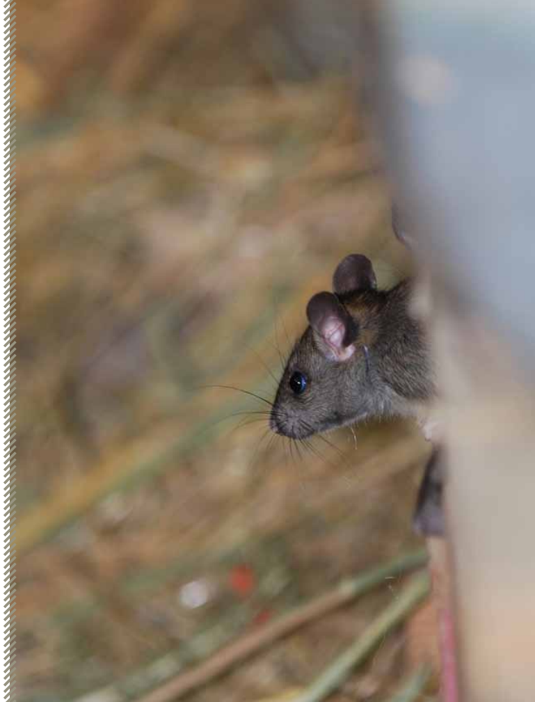
Rat noir

Rédaction : Isabelle Leducq – mise à jour cartographique : août 2011