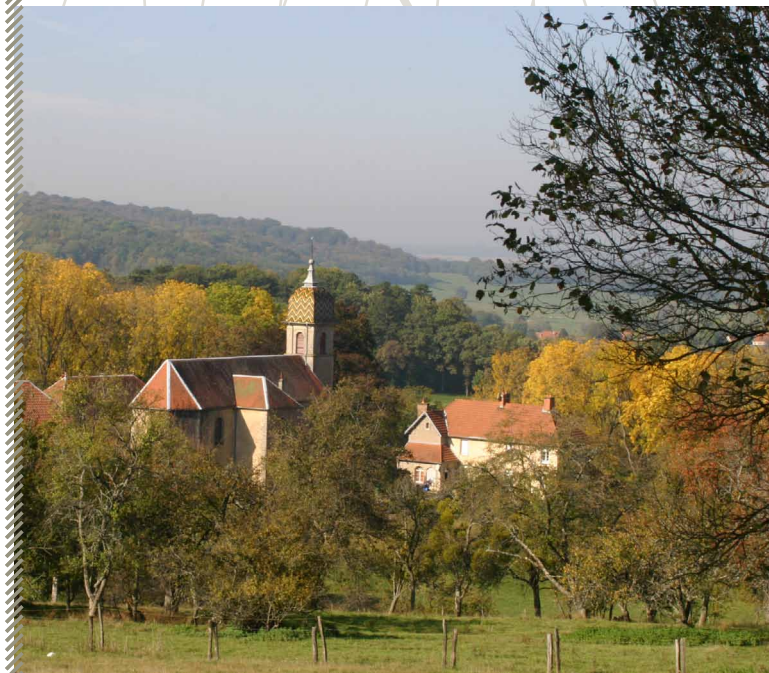
Habitat type du Rat noir