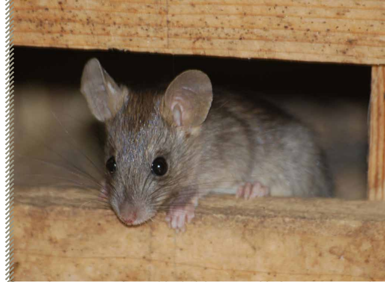
Rat noir

N'ayant pas suffisamment de données, il est très difficile de se prononcer sur sa répartition et sur l'importance de son déclin même si cette notion ne semble pas pouvoir être remise en cause. En effet, il est très difficile d'observer cette espèce et donc de collecter suffisamment de données. Aucune méthode ne semble adaptée à sa recherche ; il est peu présent dans les pelotes, peu capturé dans les pièges et peu d'individus sont retrouvés écrasés. Cette constatation peut être également influencée par les faibles densités de l'espèce.