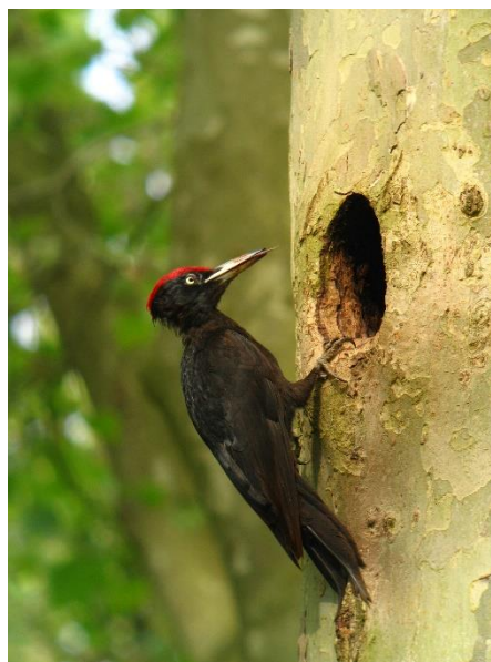
Pic noir mâle devant une loge

Le Pic noir est une espèce emblématique et patrimoniale des forêts du Poitou-Charentes. Présent sur l'ensemble du territoire, il est toutefois peu abondant et l'observer est toujours une chance. Bien que la tendance de sa population soit plutôt positive, il est inscrit sur la liste rouge régionale comme « Vulnérable ».