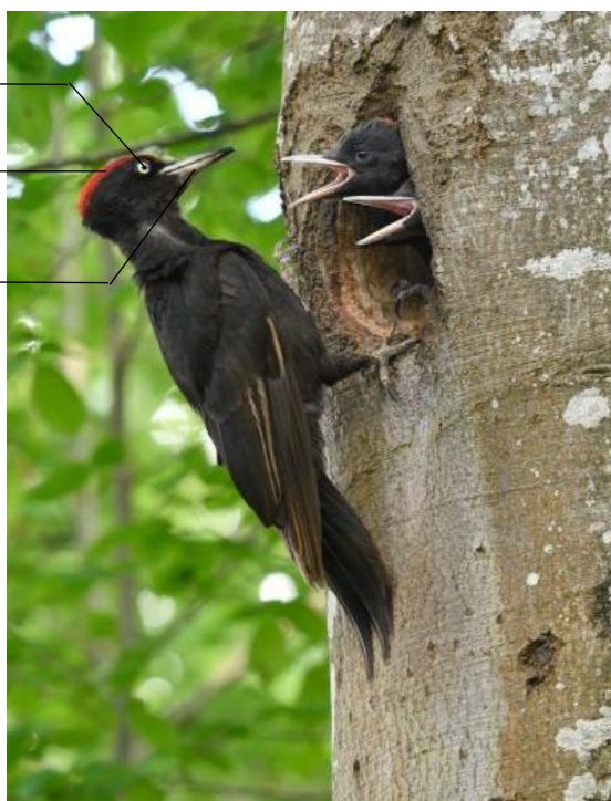
Pic noir mâle