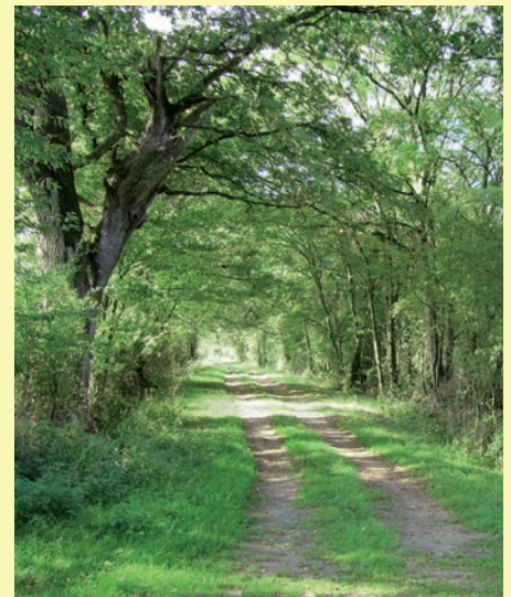
Cette balade est aussi très agréable au printemps, afin de suivre l'arrivée des oiseaux migrateurs.

N'oubliez pas de jeter un coup d'œil aux autres étangs, en particulier l'étang Baudroux (point 6) et l'étang de la Croix-Blanche (point 4) car ils peuvent réserver de bonnes surprises.