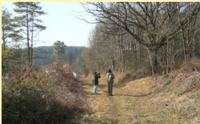
Paysage en lisière de la forêt de la Guerche

Au bout du chemin, à l'orée de la forêt, l'alouette des champs, le gobe-mouche gris, la grive draine et la buse dans la prairie et les