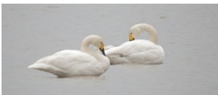
Cygnets de Bewick

Consulter les résultats détaillés de la Dombes