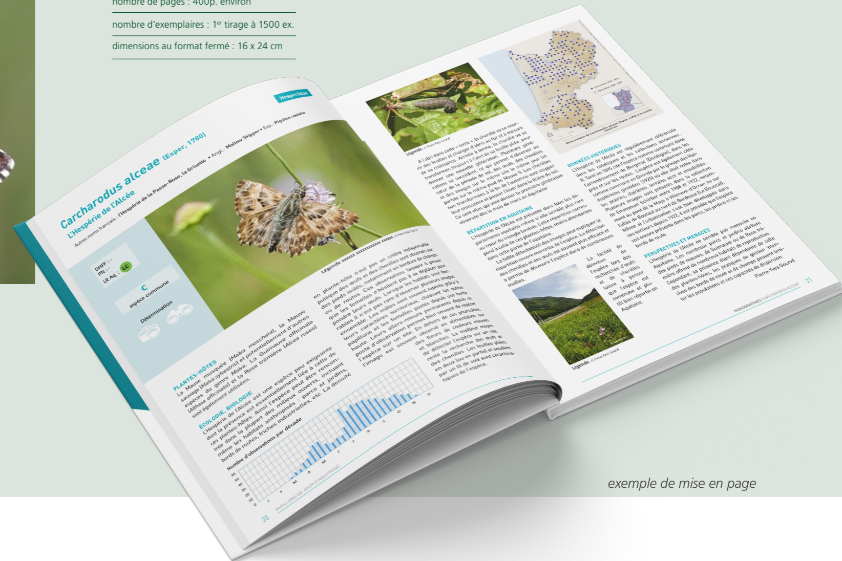
exemple de mise en page