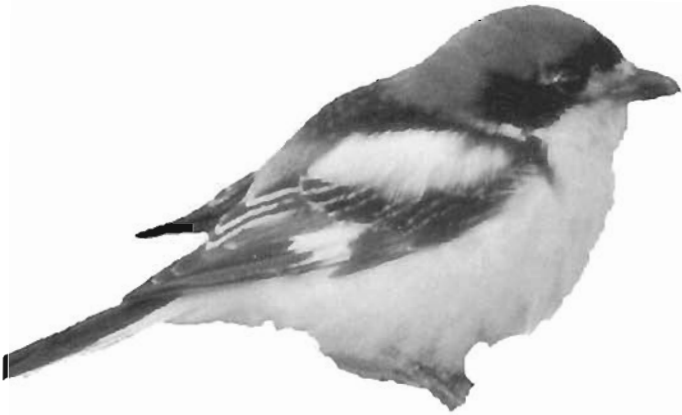
Pie-grièche à tête rousse ( Lanius senator ) mâle

Cassenoix moucheté ( Nucifraga caryocatactes ) (10 Obs.) 1 adulte tué à Ste Agne le 8/8/68 (P. Arnouil), 2 individus à Teyjat le 30/9/90 (D. Raymond).