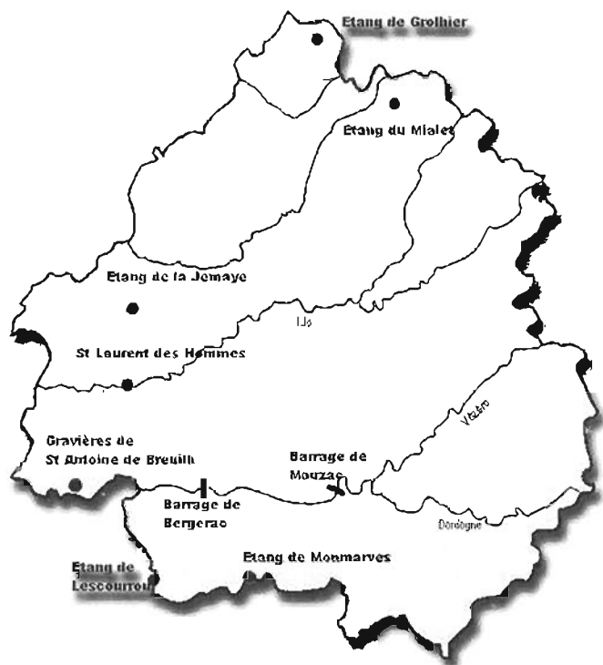
Où voir des oiseaux d'eau en Dordogne

Parmi les canards de surface, l'espèce la mieux représentée est bien entendu le colvert ( Anas platyrhynchos ) mais parmi les quelques milliers d'oiseaux hivernant chaque année, quelle est la part d'individus véritablement sauvages ? Autres espèces régulières mais avec de faibles effectifs : la Sarcelle d'hiver ( Anas crecca ), le Canard chipeau ( Anas strepera ), le siffleur ( Anas penelope ) et le souchet ( Anas clypeata ).