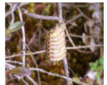
Photographie : Oothèque d'Empuse commune