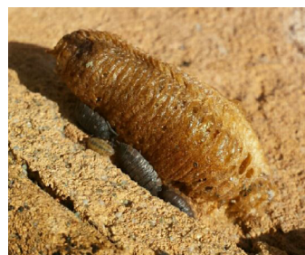
Photographie : Oothèque de Mante religieuse

On peut détecter la présence des mantes grâce à leurs oothèques. Il s'agit de coques sèches secrétées lors de la ponte et qui contiennent les œufs.