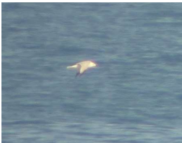
Goéland d'audouin - Lit-et-Mixe (40) - 30/05/2019

Une donnée de plus pour cette espèce d'origine méditerranéenne qui est devenue quasiment annuelle en Aquitaine, mais en très faible effectif. Les observations sont souvent réalisées au printemps, ce qui correspond au retour des individus espagnols sur leurs sites de reproduction et qui confirme aussi l'intérêt de prospector les reposoirs de laridés à cette période.