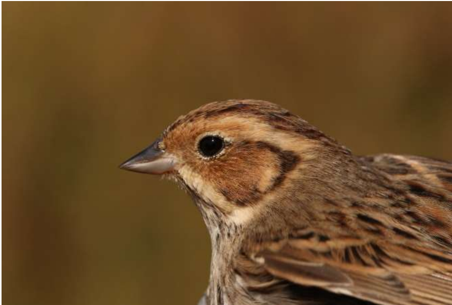
Bruant nain - Messanges (40) - 04/10/2019