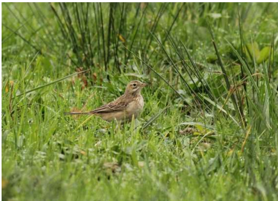
Pipit de Richard - Barthes de l'Adour (40) - 02/01/2019 - Frédéric Cazaban