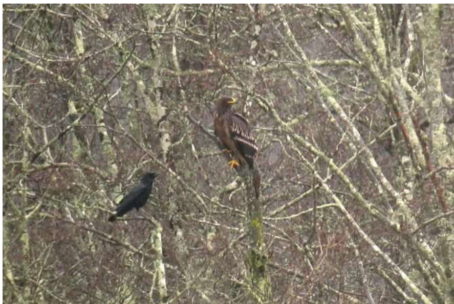
Aigle criard 2A - St Martin de Seignanx - 31/01/2019 - Frédéric Cazaban

Il semble que de toute évidence au moins 3 individus différents ont fréquenté l'Aquitaine durant l'hiver 2018/19. L'aigle adulte habituel de la réserve de Lesgau (40) a stationné du 30 octobre au 12 mars. Il est possible que l'oiseau observé le 28 octobre à Moisan soit ce même oiseau contacté lors de sa migration postnuptiale juste avant son arrivée dans le sud des Landes. Sur cette même réserve de St Martin de Seignanx, un second oiseau de 2ème année a été observé parfois en simultané avec l'adulte du 23 janvier au 31 janvier. Enfin, un troisième oiseau immature a fréquenté la réserve d'Arjuzanx au moins du 15 janvier au 10 février. Le statut taxonomique des immatures n'as pas été tranché quant à savoir si ce sont des individus de souche pure ou des hybrides Clanga clanga x C. pomarina .