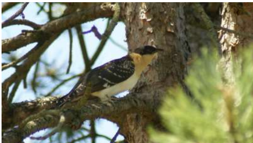
Coucou geai - Fonroque (24) - 14/07/2019 -Marie-Claude Mahieu