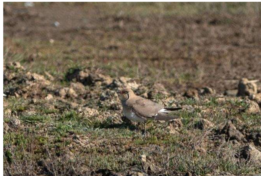
Glaréole à collier - Le Teich Réserve Ornithologique (33) - 01/05/2019 - Jacques Dubos

Ces deux données supplémentaires font suite à la belle série d'observations réalisées en Aquitaine depuis 38 ans (2014, 2012, 2011, 2006, 2003, 2000, 1999, 1998, 1982). Il aura fallu attendre 4 ans pour que de nouveau cette espèce soit signalée dans notre région, ce qui montre clairement la rareté de ce migrateur, dont les observations ne sont pas annuelles.