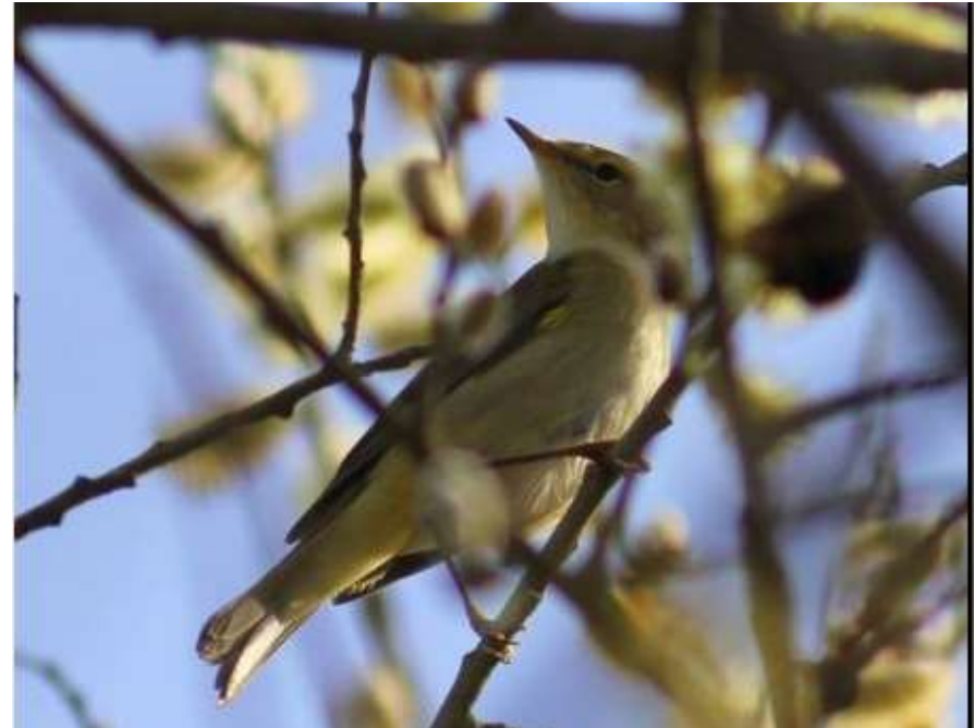
Pouillot ibérique - Messanges (40) - 16/03/2019 - Frédéric Cazaban

La période traitée ici rassemble 6 mentions de l'espèce hors de la zone de reproduction connue dans les Pyrénées-Atlantiques. Toutes concernent des oiseaux chanteurs contactés au printemps, 3 en Gironde et 3 dans les Landes. Seul un oiseau est resté cantonné de mi-avril à fin mai dans un parc à Gradignan-33, sans pour autant qu'une reproduction puisse être confirmée.