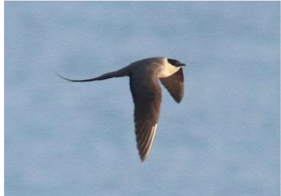
Labbe à longue queue - Grayan et l'Hôpital (33) - 08/07/2019 - Ingo Rösler