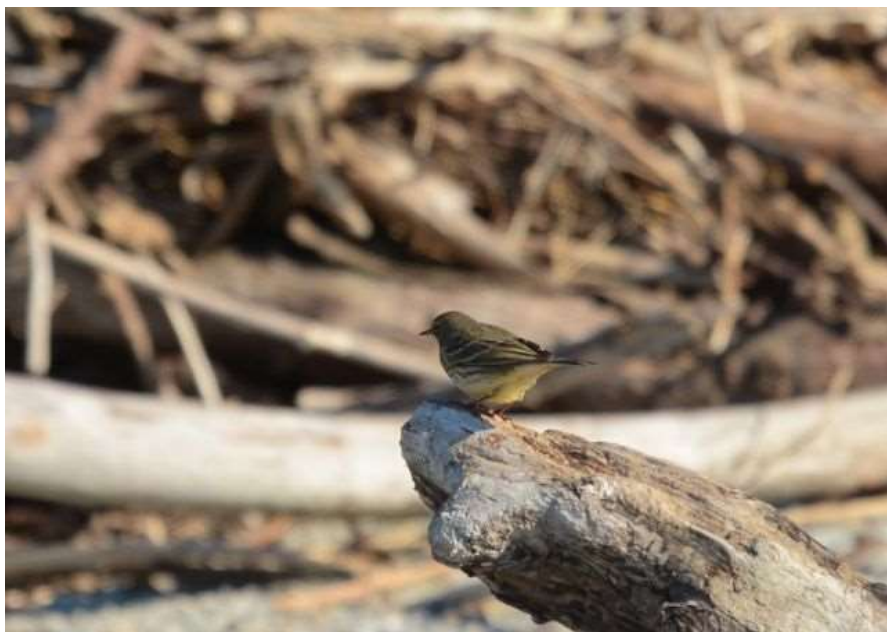
Pipit maritime - Anglet (64)- 09/10/2018 - Miguel Eraso