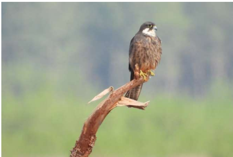
Falcon d'Eléonore ad - Parentis-en-Born (40) - 24/06/2019 - Sophie Damian-Picollet

Toutes les données se situent entre juin et octobre pour cette espèce à la singulière migration. Notons la donnée très précoce de mi-avril à la Pointe-de-Grave qui sort de la phénologie habituelle. Continuons d'être attentifs, quelque soit l'endroit en Aquitaine, aux faucons de type hobereaux... Une belle surprise peut être au rendez-vous !