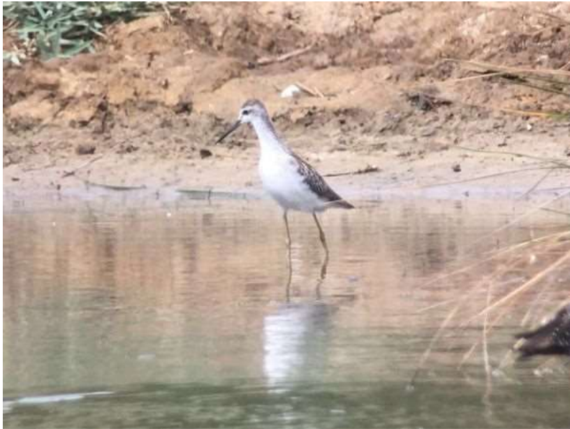
Chevalier stagnatile- Le Teich (33) - 28/08/2018- Philippe Legay