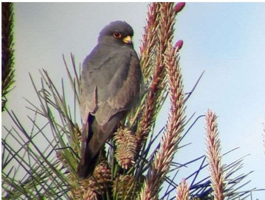
Falcon Kobez mâle 2A - Cestas (33) - 05/05/2019 - Alexandre Hurtault