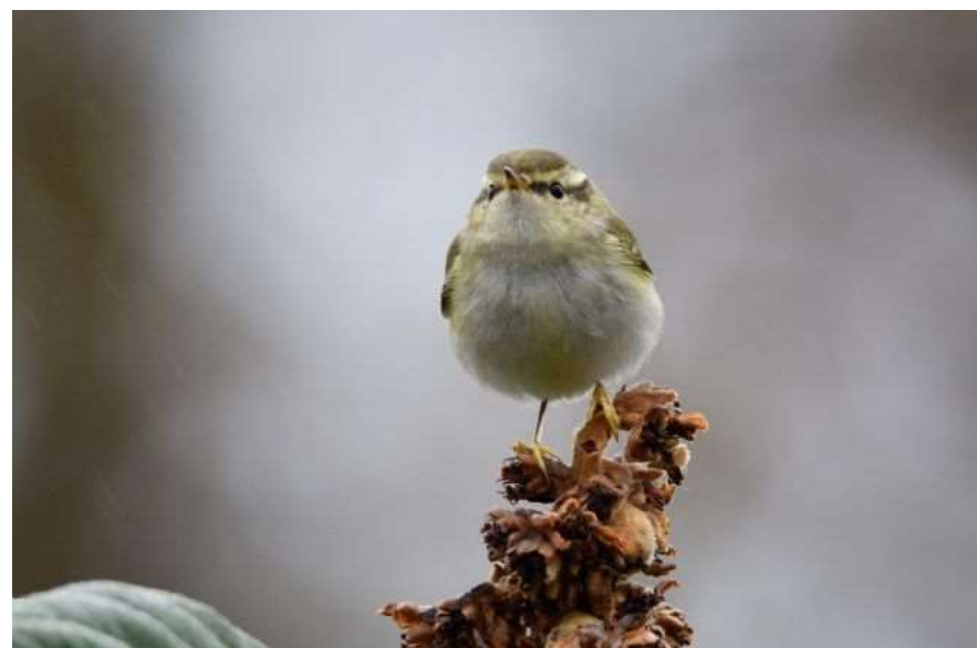
Pouillot à grands sourcils - Pau (64) - 14/01/2019

suivi ou de baguage des passereaux donnant maintenant lieu à des mentions chaque année. Messanges est comme toujours en tête, mais plusieurs oiseaux sont aussi observés à Villefranque, aux Agaçats, au Cap Ferret, sur la désormais célèbre lagune de Contaut à Hourtin ou encore au Marais d'Orx. La plupart des observations a lieu sur des sites proches de la côte, ce qui coïncide aussi avec une forte pression d'observation. Les données de Bordeaux (33), Méès (40), Billères (64) et de Pau (64) suggèrent que l'espèce passe aussi plus à l'intérieur des terres. Enfin, la donnée paloise (50 jours de stationnement au moins de mi-décembre à début février) fournit la première mention d'hivernage en Aquitaine, ce qui est cohérent au regard de l'évolution du statut de l'espèce en France.