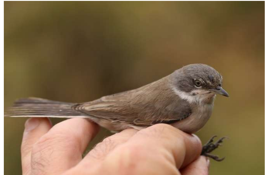
Fauvette babillarde - Messanges - 01/10/2018 - Stéphan Tillo

Deux mentions pour cette espèce dont une capture pour baguage le 1er octobre sur le marais de Moïsan et une observation au Cap Ferret le 4 novembre. Les deux données s'inscrivent dans la phénologie postnuptiale classique.