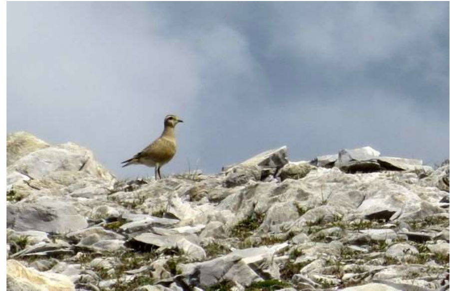
Guignard d'Eurasie - Eaux-Bonnes (64) - 08/09/2018 - Caroline Dunesme