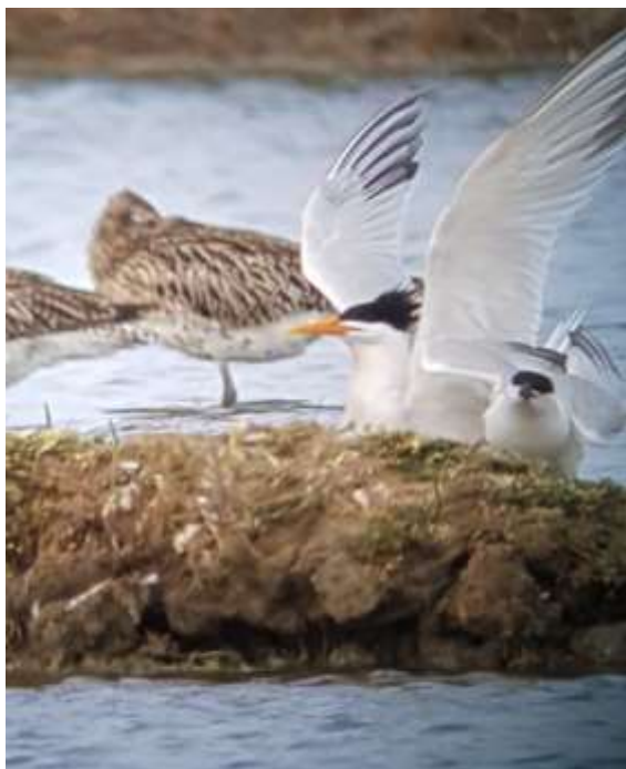
Sterne élégante - Le Teich (33) - 04/06/2019 - Le Teich Réserve Ornithologique-PNRLG