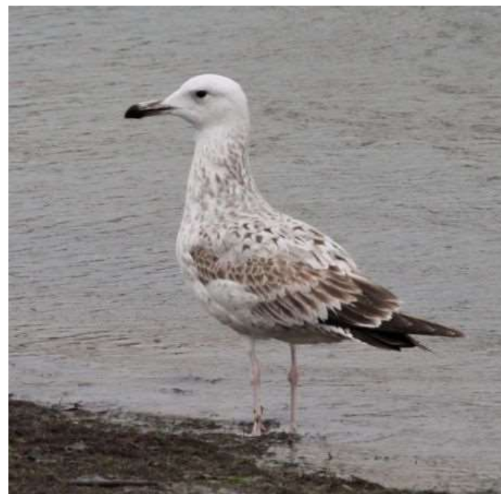
Goéland pontique - Ciboure (64) - 10/03/2019 - Bertrand Lamothe

populations européennes. Nous pouvons tabler, pour l'hiver 2018-19, sur une fourchette de 105 à 153 oiseaux en nous basant sur des critères d'âges. Pour mémoire, sur la période précédente, une fourchette de 112 à 186 goélands avait été retenue. Les données se répartissent sur les 3 départements côtiers de notre région. Néanmoins un travail de prospection reste à effectuer sur des sites prometteurs comme les sites d'enfouissement girondins. L'analyse des tableaux ci-dessus fait ressortir que les adultes semblent délaisser le sud de la région. La plage temporelle de présence de l'espèce dans notre région semble s'étendre.