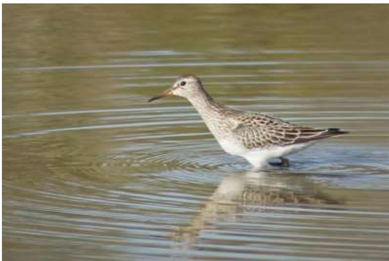
Bécasseau tacheté - Audenge(33) - 17/10/2018 - Philippe Nadé