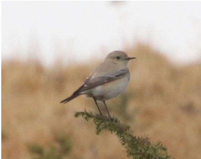
Traquet du désert femelle - Béhorléguy (64)- 29/12/2018 - Bertrand Lamothe

Observation remarquable par sa localisation: en montagne, dans un lieu où on ne s'attend pas à trouver un Traquet du désert, bravo à l'observateur ! L'espèce est rarissime en Aquitaine, ainsi il s'agit seulement de la troisième donnée homologuée, après une en 2007 au Cap-Ferret et l'hivernage longue durée d'un jeune mâle sur les dunes de Tarnos en 2014-2015.