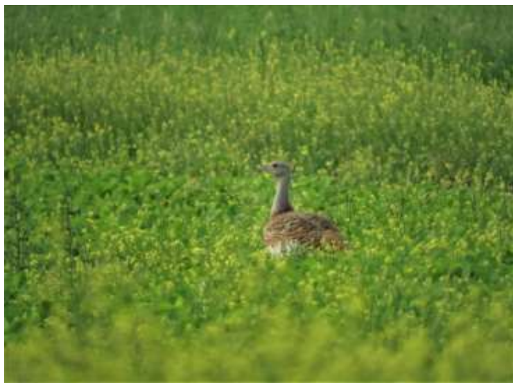
Outarde barbue mâle immature - Montaut (24) - 25/06/2019 - David Lambottin

Une nouvelle donnée d'Outarde barbue après l'observation d'un individu à l'automne précédent au niveau du col d'Organbidexka. Il s'agit d'un mâle immature observé pendant 6 jours se nourrissant dans des friches et des champs de colza en Dordogne, constituant la première mention de l'espèce pour ce département. Cette observation s'inscrit dans la phénologie connue d'erratisme estival de quelques individus de la population espagnole. Cette donnée n'a pas encore fait l'objet d'une décision du CHN au moment de la rédaction de ce rapport. Mais nul doute qu'elle sera validée au regard des documents photographiques fournis.