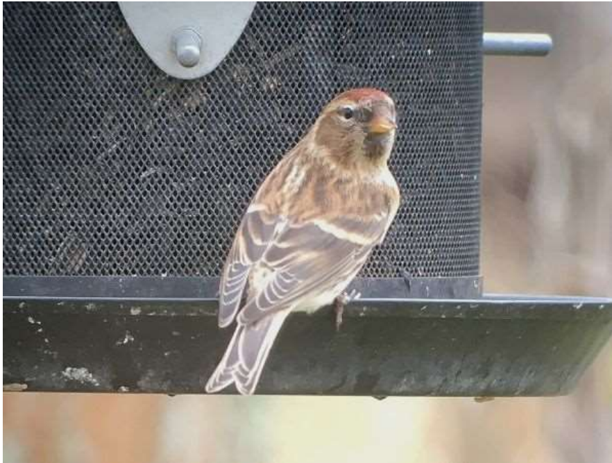
Sizerin cabaret à Monbazillac – 30/12/17

Un oiseau présent à Monbazillac et se nourrissant à la mangeoire du 28 décembre 2017 au 21 janvier 2018 (Céline Bonnet et Corinne Aublanc). Un autre à Rouffignac-Saint-Cernin-de-Reilhac du 11 au 14 janvier 2018 (Frédéric Plassard). Données homologuées par le CHA.