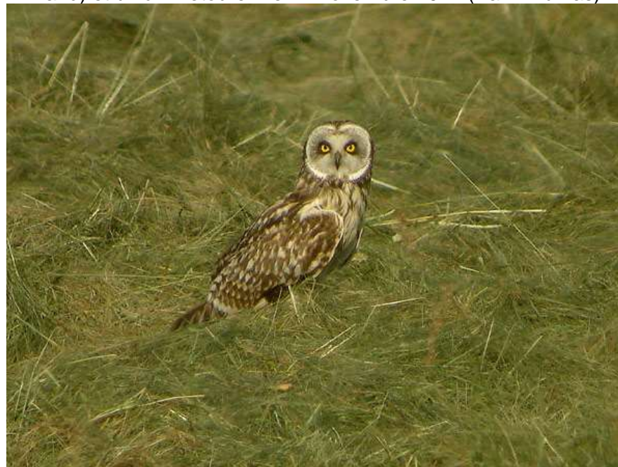
Hibou des marais à Saint-Aubin-de-Lanquais – 29/05/12

Un observé à Bergerac le 23 novembre 2003 (Jean-Louis Verrier), un à Gout-Rossignol le 15 avril 2006 (Lucien Basque), un à Vieux-Mareuil le 22 janvier 2011 (Christophe Chambolle), un à Saint-Aubin-de-Lanquais du 29 mai au 25 juin 2012 (Jean-Claude Bonnet), un à Javerlhac-et-la-Chapelle-Saint-Robert le 20 octobre 2012 (Anthony Leclerc), 2 à l'aéroport de Bergerac le 27 février 2013 (Amélie Armand) et un à Villeteureix le 17 novembre 2017 (Yann Dumas).