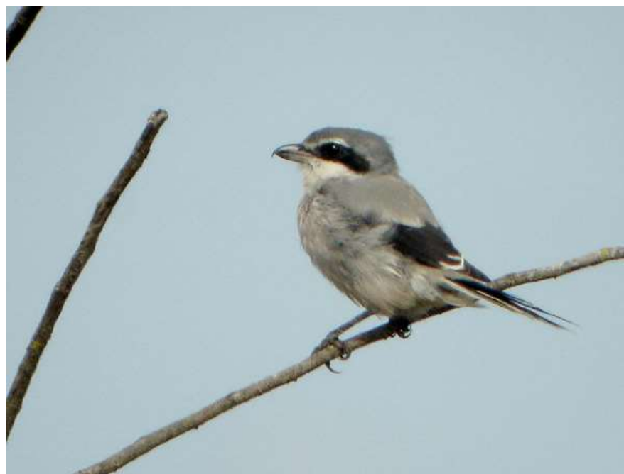
Pie-grièche méridionale à Faux – 29/09/12

Une observée le 19 février 2002 et une le 26 août 2006 à Faux (Jean-Claude Bonnet), une à Eymet le 14 décembre 2011 (Céline Bonnet), une à Faux du 22 septembre au 3 octobre 2012 (David Simpson), une autre au même endroit du 28 septembre 2013 au 20 janvier 2014 (David Simpson), une à Naussannes du 20 septembre au 9 décembre 2016 (David Simpson) et une le 10 mars 2017 à Montaut (David Simpson).