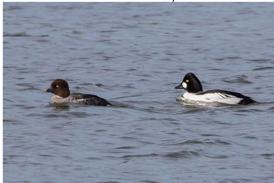
Couple de garrots à œil d'or à Lamothe-Montravel – 08/03/15

Un oiseau observé le 21 janvier 2002 aux gravières de Saint-Antoine-de-Breuilh (Jean-Claude Bonnet), 2 à Lussas-et-Nontronneau le 10 mars 2010 (Yann Dumas), un à Saint-Antoine-de-Breuilh le 20 décembre 2010 (Céline Bonnet), 3 à Lamothe-Montravel le 15 janvier 2011 (Céline Bonnet), 2 à Vézac le 5 février 2012 (Antoine Gergaud), un puis 2 à Lamothe-Montravel (un mâle et une femelle) du 13 janvier au 13 mars 2015 (Jean-Claude Bonnet et Claude Charron), un puis 4 oiseaux du 13 janvier au 3 mars 2018 à Moulin-Neuf (Nathalie et Didier Verger, Sylvain Wagner). Sur ce site un couple restera présent jusqu'au 15 mars puis un seul oiseau jusqu'au 24 mars 2018 et à nouveau 2 oiseaux seront observés le 13 janvier 2019.