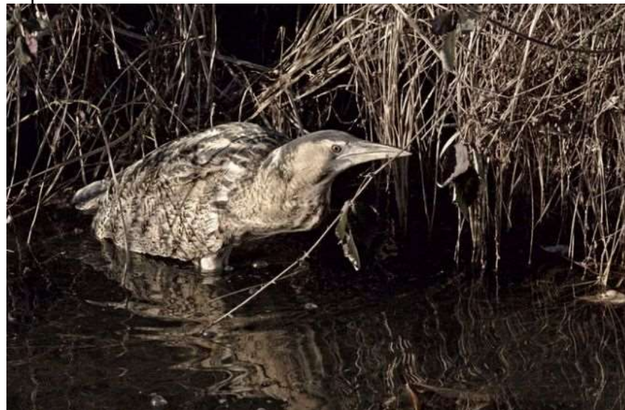
Butor étoilé à Monsec – 12/02/12

Espèce contactée 21 fois de 2000 à 2014. Parmi ces observations, une a eu lieu à une date surprenante le 9 juin 2013 à l'Etang du Tuquet de La Jemaye (Robin Petit – Liris Pomier). Espèce non revue depuis fin 2014.