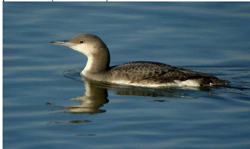
Plongeon arctique à l'Escourou – 04/01/11

Un oiseau observé aux gravières de Saint-Antoine-de-Breuilh le 3 janvier 2004 et un au Lac de l'Escourou du 3 au 13 janvier 2005 (Jean-Claude Bonnet), un autre au Lac de l'Escourou du 2 au 8 janvier 2011 (Céline Bonnet).