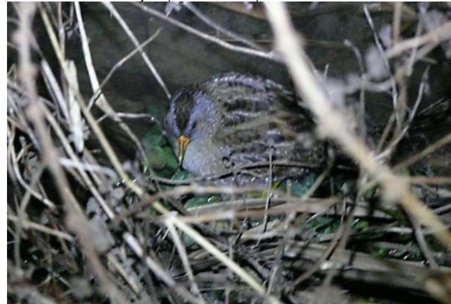
Marouette ponctuée à Champeaux-et-la-chapelle-Pommier – 24/03/12 (Photographie : Julien Robak)

Un oiseau observé par Frédéric Fély à Champeaux-et-la-chapelle-Pommier le 12 avril 2003, un autre photographié le 24 mars 2012 à Saint-Méard-de-Gurçon (Julien Robak).