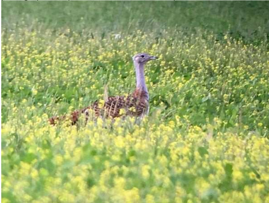
Outarde barbue à Faux – 25/06/19

Présence surprenante d'un mâle de deuxième année à Montaut du 20 au 25 juin 2019 (Frédéric Jiguët et Claude Soubiran). Oiseau photographié, espèce soumise à validation par le CHN.