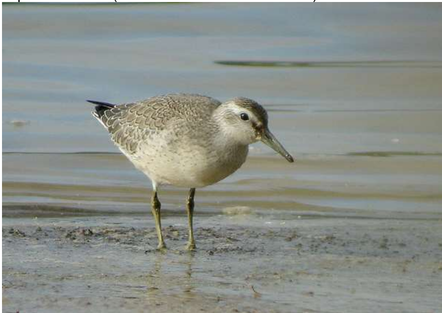
Bécasseau maubèche à Monmarvès – 09/09/10

Présence d'un oiseau au Lac de la Nette à Monmarvès du 6 au 9 septembre 2010 (David Simpson) et d'un autre à Bergerac le 2 septembre 2015 (Céline et Jean-Claude Bonnet)