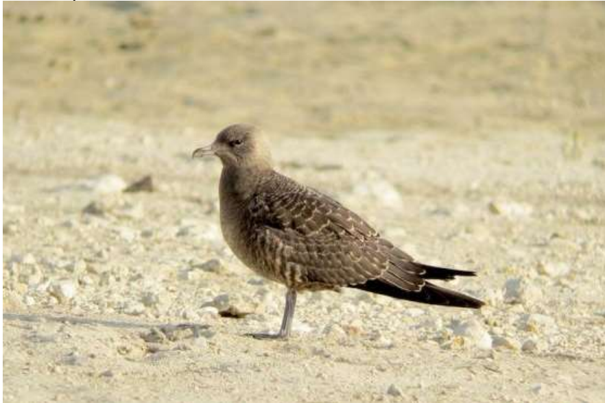
Labbe à longue queue à Tourliac – 23/08/12

Un oiseau observé à Bassillac le 22 août 2012 par Liris Pomier. Probablement le même oiseau retrouvé et photographié le lendemain au Lac de Brayssou à Tourliac (47) par John Beaumont. Donnée validée par le CHA.