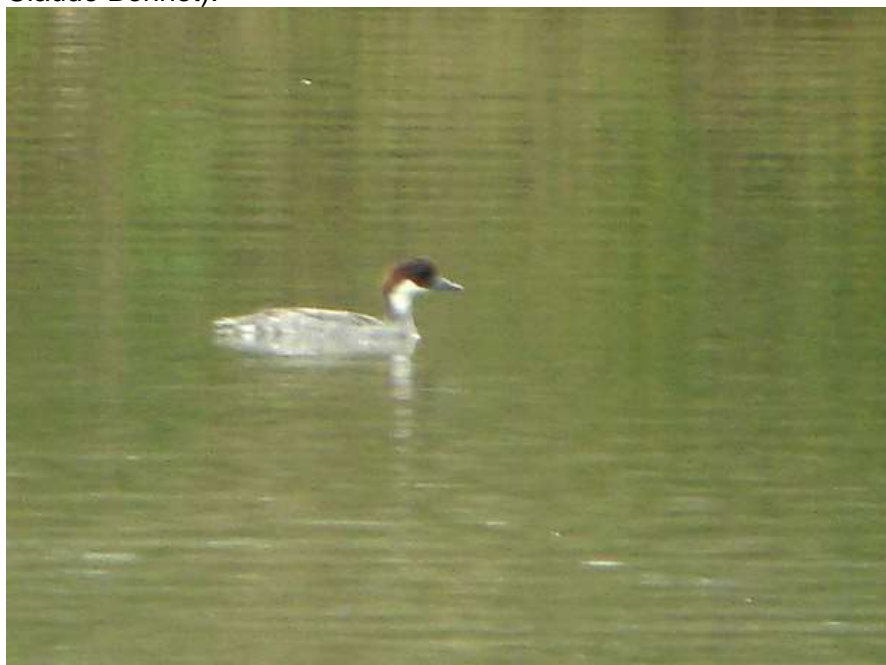
Femelle de Harle piette à Lamothe-Montravel – 16/11/11

Une femelle au Grand Etang de Mialet le 15 janvier 2003 (Jean-Claude Bonnet), une femelle du 16 au 31 janvier 2010 entre Ménesplet et Moulin-Neuf (Guillaume Péplinski), une autre femelle à Lamothe-Montravel du 16 novembre au 20 novembre 2011 (Jean-Claude Bonnet).