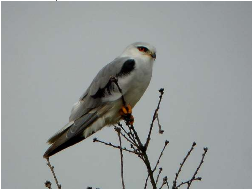
1 er Élanion blanc nicheur de Dordogne à St-Aubin-de-Lanquais – 01/07/12

Aucune observation en Dordogne pour cette espèce jusqu'en 2011. Premier couple nicheur découvert en 2012 par David Simpson. La population départementale peut être estimée à un minimum d'une dizaine de couples en 2019.