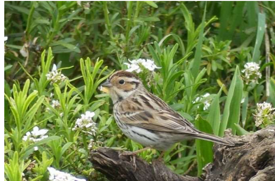
Bruant nain à Sarliac-sur-l'Isle – 28/04/18 (Photographie : Ghislaine Étourneau)

Deux oiseaux présents et photographiés à Sarliac-sur-l'Isle le 28 avril 2018 (Ghislaine Etourneau). Donnée homologuée par le CHA.