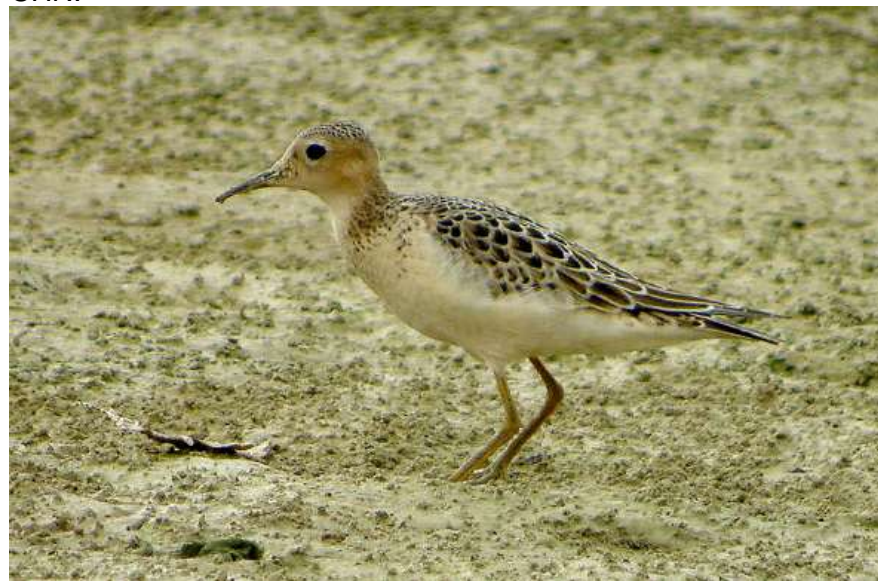
Bécasseau rousset à Eymet – 15/09/11

Un oiseau présent et photographié du 15 au 17 septembre 2011 au Lac de l'Escourou (Jean-Claude Bonnet). Donnée validée par le CHN.