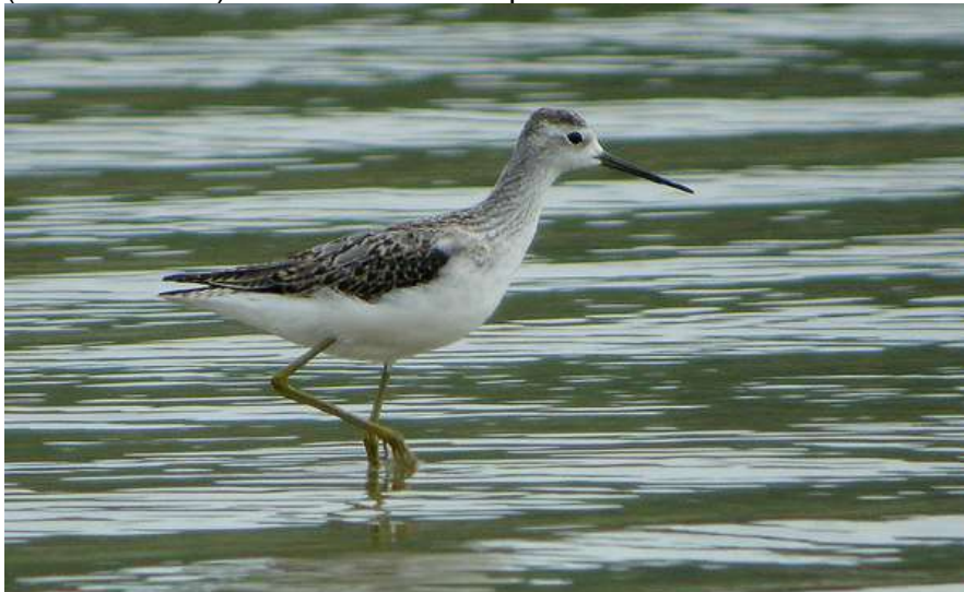
Chevalier stagnatile à Eymet – 11/08/12

Deux oiseaux présents à Lamothe-Montravel le 22 mai 2012 (Thierry Bigey), un autre photographié au Lac de l'Escourou le 11 août 2012 (Céline Bonnet). Données validées par le CHA.