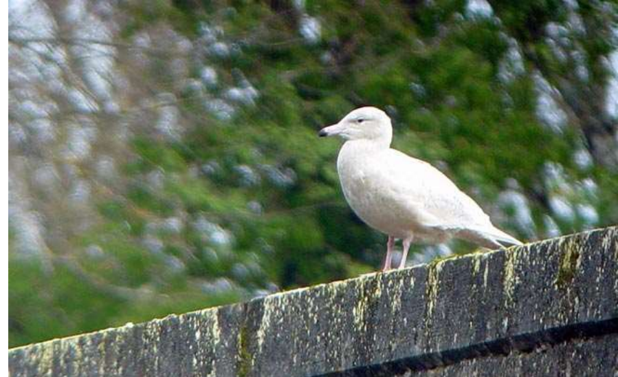
Goéland bourgmestre à Mauzac-et-Grand-Castang – 15/02/05

Un oiseau observé et photographié au barrage de Mauzac du 6 au 15 février 2005 (Marc Chamillard). Donnée validée par le CHA.