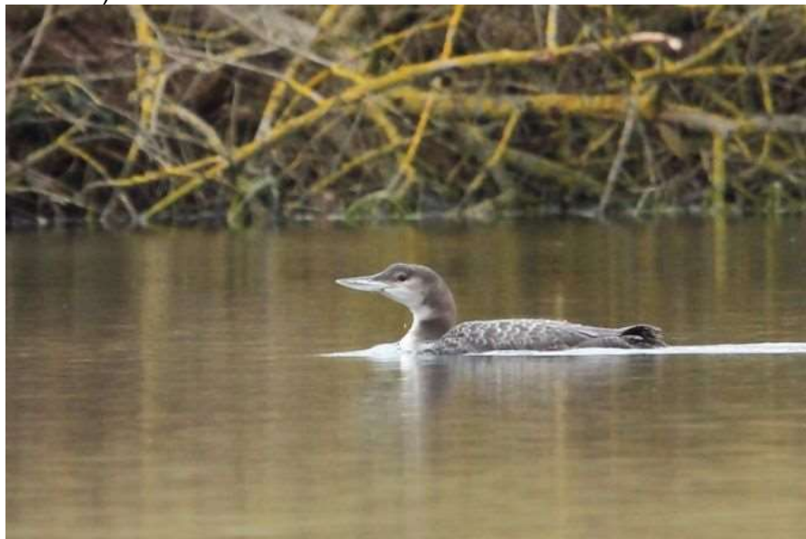
Plongeon imbrin à Gout-Rossignol – 29/01/13