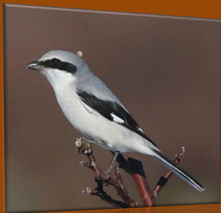
← A gauche : Canard pilelet En vignettes : ci-dessous Pie-grièche grise