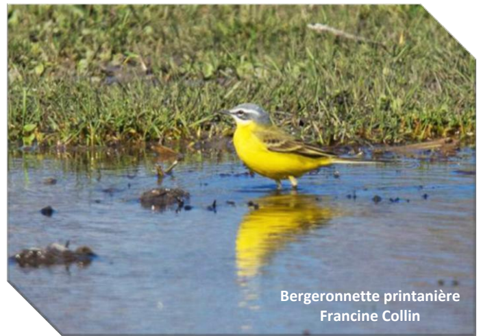
Bergeronnette printanière