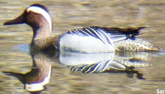
Sarcelle d'été Pierre Carrion