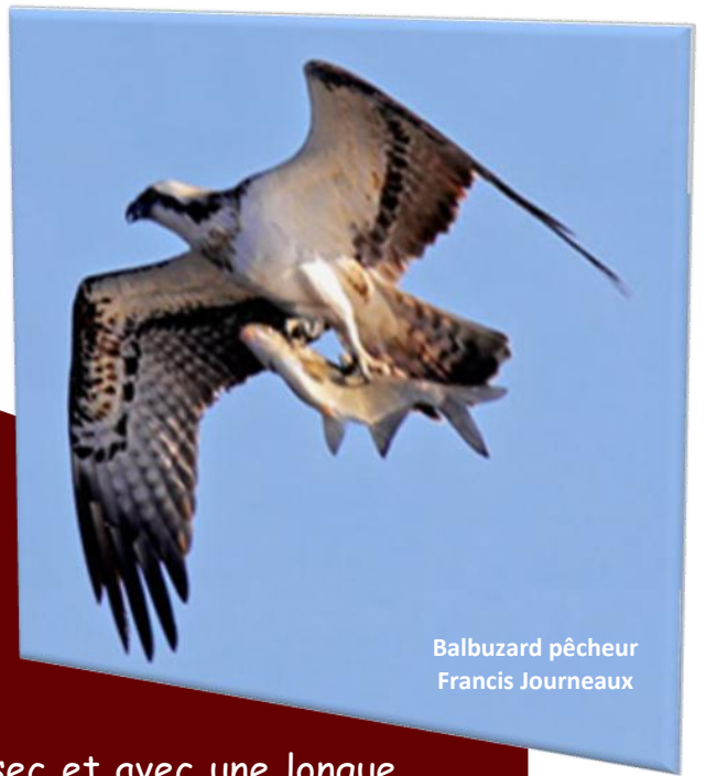
Balbuzard pêcheur Francis Journeaux