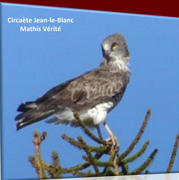
Circaète Jean-le-Blanc Mathis Vérité