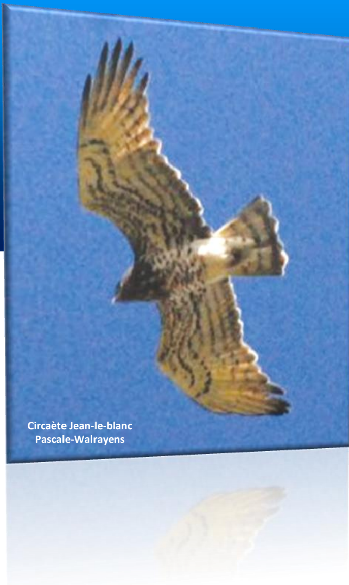
Circaète Jean-le-blanc Pascale-Walrayens