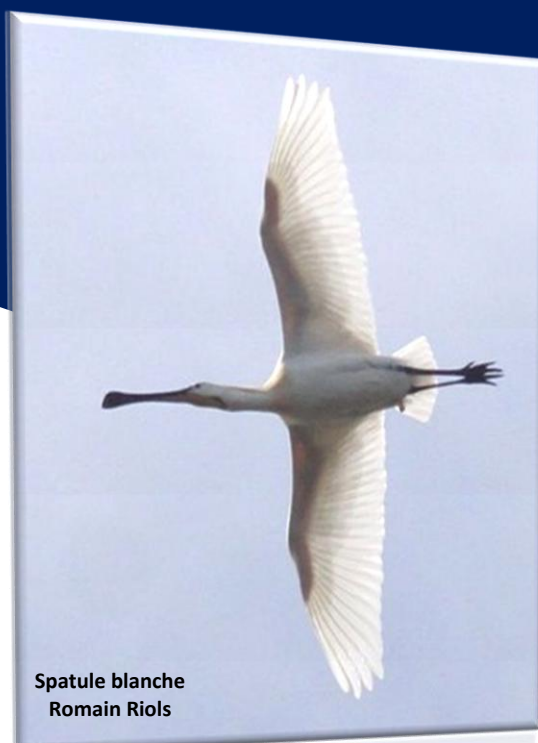
Spatule blanche Romain Riols