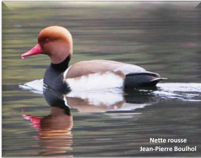
Nette rousse Jean-Pierre Boulhol

Présence sur 4 sites dispersés (une dizaine d'oiseaux) et surtout Joze-Maringues en 63 (max. de 27 oiseaux). C'est un peu faible.