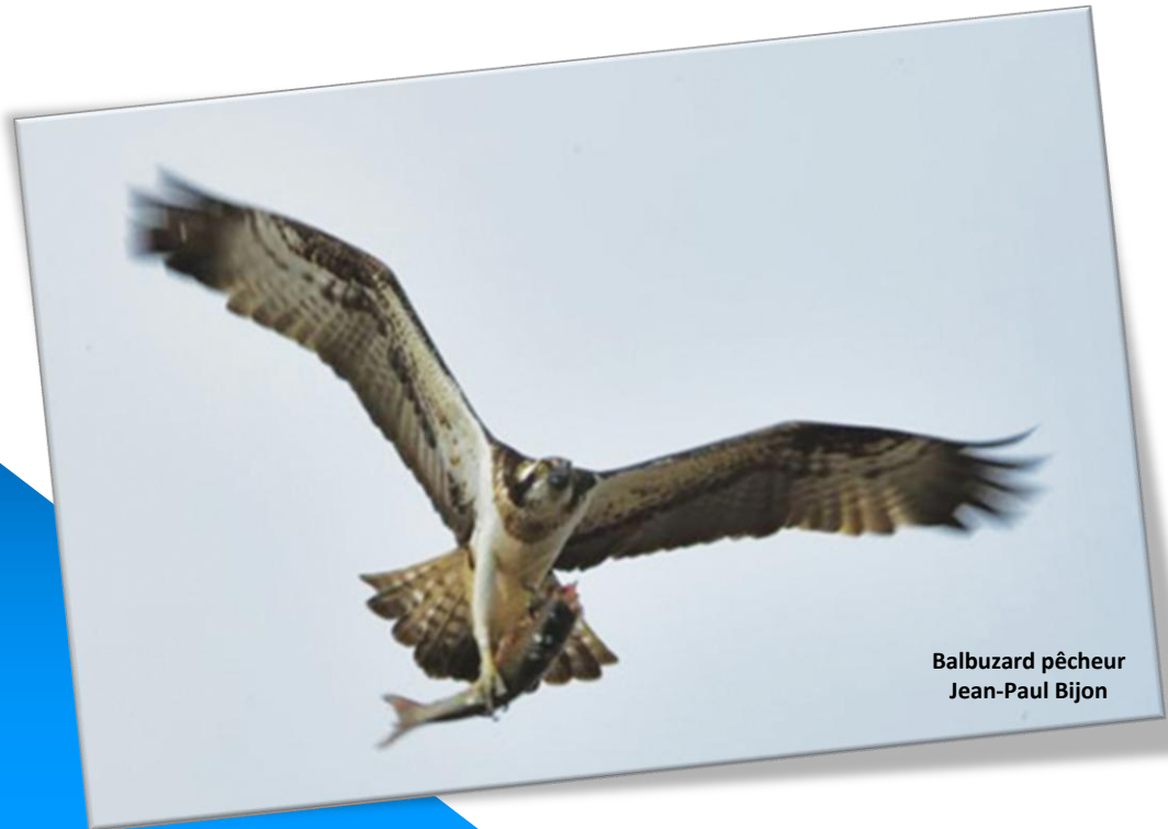
Balbuzard pêcheur Jean-Paul Bijon