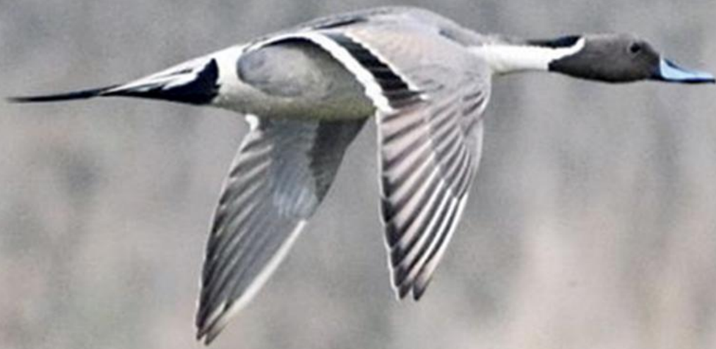
Canard pilelet_Thérèse Reijs