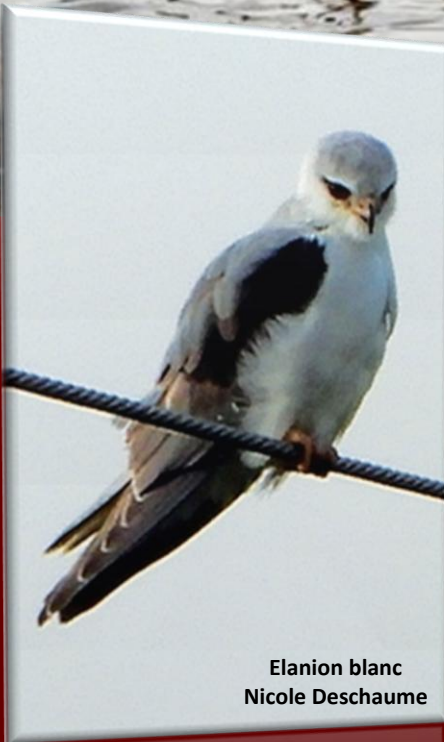
Elanion blanc Nicole Deschaume

Mois de mars sans incident majeur : un peu de froid au début, du brouillard parfois, du vent aussi, du très beau temps en fin de mois. Malgré cela le nombre de données a été plutôt faible : un peu plus de 67 000 , contre plus de 76 000 en 2021. Au total 173 espèces sauvages ont été notées, dont 34 non nicheurs, chiffre un peu faible.