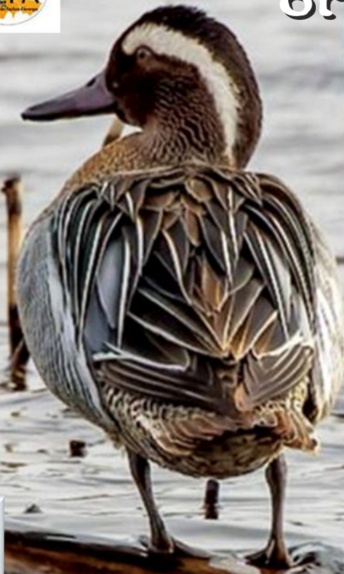
Sarcelle d'été Francis Journeaux