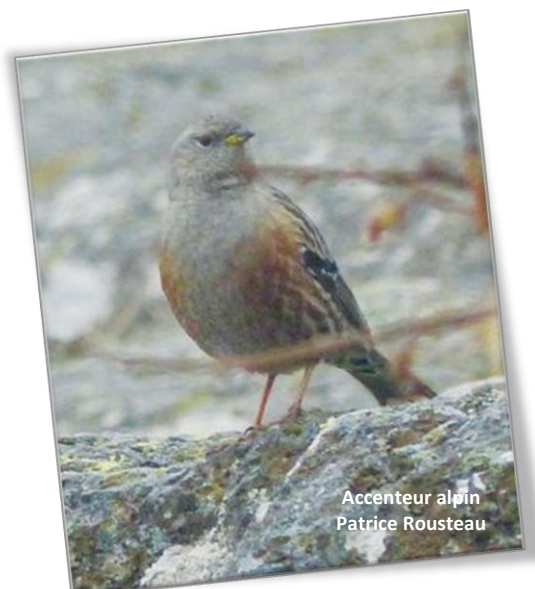
Accenteur alpin Patrice Rousteau