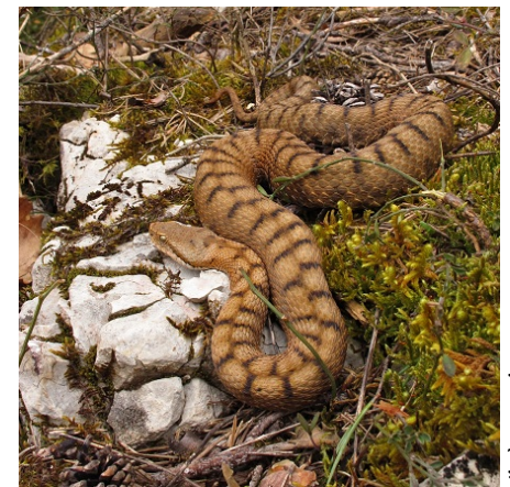
Vipère aspic

Lézard des murailles : 182 données Lézard ocellé : 3 données sur des sites connus, le 16 avril à Crozes-Hermitage (B. Delhome) et les 3 et 20 mai à Villeperdrix (C. Tessier et J. Traversier)