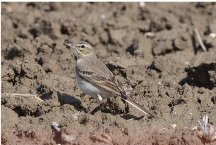
Pipit rousseline

Hibou moyen-duc : noté à 8 reprises. Couvaision notée 6/4 à Romans-sur-Isère, où un jeune est signalé le 18/4 (L. David et G. Trochard), ainsi que le 30/5 à Saint-Martin-en-Vercors (F. Arod)