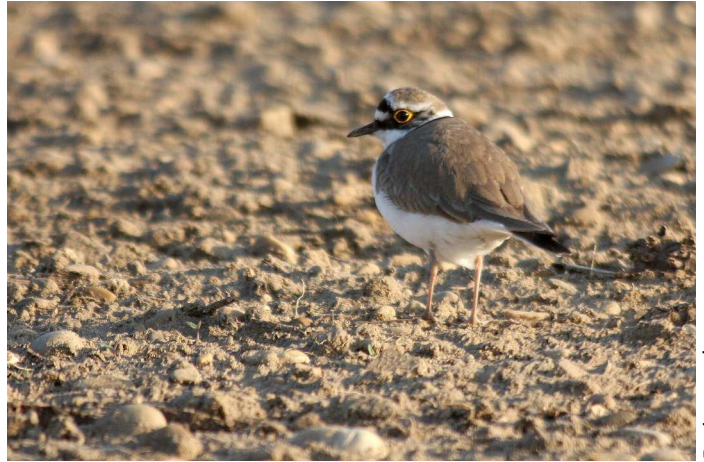
Petit gravelot

(V. Lallia), commune sur laquelle des indices de reproduction possible / probable sont notés, tout comme à La Bâtie-Rolland (B. Misiak), Saint-Gervais-sur-Roubion (D. Arsac), Anneyron (F. Légglise), Chabeuil (C.H. Traversier), Pierrelatte (V. Fort), La Garde-Adhémar (V. Fort et J.-L. Bonis), Tulette (T. Deana et J.-N. Heron), Châteauneuf-sur-Isère et Saint-Marcel-lès-Valence (V. Chartendault)