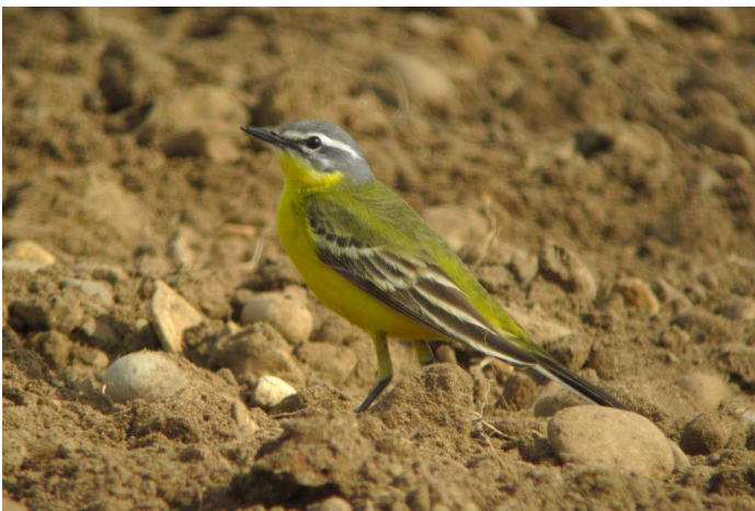
Bergeronnette printanière - photo : Vincent Palomares

Pipit spioncelle : seulement 7 données dont 5 concernant des migrants en avril : 1 le 6, 9 et 13/4 à Albon (V. Palomares et F. Légise), 1 le 8/4 à Eurre (A. Vernet) et 1 le 21/4 à Romans-sur-Isère (F. Lloret). Nicheur possible à Lus-la-Croix-Haute (F. Varagnat) et Treschen-Creyers (A. Vemet)