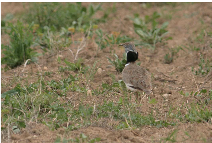
Outarde canepetière