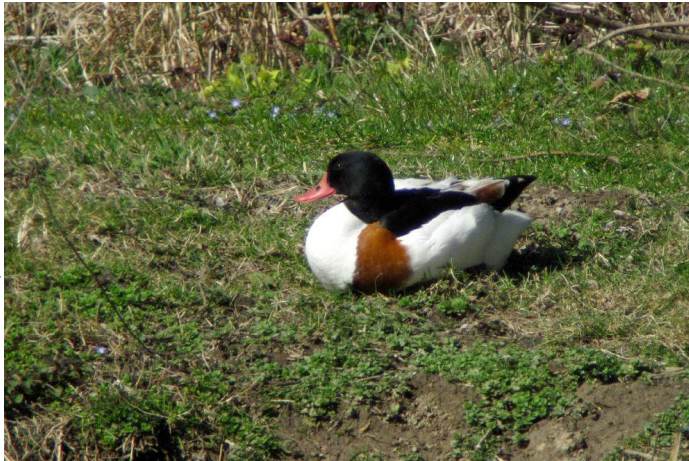
Tadome de Belon - photo: Vincent Palomares

Ouette d'Égypte : le couple de Châteauneuf-du-Rhône, s'étant reproduit les deux années passées, a remis cela cette année mais de manière encore plus précoce, un mois plus tôt, avec l'apparition d'une nichée de 5 poussins le 10/4 (J-L. Bonis). Un deuxième couple est observé sur Montélimar mais aucune reproduction n'y est pour l'instant observée (C. Durand-Leboup et J.C. Cordara)