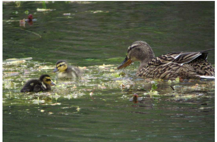
Canard colvert

Milan royal : près de 370 migrateurs observés à Pierre-Aiguille, 257 en mars, 81 en avril et encore 30 en mai (pour l'essentiel, des immatures de 2 e année ce dernier mois). Les effectifs paraissent plus élevés que la moyenne cette année avec plusieurs journées de mars totalisant plus de 40 individus : 41 le 8, 54 le 9 (R. Métais) et 57 le 26 (C-H. Traversier) ; encore 23 le 17/4 (B. Delhome).