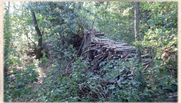
Le tas de bois constitue un refuge idéal pour le hérisson

Prairies, zones agricoles, parcs et jardins, souvent en ville. Il évite les zones sans végétations et dépourvues d'abri. Il apprécie fortement les potagers et les jardins bien arrosés . En Drôme l'espèce est majoritairement présente en zone de plaine et peu dans les zones de montagne.