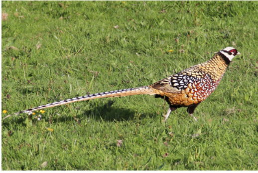
Faisan vénéré Syrmaticus reevesii , avril 2016, Pageas (87)Ch. Couartou.