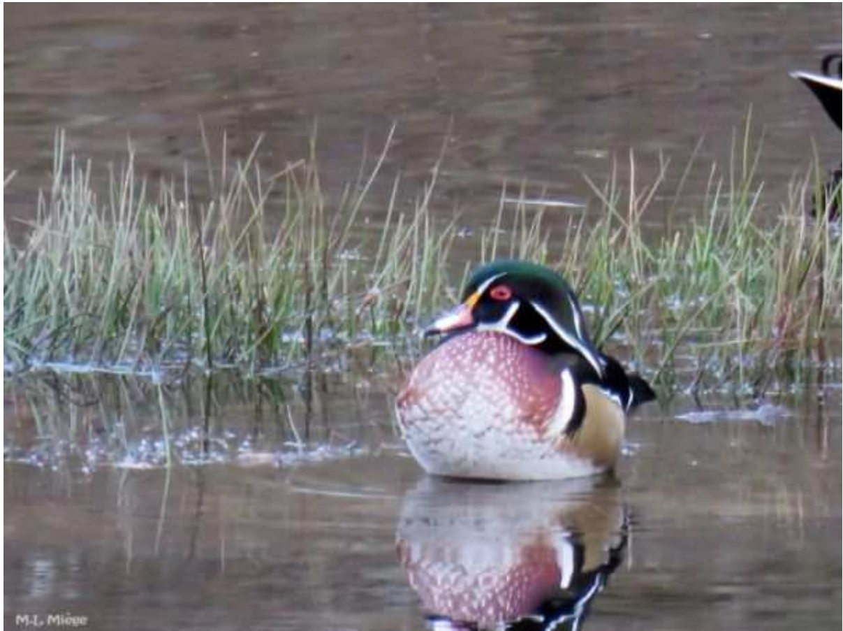
Canard carolin Aix sponsa , décembre 2016, Égletons (19) M.L. Miège.

Haute-Vienne - Nexon/Étang de la lande, le 15/01/2016 (J.M. Célérier).