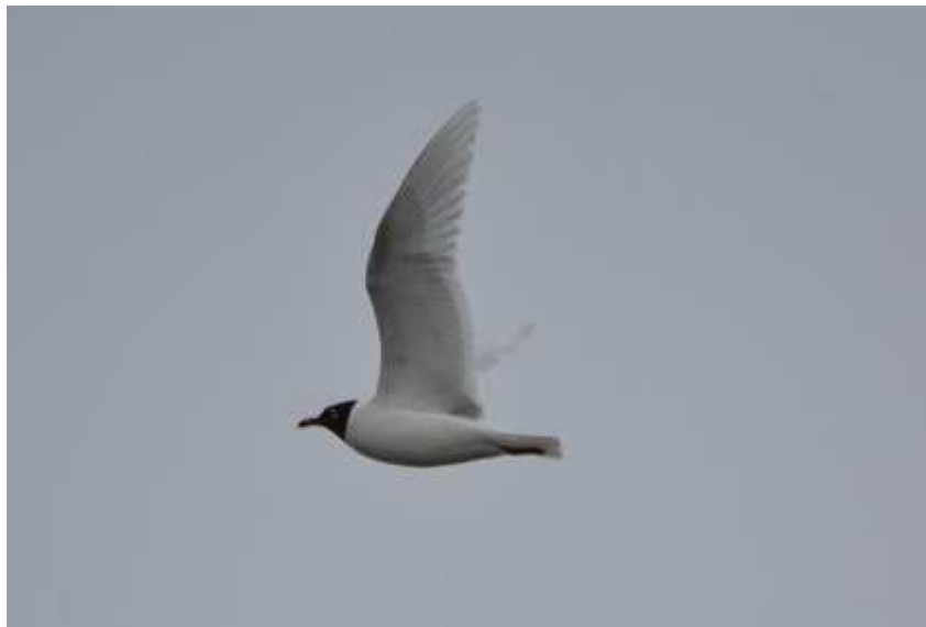
Mouette mélanocéphale Larus melanocephalus , ad., avril 2016, Sérandon (19) N. Gauthier.

A la différence de 2015, la majorité des observations sont survenues lors de la migration postnuptiale qui est généralement la moins importante. L'observation d'un individu en migration active en Corrèze en août est totalement inattendue. La première apparition de l'espèce en Limousin remonte à 1996 et au fil des ans on perçoit une augmentation du nombre d'observations.