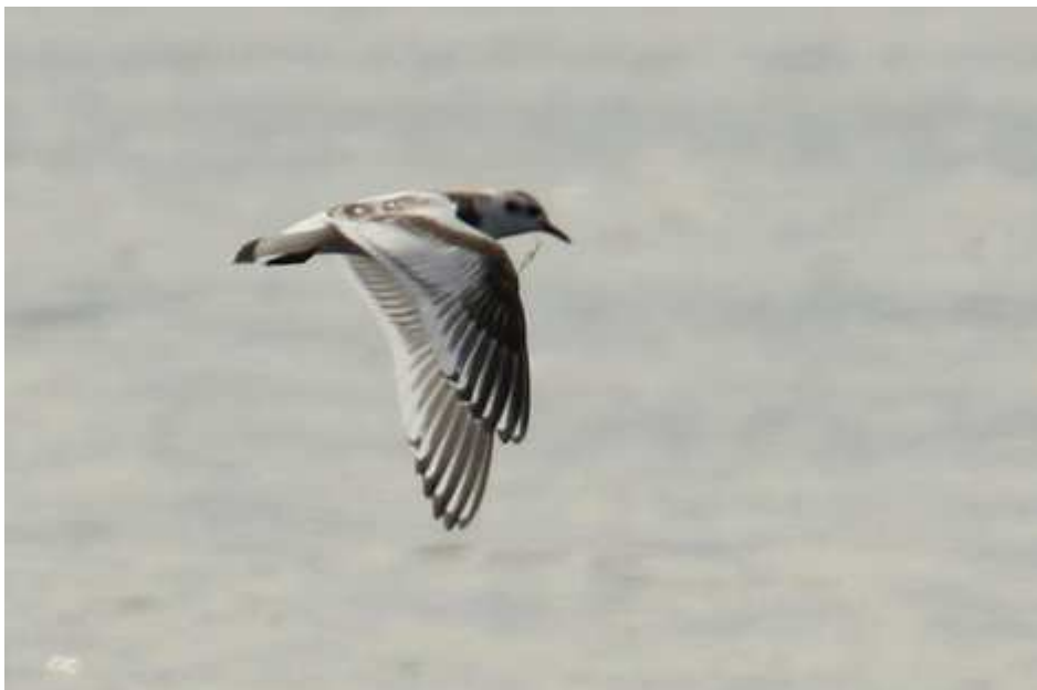
Mouette pygmée Hydrocoloeus minutus , 1A, août 2016, Lussat (23) J.P. Toumazet.

Une nouvelle fois, toutes les mentions limousines de 2016 proviennent de l'Étang des Landes. Les mouettes pygmées se reproduisent dans l'est et le nord de l'Europe, régions qu'elles quittent en hiver. C'est lors des passages migratoires qu'on peut rencontrer l'espèce dans la région, même si les occasions sont rares et manifestement limitées à l'Étang des Landes. Classiquement, les contacts sont beaucoup plus nombreux lors de la migration postnuptiale.