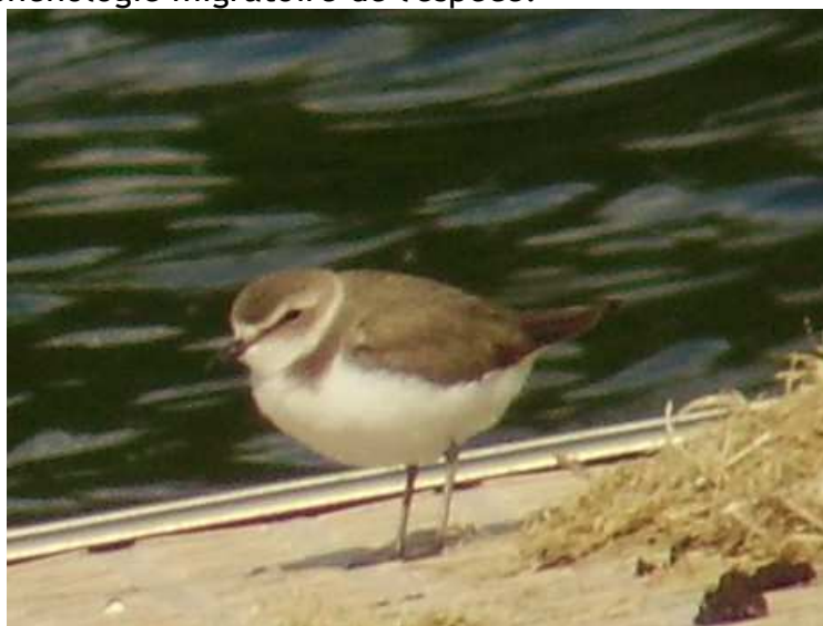
Gravelot à collier interrompu Charadrius alexandrinus , mai 2016, Aubazine (19) P. Marthon.

C'est la première fois que ce gravelot est homologué. Cette première apparition corrézienne fait suite à celles d'avril 2003 à l'étang des Landes (23) et celui de la Mazère (87) en mai 1997. Le Gravelot à collier interrompu est rare à l'intérieur des terres où il apparaît le plus fréquemment lors de la migration pré-nuptiale. Cette observation respecte donc la phénologie migratoire de l'espèce.