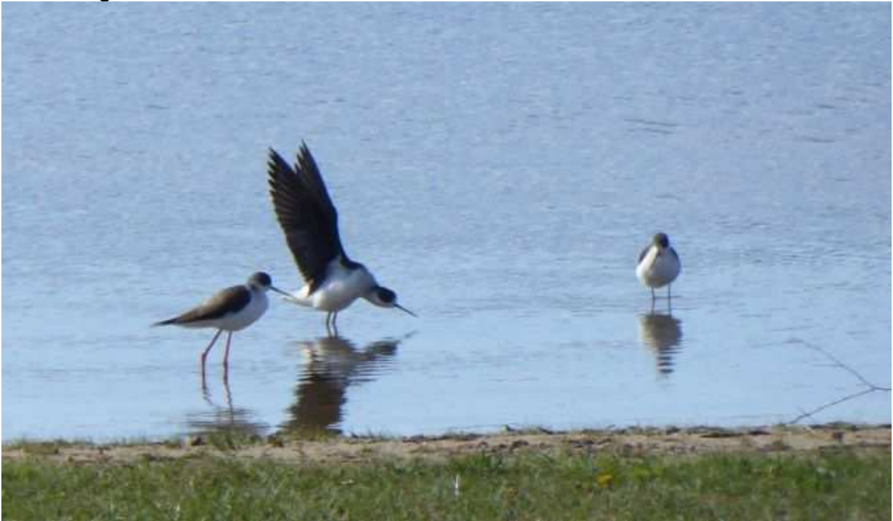
Échasse blanche Himantopus himantopus , 3 mâles ad., avril 2016, Aubazine (19) P. Marthon.

Le record des nombres d'individus et de citations est dépassé grâce aux 5 mentions pour 16 individus à l'Étang des Landes. Quasiment chaque année l'Échasse blanche fait une brève escale au plan d'eau du Coiroux et au lac de Neuvic. Classiquement ces apparitions sont survenues lors de la migration pré-nuptiale, curieusement aucun contact n'est enregistré en Haute-Vienne.