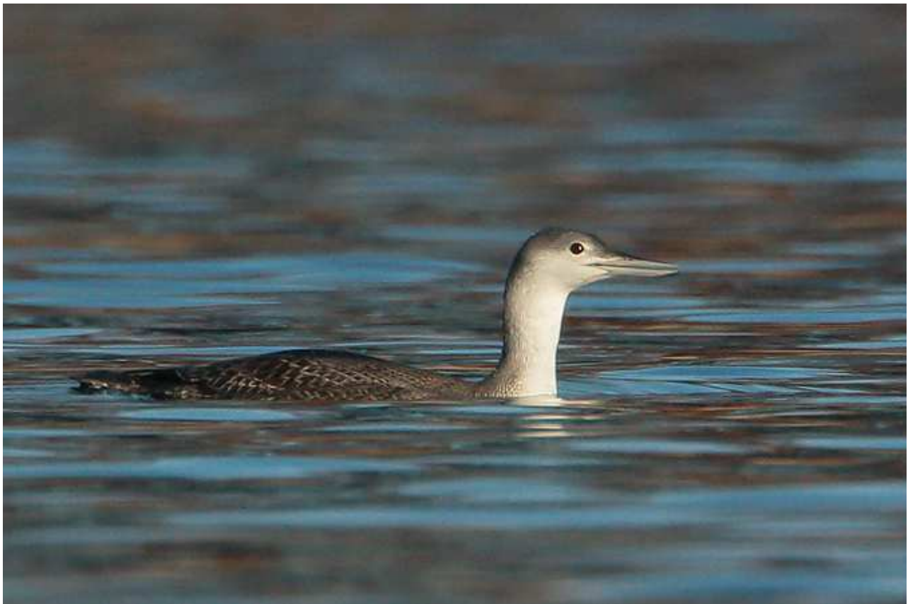
Plongeon catmarin Gavia stellata , ind. 1A décembre 2016, Beaumont-du-Lac (87) Ch. Mercier.