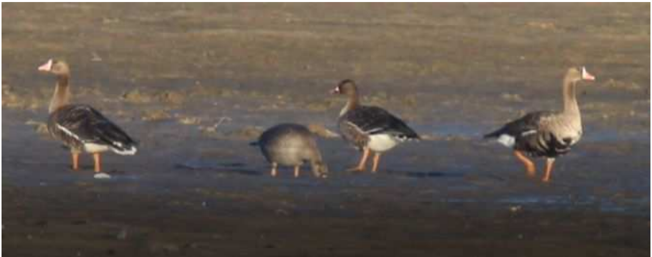
Oies rieuses Anser albifrons , ad. et juv., novembre 2016, Lussat (23) V. Primault.

Homologuée pour la 4 ème fois et une nouvelle fois à l'Étang des Landes, cette famille d'Oies rieuses ayant stationné près de 3 semaines a fait le bonheur de nombreux observateurs. Pour la première fois un effectif aussi important est noté en Limousin. Comme lors des apparitions précédentes elle est survenue en fin d'automne lors de la phase de migration postnuptiale.