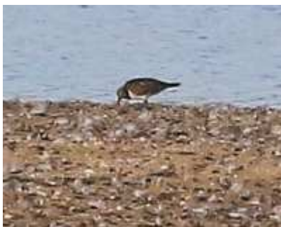
Tournepierre à collier arenaria interpres , septembre 2016, Lussat (23) B. Brunet.

Après 4 années blanches, l'espèce apparaît à nouveau. Toutes les homologations concernent des oiseaux juvéniles observés lors de la migration postnuptiale. Pourtant les données anciennes montrent que des contacts peuvent être réalisés lors des deux phases migratoires.