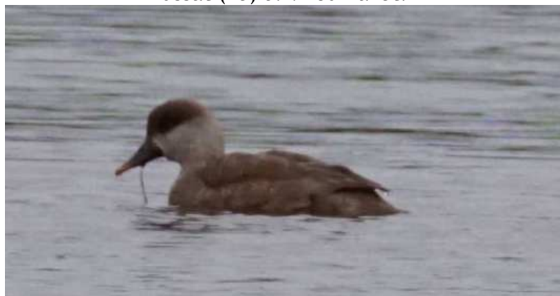
Nette rousse Netta rufina , fem., octobre 2016, Lussat (23) D. Philippon.