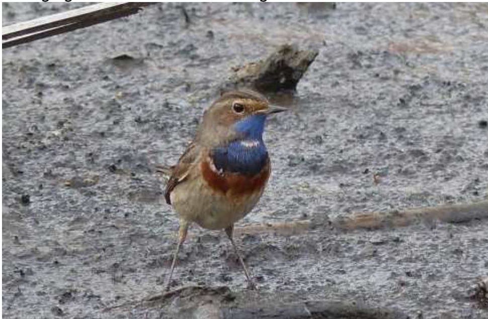
Gorgebleue à miroir Luscinia svecica , mâle, mars 2016, Limoges (87) N. Lagarde.

L'attractivité de l'Étang des Landes et du petit marais proche de la station d'épuration de Limoges est une nouvelle fois démontrée lors des 2 phases migratoires. La donnée de Millevaches montre que l'espèce peut-être contactée à toutes les altitudes en Limousin. Une prospection plus approfondie sur les bassins des eaux riches en hélophytes et des secteurs buissonnants en milieux agricoles ouverts apporterait certainement d'autres découvertes de gorgebleues lors des haltes migratoires.