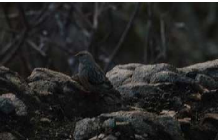
Accenteur alpin Prunella collaris , février 2016, Sérandon (19) C. Roy

Le retour de cet oiseau montagnard est bien modeste mais il intervient après 2 années blanches. L'année 2012 et à degré moindre 2013 cumulent un nombre important de citations. Le relief accidenté des gorges de la Dordogne est parfaitement adapté à son hivernage.