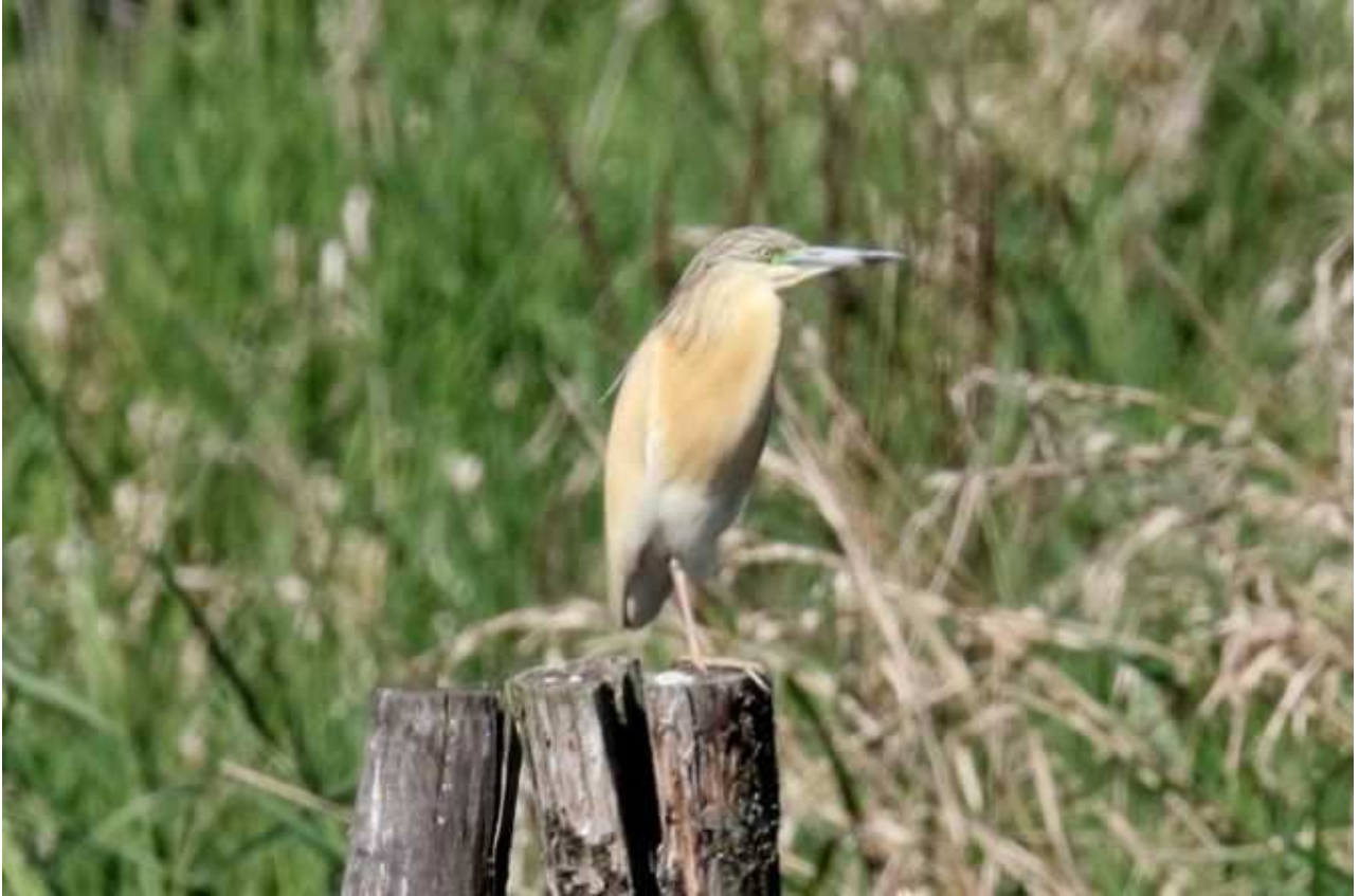
Crabier chevelu Ardeola ralloides , mâle, mai 2016, Lussat (23)

En France, les foyers de reproduction sont bien localisés, essentiellement méridionaux et atlantiques. Les plus proches se situent en Brenne, en Charente et dans l'Allier.