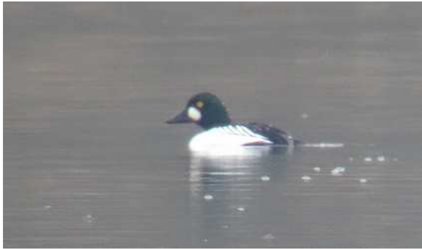
Garrot à œil d'or Bucephala clangula , mâle, février 2016, Lussat (23) P. Duboc.

Il n'est pratiquement plus observé sur les grands plans d'eau haut-viennois où autrefois il apparaissait fréquemment à la mauvaise saison.