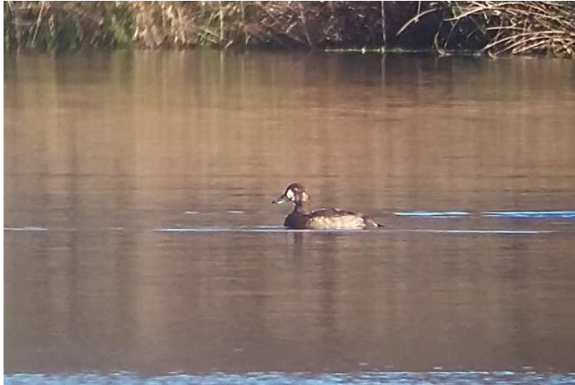
Fuligule milouinan Aythya marila , 1A, novembre 2016, Peyrelevade (19) Ch. Mercier.