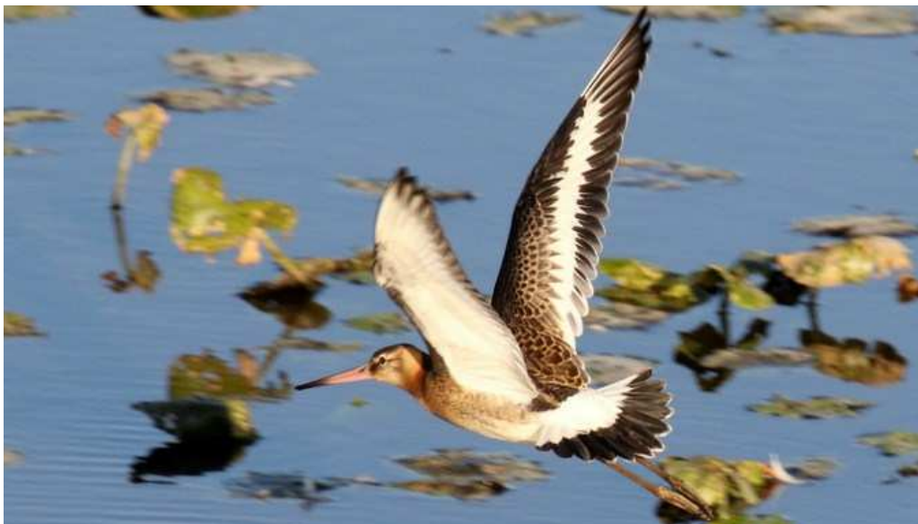
Barge à queue noire Limosa limosa , septembre 2016, Lussat (23) J.P. Toumazet.

Pour la première année la Barge à queue noire est homologuée en Haute-Vienne. L'Étang des Landes est de loin le site le plus attractif. Une grande majorité des données concerne le passage postnuptial.