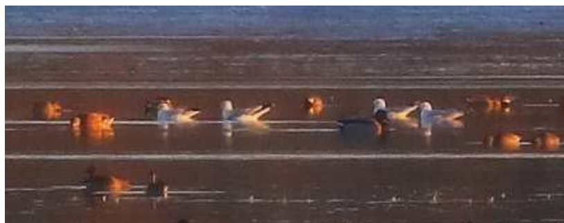
Goéland cendré Larus canus , décembre 2016, Lussat (23) B. Brunet.