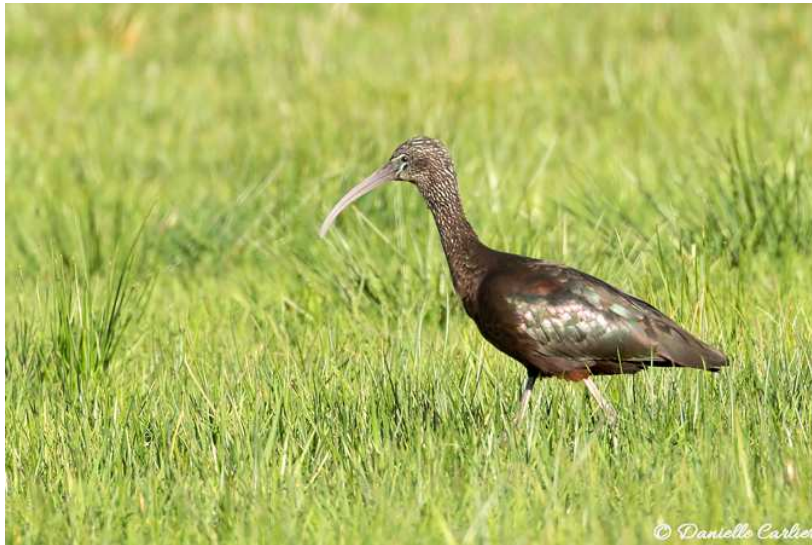
Ibis falcinelle Plegadis falcinellus , avril 2016, Lussat (23) D. Carlier.