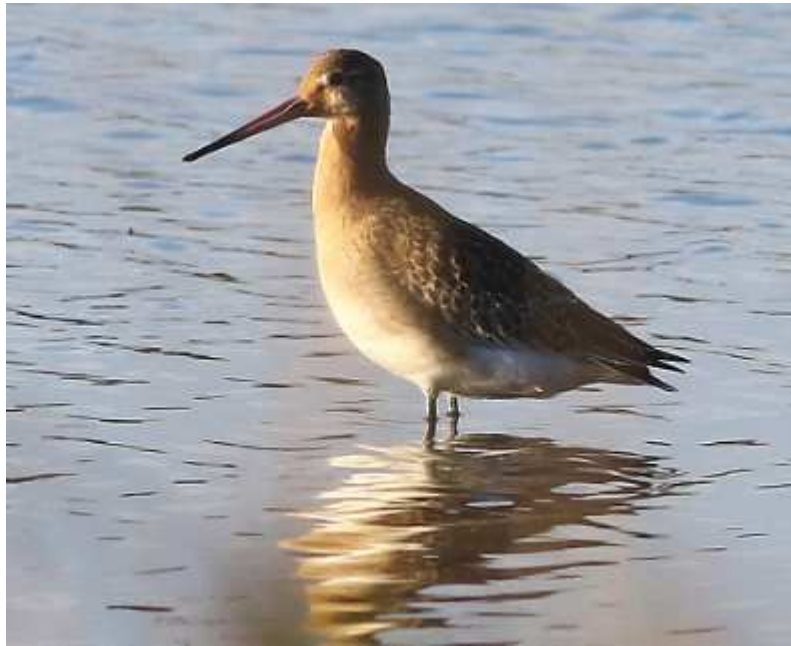
Barge à queue noire Limosa limosa , octobre 2016, Lussat (23) B. Brunet.