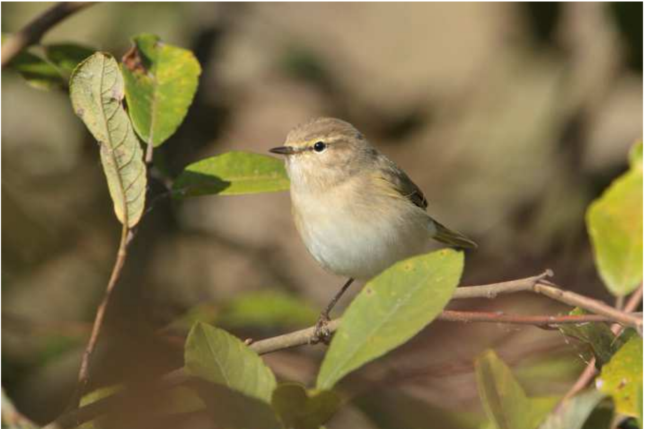
Pouillot de Sibérie Phylloscopus collybita tristis , octobre 2016, Limoges (87) Ch. Mercier.