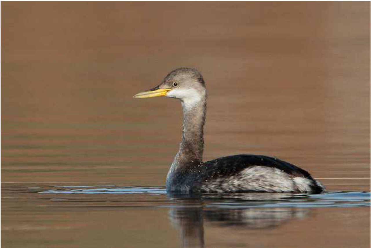
Grèbe jougris Podiceps grisegena , ind. 1A., décembre 2016, Beaumont-du-lac (87) Ch. Mercier.