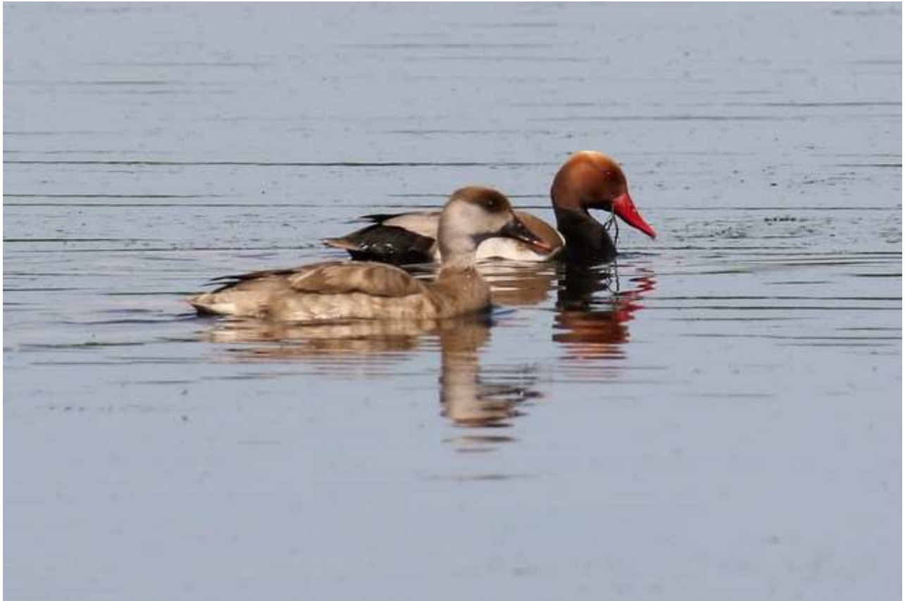
Nette rousse Netta rufina , cple, mai 2016, Lussat (23) J.P. Toumazet.