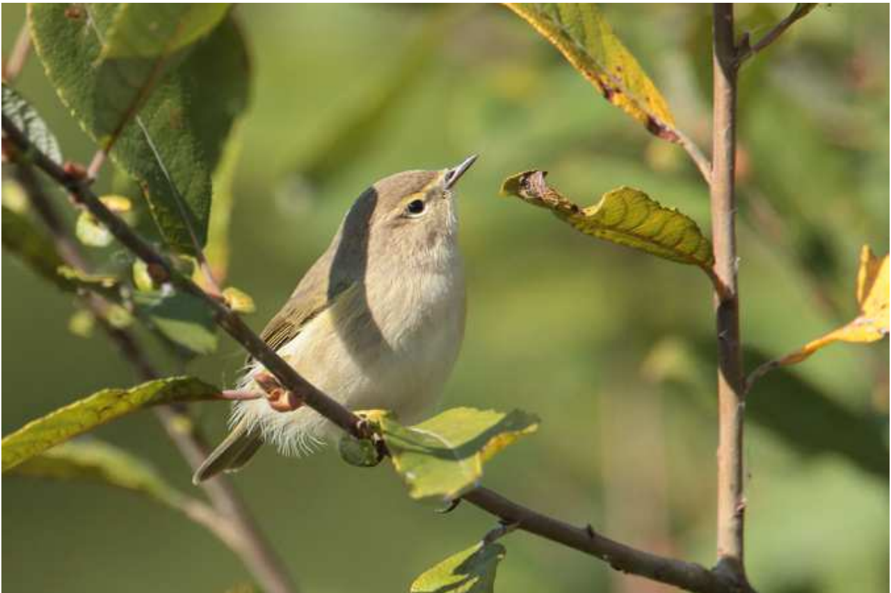
Pouillot de Sibérie Phylloscopus collybita tristis , octobre 2016, Limoges (87) Ch. Mercier.

Après 2015, avec la première apparition d'un Pouillot de type sibérien, les ornithologues régionaux espéraient contacter le Pouillot de Sibérie. Les critères de reconnaissance de ces taxons aujourd'hui mieux définis et les progrès de l'ornithologie de terrain laissent envisager de nouvelles observations dans les prochaines années. Ce taxon est rarement observé à l'intérieur des terres où généralement la pression d'observation est moindre que sur les côtes océaniques notamment bretonnes.