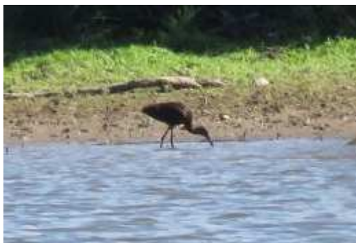
Ibis falcinelle Plegadis falcinellus , août 2016, Saint-Léger-Magnazeix (87) F. & Ch Collin.

Ces dernières années la situation de l'espèce a beaucoup évolué en France. Il est nicheur sur le littoral méditerranéen notamment en Camargue. Il apparaît de plus en plus souvent au nord de notre région. Dans ces conditions il était inévitable qu'un jour cet ibis soit observé dans notre région.