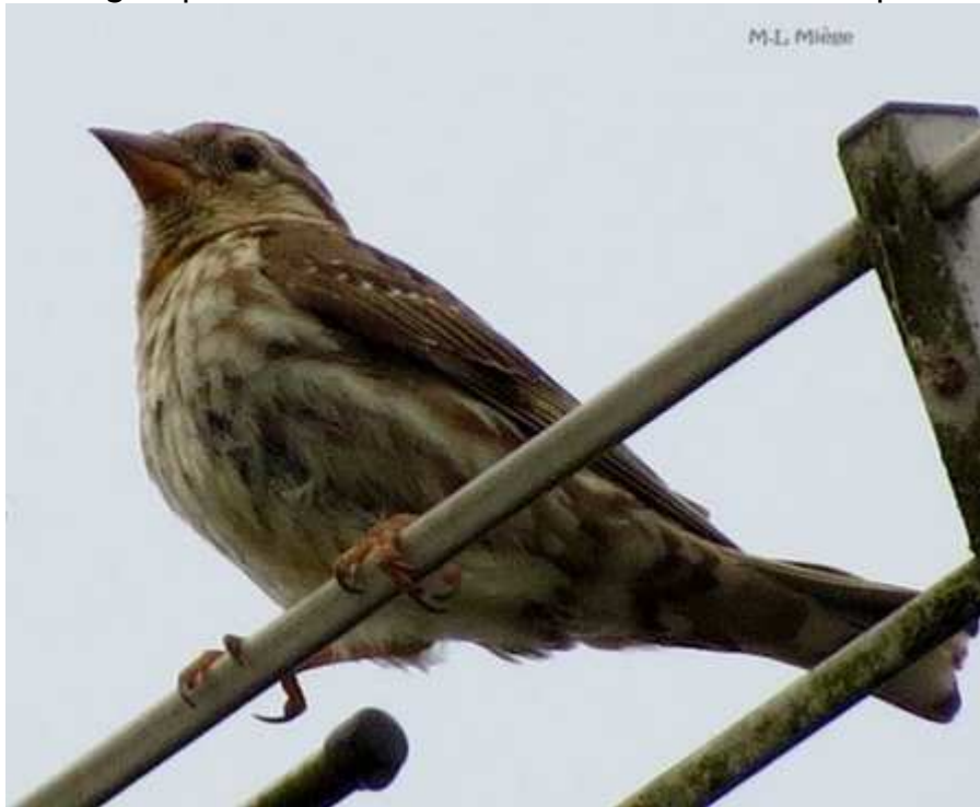
Moineau soulcie Petronia petronia , juillet 2016, Neuville (19) M-L. Miège.

Le secteur d'Albussac/Neuville enregistre la majorité des données. Il permet d'espérer que quelques populations se soient maintenues en Limousin. Des prospections ciblées dans le sud de la région permettraient d'affiner le statut de cette espèce très localisée.