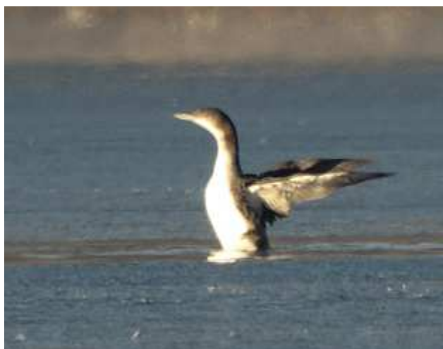
Plongeon imbrin Gavia immer janvier 2009, Saint-Pardoux (87) Ch. Mercier.

- Saint-Pardoux/Le lac (bassin ouest), imm. le 29/12/2009, photo (Ch. Mercier).