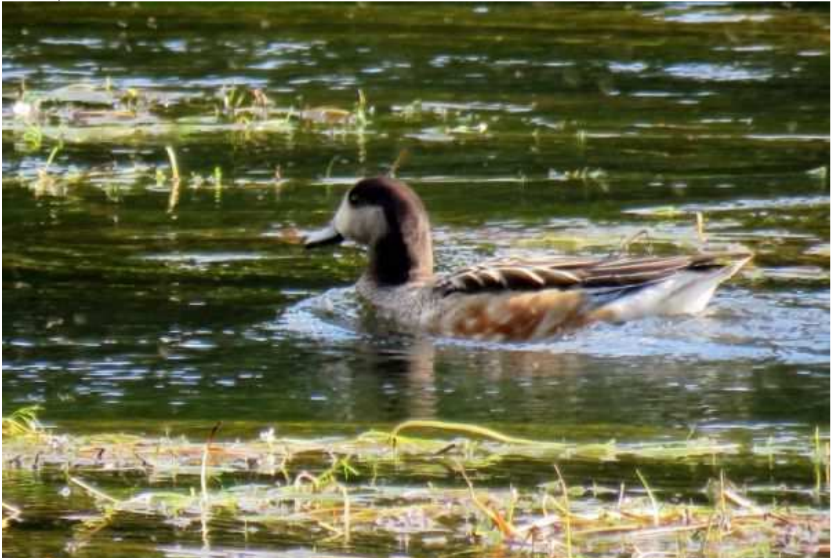
Canard de Chiloé Anas sibilatrix , septembre 2016, Argentat (19) Ch. M.L. Miège.

Corrèze - Argentat/Le Sablier, du 21/09/2016 au 04/10/2016, photo (M-L. Miège, D. Testaert).