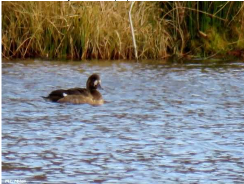
Fuligule milouinan Aythya marila , 1A, décembre 2016, Peyrelevade (19) M.L. Miège.

FULIGULE HYBRIDE MILOUIN X NYROCA Aythya ferina x nycora (0/0 - 1/1). Haute-Vienne - Saint-Martin-le-Mault/Étang de la Mazère et Saint-Léger- Magnazeix/Étang de Murat, du 04/02/2016 au 03/03/2016, photo (Ch. Mercier). Cette observation constitue la première donnée documentée de cet hybride en Limousin. Le stationnement un mois durant est notable pour un taxon qui peut passer inaperçu.