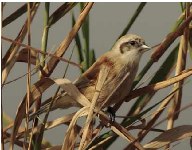
Rémiz penduline Remiz pendulinus ind 1A, octobre 2010, Lussat (23) Ch. Mercier.

Creuse - Lussat/Étang des Landes, ind. 1A le 08/10/2010, photo (Ch. Mercier).