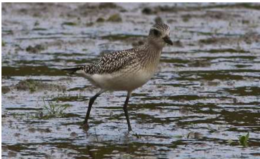
Pluvier argenté Pluvialis squatarola , octobre 2016, Lussat (23) B. Brunet.