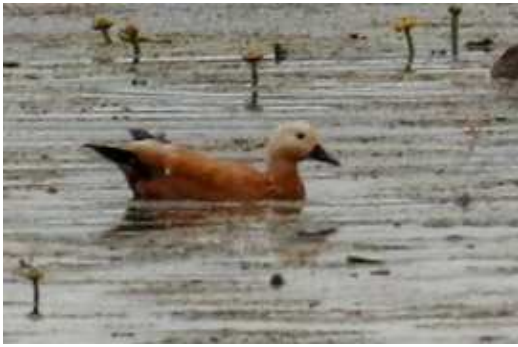
Tadorne de Casarca Tadorna ferrugina , juillet 2016, Lussat (23) J. P. Toumazet.