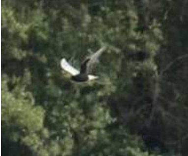
Guifette leucoptère Chlidonias leucopterus , mai 2016, Lussat (23) J.P. Toumazet.

A l'instar des 3 homologations déjà enregistrées, elles sont survenues à l'Étang des Landes. Toutes les apparitions régionales ont eu lieu en mai, généralement lors de la première décade. Dans nos régions les citations concernent généralement des oiseaux isolés. Ce nicheur du sud-est de l'Europe demeure extrêmement rare chez nous.