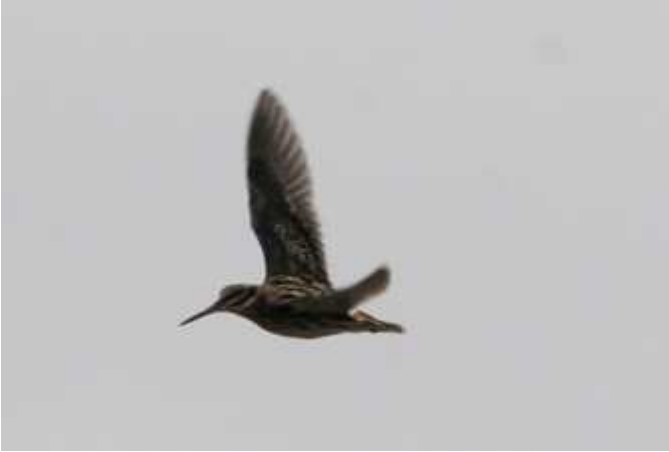
Bécassine sourde Lymnocyptes minimus , février 2016, Saint-Viance (19)

Bien que signalée dans les 3 départements, il est fort probable qu'en raison de sa discrétion la présence de cette espèce soit sous-estimée.