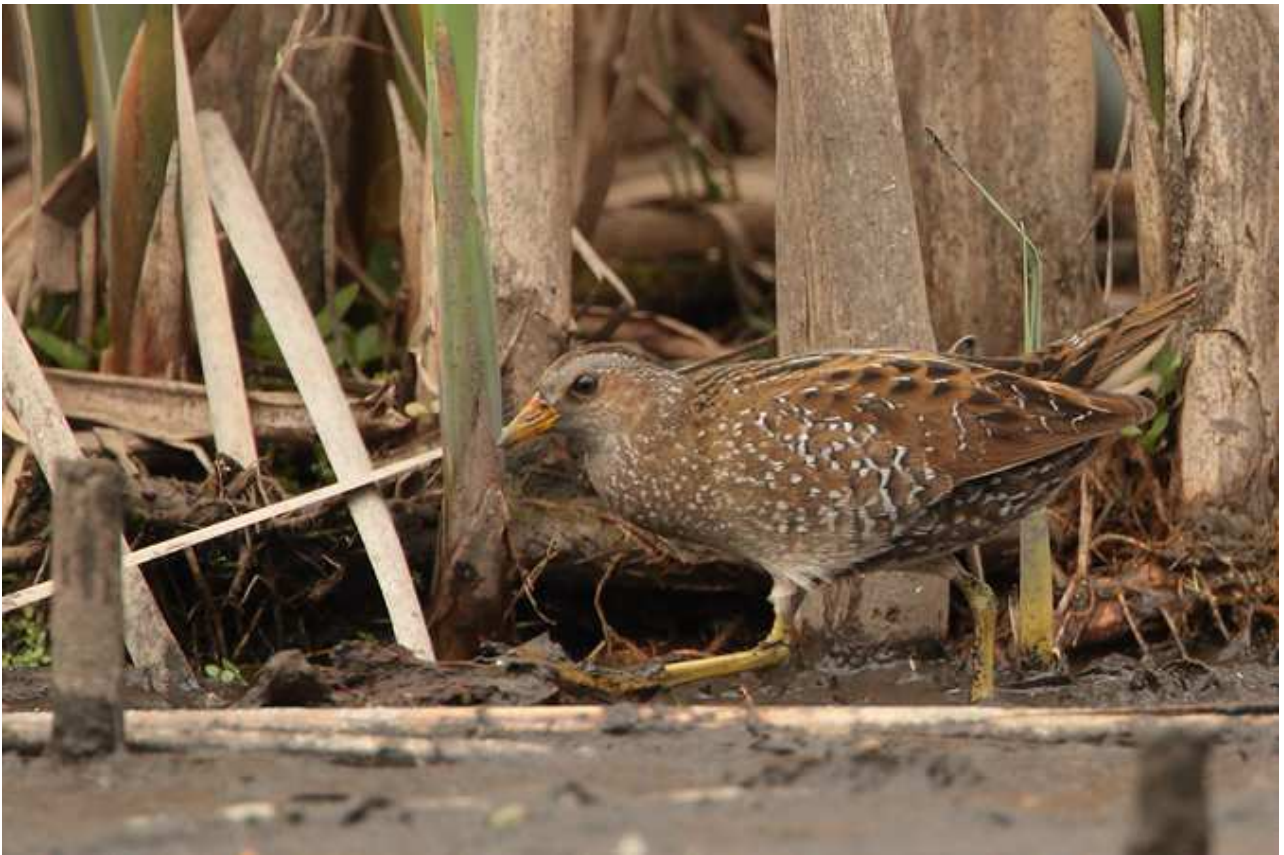
Marouette ponctuée Porzana porzana , avril 2016, Limoges (87) Ch. Mercier.