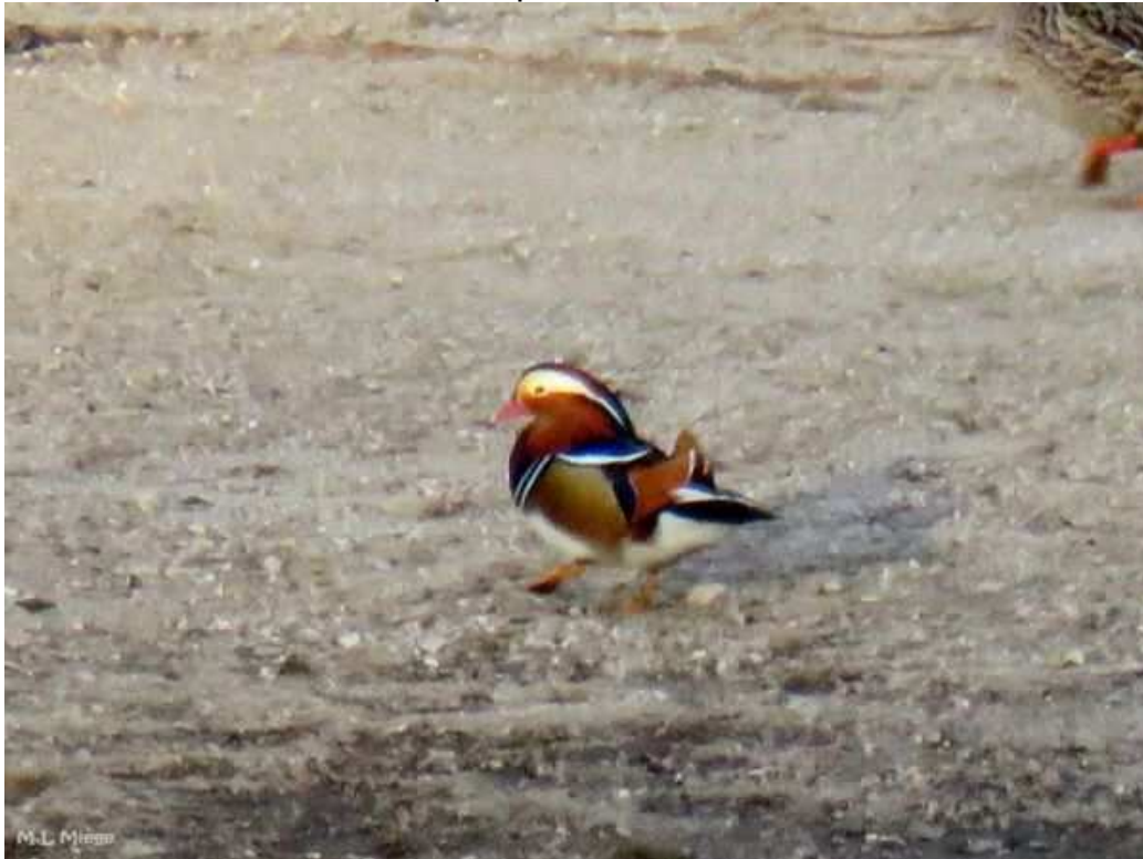
Canard mandarin Aix galeruculata , décembre 2016, Servières-le-Château (19) M.L. Miège.

Bien que l'espèce ait déjà niché dans la région et que des oiseaux s'échappent régulièrement de captivité, l'hypothèse d'hivernants de populations nordiques également issues d'introduction ne peut pas totalement être exclue.