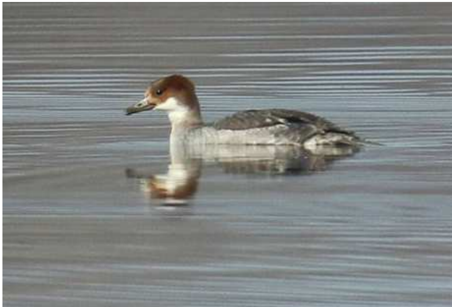
Harle piette Mergellus albellus , mars, Lussat (23) J.P. Toumazet.