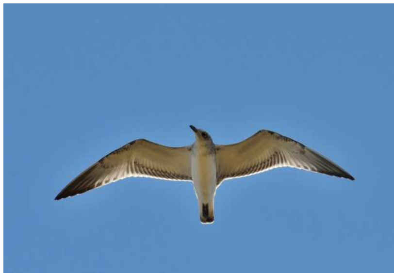
Mouette mélanocéphale Larus melanocephalus , 1A, août 2016, Albussac (19) D. Testaert.