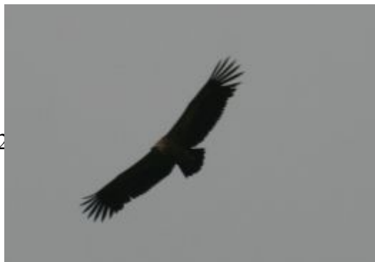
Vautour fauve Gyps fulvus , mai 2016, Bétête (23) D. Morsynski

Après l'année 2014 bien modeste et l'année blanche de 2015, l'espèce est observée dans les 3 départements. Ce qui est plutôt rassurant pour ce vautour qui, sans être abondant, était observé régulièrement en Limousin les années précédentes.