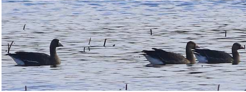
Oies rieuses Anser albifrons , ad. et juv., novembre 2016, Lussat (23) B. Brunet.