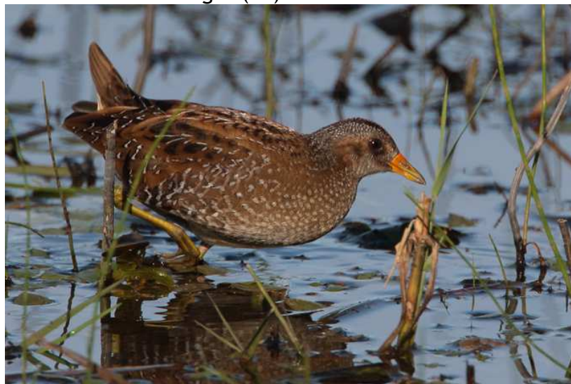
Marouette ponctuée Porzana porzana , octobre 2016, Lussat (87) F. Desage.