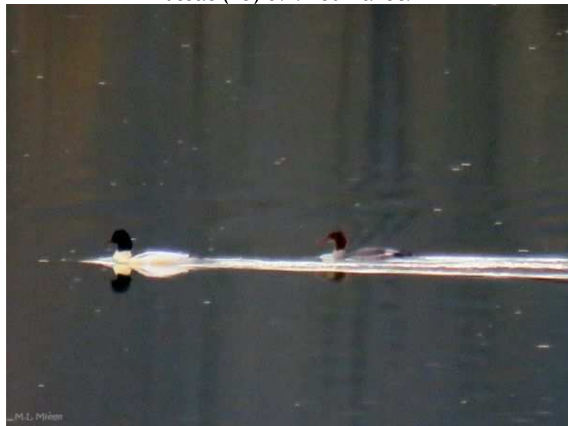
Harle bièvre Mergus merganser , cple novembre 2016, Argentat (19) M.L. Miège.