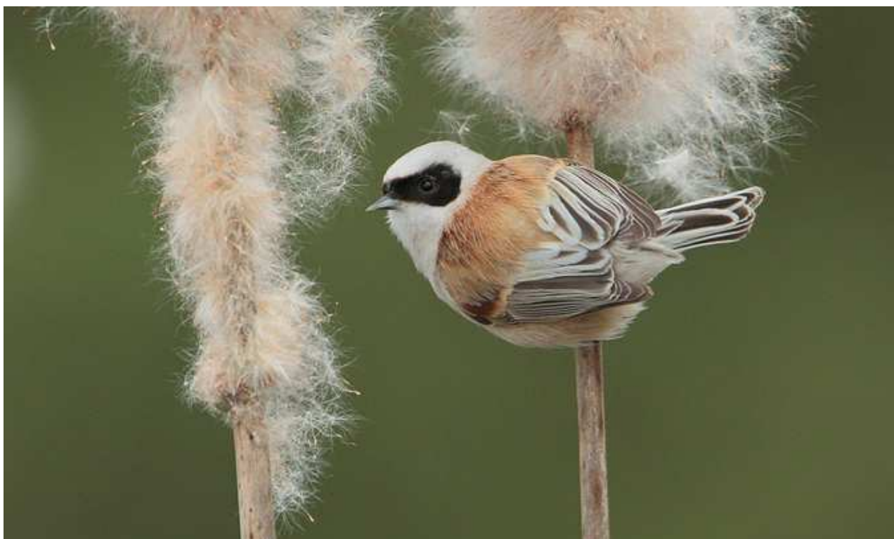
Rémiz penduline Rémiz pendulinus , avril 2016, Limoges (87) Ch. Mercier.

Avec 49 individus l'année 2015 avait été remarquable, l'année 2016 est exceptionnelle avec près d'une centaine d'individus recensés dans la région. Le petit marais de la station d'épuration de Limoges et l'Étang des Landes fournissent la majorité des données. Les programmes de baguage de l'Étang des Landes fournissent la moitié des données. On retiendra aussi le contrôle de cette rémiz baguée en Espagne. Comme en 2015, la Corrèze enregistre une seule citation.