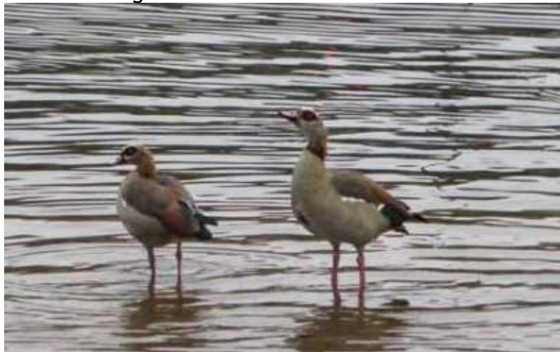
Ouette d'Égypte Alopochen œgyptiaca , septembre 2016, Aixe-sur-Vienne (87)

Chaque année, le plus souvent en Haute-Vienne quelques individus probablement échappés de captivité sont signalés.