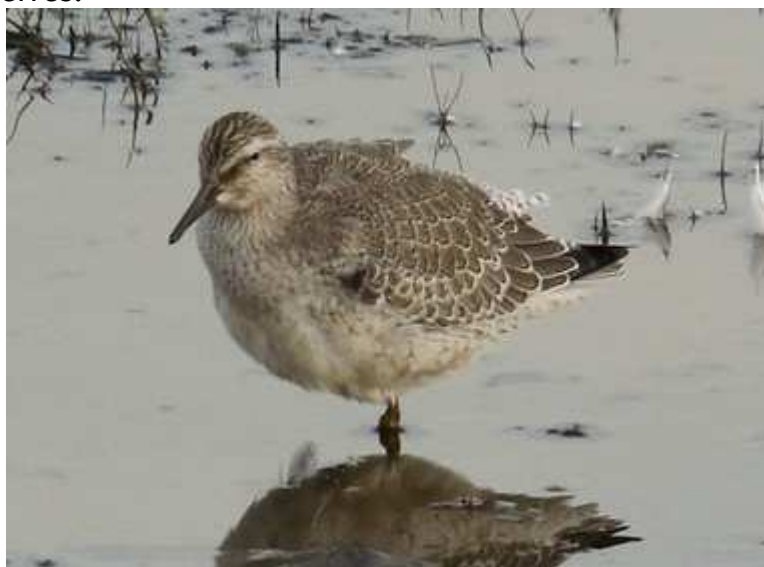
Bécasseau maubèche Calidris canutus , juvénile, septembre 2016, Lussat (23) J.P. Toumazet.

Homologué pour la première fois l'année dernière, déjà à l'Étang des Landes, la présence de ces 2 individus en halte migratoire est intéressante car généralement les observations concernent des individus isolés. Cette espèce maritime est peu fréquente à l'intérieur des terres.