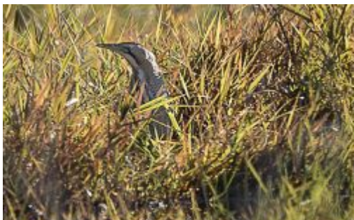
Butor étoilé Botaurus stellaris , décembre 2016, Lagraulière (19)

En raison de la disparition des roselières très peu de sites sont aujourd'hui favorables à sa nidification. Depuis le début des années 1970 la reproduction n'a plus été avérée en Limousin. Les derniers indices de nidification ont été relevés à l'Étang des Landes en 1995.