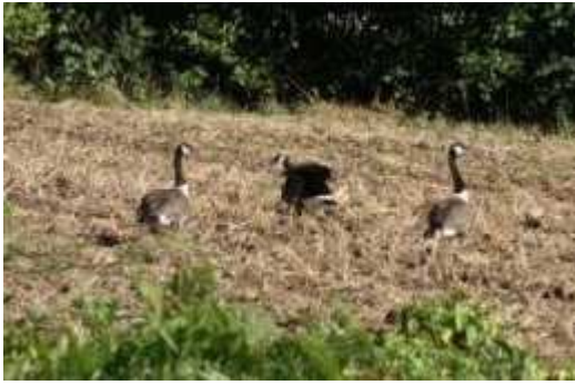
Bernache du Canada Branta canadensis , septembre 2016, Saint-Léonard-de-Noblat (87) C. Lambert.