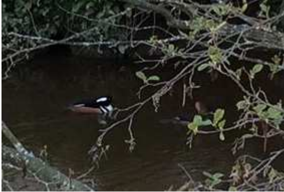
Harle couronné Lophodytes cucullatus , avril 2016, Saint-Agnan de Versillat (23) A. Bruere

Creuse - Saint-Agnan de Versillat/La Peyre, cple le 18/04/2016 (A. Bruere).