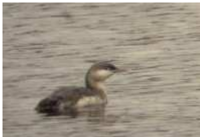
Plongeon catmarin Gavia stellata , ind. 1A novembre 2016, Bort-les-Orgues (19) L. Ton.

Après deux années blanches, le Plongeon catmarin effectue un retour remarquable avec l'arrivée, en fin d'année, de ces 4 individus. Bien que n'étant pas historiquement le plus commun des plongeurs en Limousin, il a été le seul à effectuer un passage dans la région en 2016. Il est intéressant de noter que les 3 départements sont concernés. Classiquement tous les individus signalés sont des oiseaux de premier hiver.