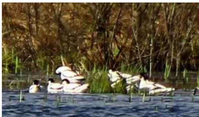
Avocette élégante Recurvirostra avosetta , mars 2016, Lussat (23) F. Beignon.