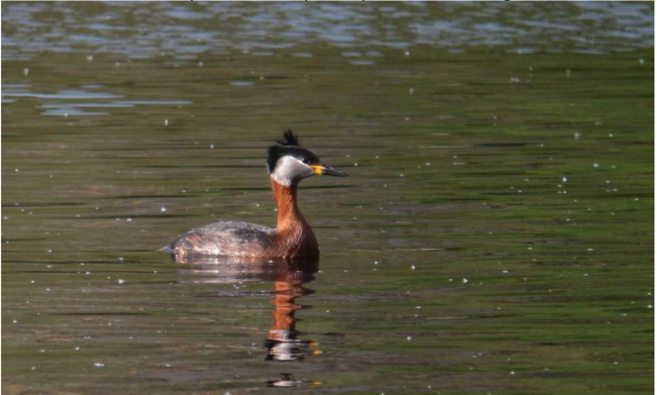
Grèbe jougris Podiceps grisegena , plum. nupt., mai 2016, Peyrelevade (19) R. Petit.

Absent en Limousin depuis 2010, le Grèbe jougris est homologué seulement pour la seconde fois. Le stationnement durant 5 jours de cet individu à Peyrelevade au mois de mai est étonnant. L'observation sur le lac de Vassivière est plus classique car généralement les observations sont hivernales et elles concernent de jeunes oiseaux. Ces dernières années, l'espèce se fait de plus en plus rare dans la région.