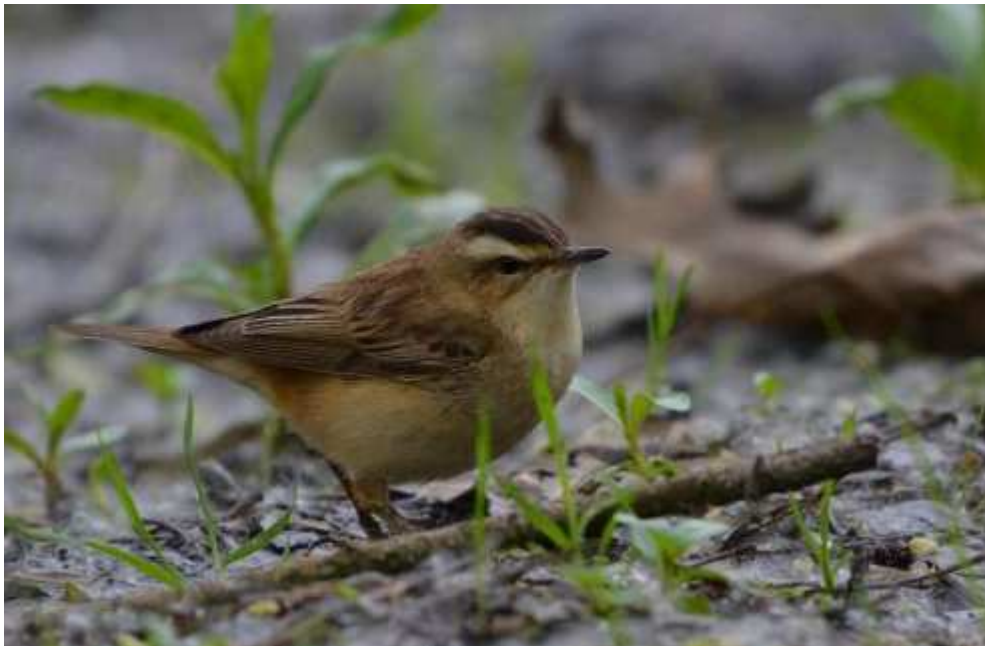
Phragmite des joncs Acrocephalus schoenobaenus , avril 2016, Limoges (87) E. Le Roy.

Avec de nombreuses données en période favorable, l'espèce est probablement nicheuse à l'Étang des Landes. Toutefois, le Limousin se trouve dans la partie méridionale de sa zone de nidification.