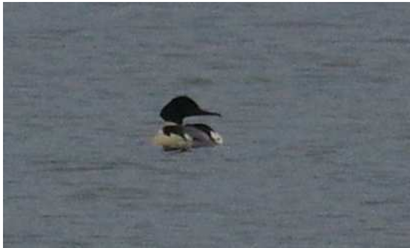
Harle bièvre Mergus merganser , mâle ad. janvier 2016, Lussat (23) J.P. Toumazet.