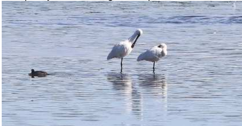
Spatule Blanche Platalea leucorodia , octobre 2016, Lussat (23) B. Brunet.

Sensiblement à la même période qu'en 2015, l'espèce est observée à l'Étang des Landes. Le stationnement de ces 2 spatules durant 2 semaines est remarquable. Bien qu'étant rare en Limousin l'espèce y a été homologuée chaque année.