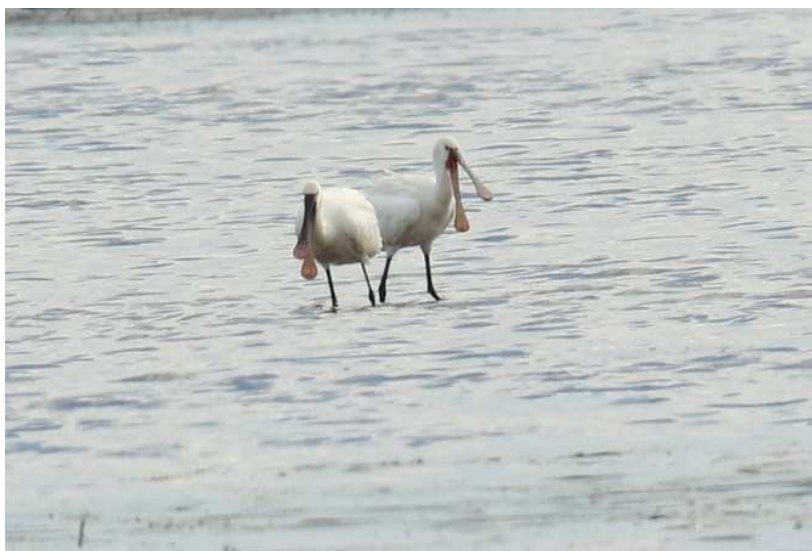
Spatule Blanche Platalea leucorodia , octobre 2016, Lussat (23) J.P. Toumazet.