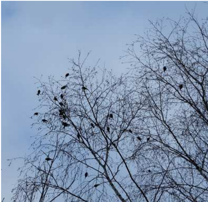
Sizerin flammé Carduelis flammae , janvier 2016 Sauviat-sur-Vige (87) G. Labidoire