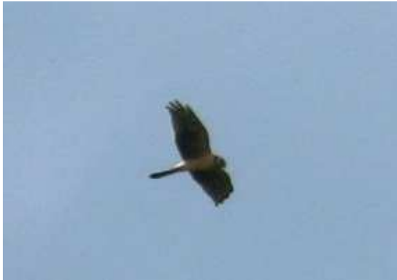
Busard pâle Circus macrourus , imm., avril 2016, Bujaleuf (87) C. Lambert.

https://www.luomus.fi/en/female-pallid-harrier-potku#Potku_NOW