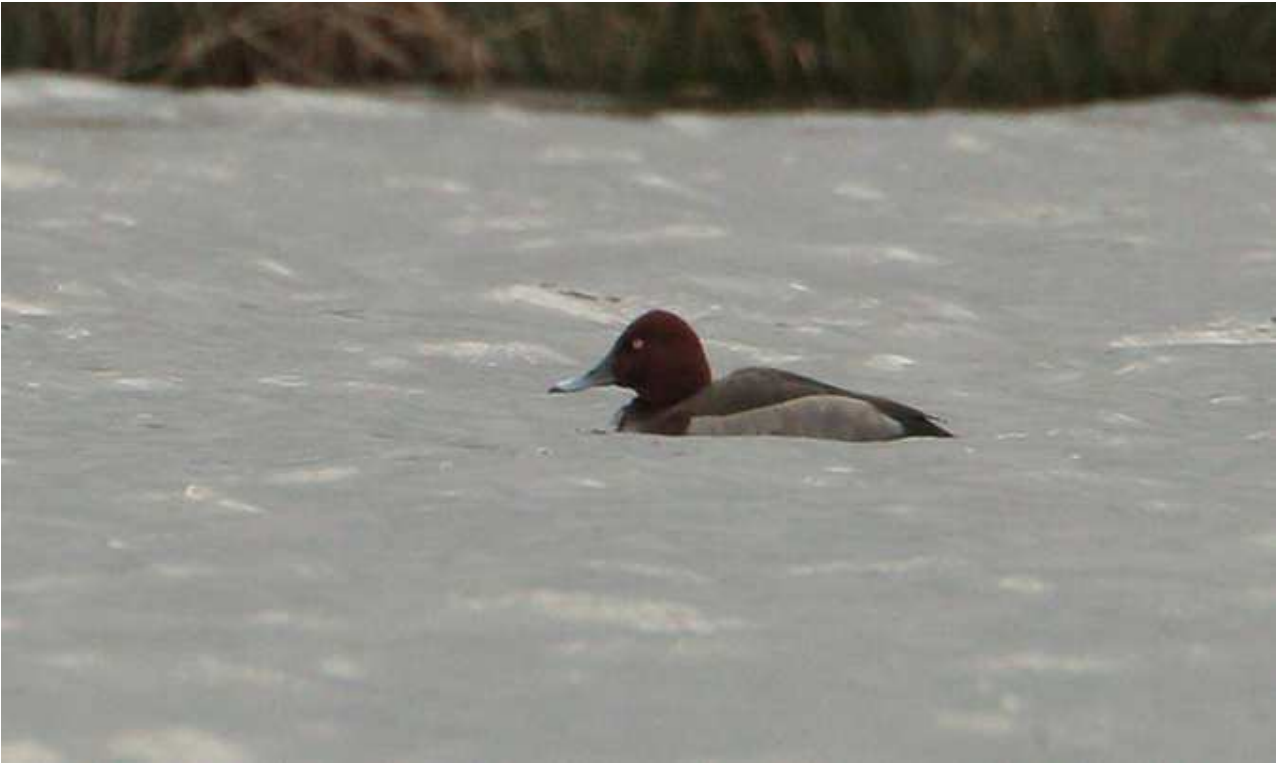
Fuligule hybride Milouin x Nyroca Aythya ferina x nyroca , mars 2016, Saint-Martin-le-Mault (87) Ch. Mercier.