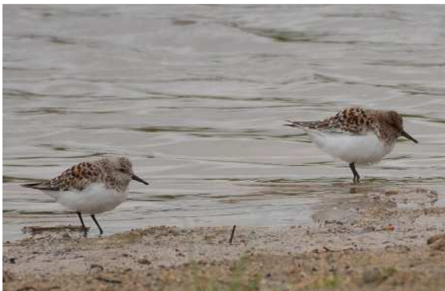
Bécasseau sanderling Calidris alba , mai 2016, Neuvic (19) N. Gauthier.

des terres. Bien que déjà été homologuée à Neuvic en 2011, les 3 données corréziennes, survenues à la mi-mai, sont inattendues. En Limousin le Bécasseau sanderling peut-être rencontré aux 2 migrations, comme le confirme le stationnement d'un individu en septembre à l'Étang des Landes.