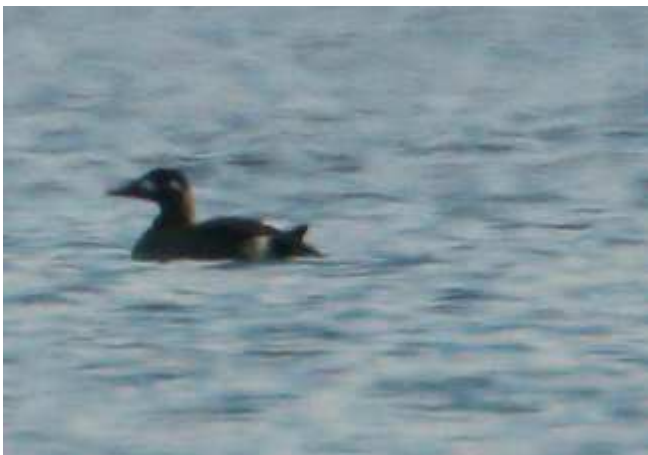
Macreuse brune Melanitta fusca , décembre 2016, Saint-Pardoux (87) Ch. Mercier.

Bel effectif pour la troisième homologation régionale car en général l'espèce est observée à l'unité. Les haltes surviennent de mi-novembre à mi-mars, elles sont toujours très brèves. Les macreuses en hivernage en France fréquentent essentiellement les côtes.