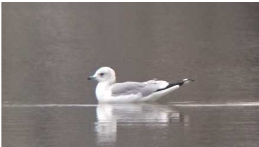
Goéland cendré Larus canus , 2 A, décembre 2016, Lussat (23) L. Ton.

Ce goéland nordique se rencontre essentiellement en Limousin de novembre à février. Conformément à la phénologie habituelle de l'espèce toutes ces observations sont survenues en décembre. Une nouvelle fois, l'Étang des Landes regroupe la totalité des données. L'arrivée d'un groupe de 4 individus est à signaler car généralement les contacts concernent des oiseaux isolés.