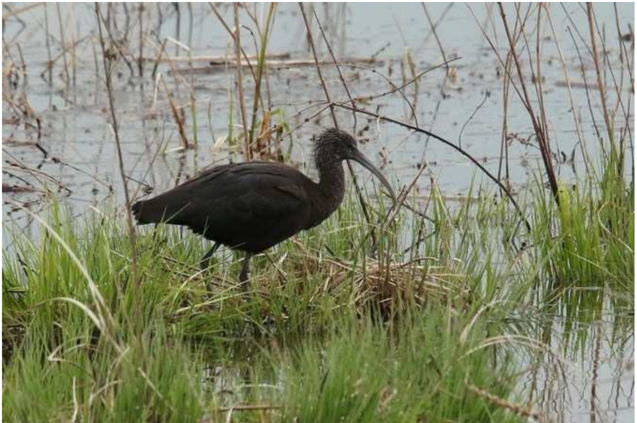
Ibis falcinelle Plegadis falcinellus , avril 2016, Lussat (23) J.P. Toumazet.