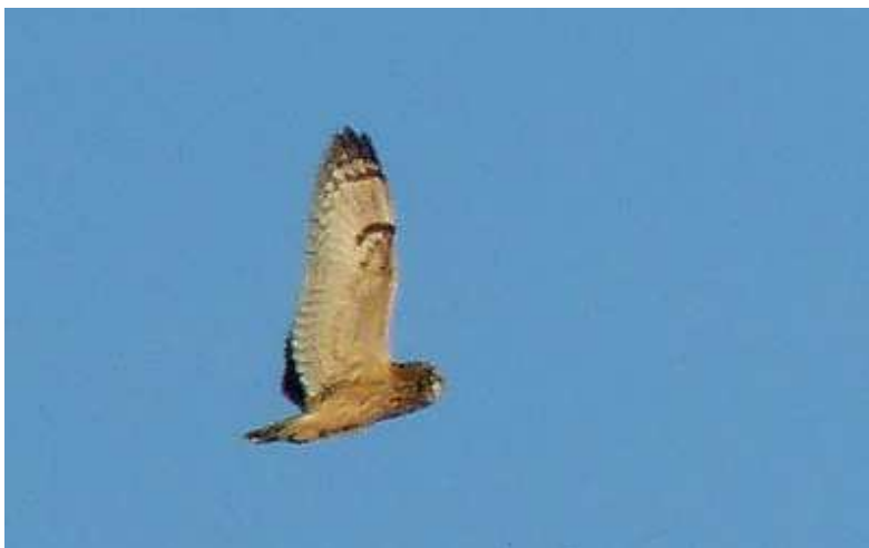
Hibou des marais Asio flammeus , octobre 2014, Lussat (23) N. Lagarde.