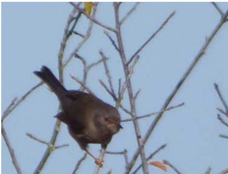
Fauvette pitchou Sylvia undata mâle ad., novembre 2014, Château-Chervix (87) G. Morelon.

Ces deux mentions, à l'instar de celles de 2009 et de 2011, surviennent sur deux sites régionaux où cette fauvette est signalée régulièrement. Si les hivers ne sont pas trop froids, la Pitchou arrive à se maintenir.