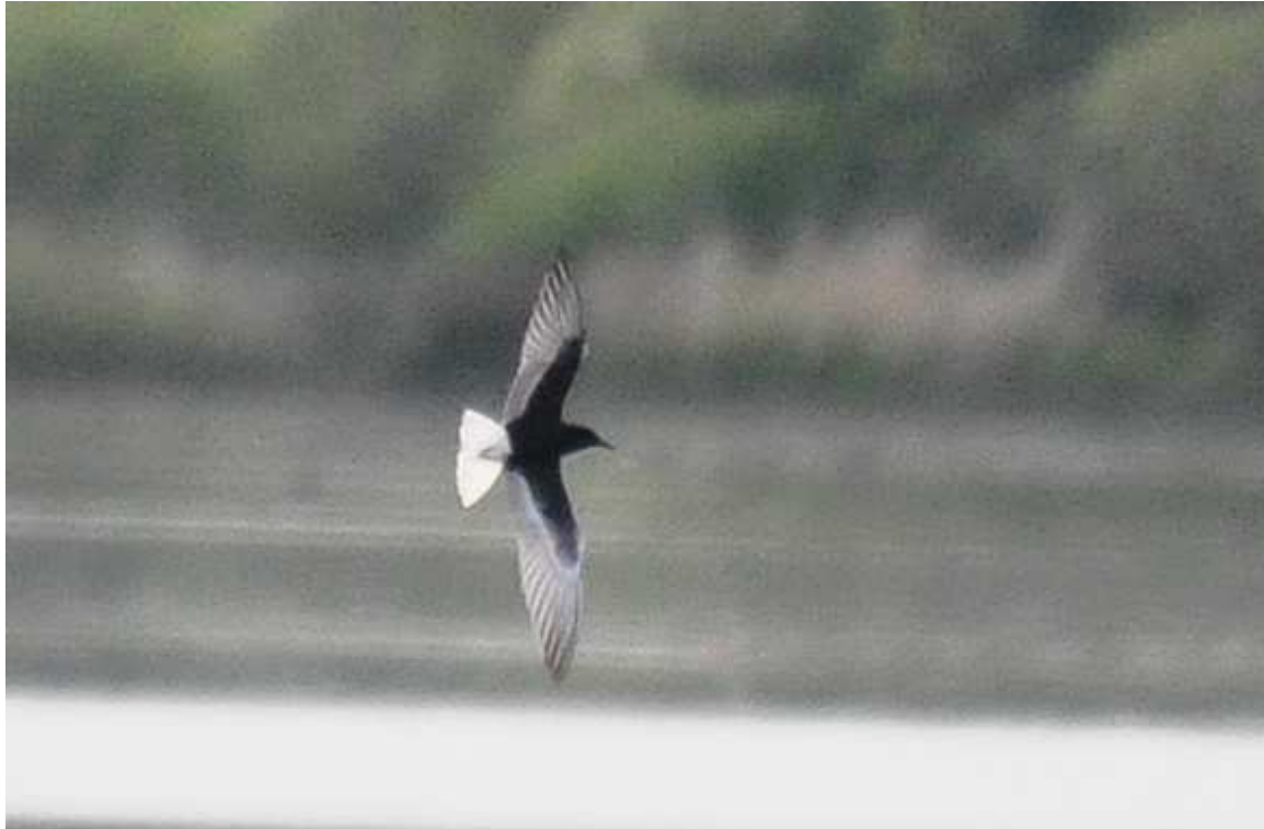
Guifette leucoptère chlidonias leucopterus , mai 2014, Lussat (23) D. Naudon.

Cette sixième mention régionale, comme la précédente, est survenue à l'étang des Landes et sensiblement à la même période.