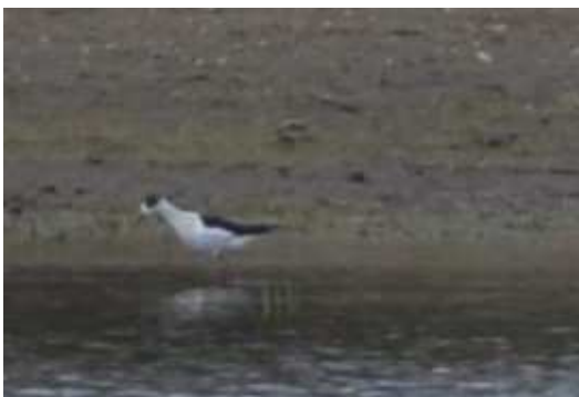
Echasse blanche Himantopus himantopus mâle ad., avril 2014, Neuvic (19) A. Lamarche.

Malgré 3 citations supplémentaires, le nombre d'individus contactés est inférieur à celui de 2013 où 13 oiseaux avaient été signalés. Toutefois l'année demeure excellente pour l'espèce.