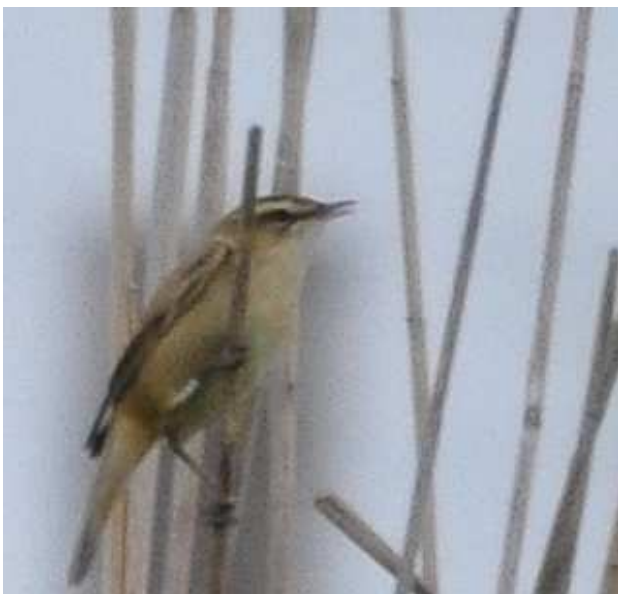
Phragmite des joncs Acrocephalus schoenobaenus mâle bagué, mai 2014, Lussat (23) D. Naudon.

Lors de la migration postnuptiale, 71 individus ont été bagués et un autre contrôlé, les oiseaux repris les jours suivants n'étant pas comptabilisés. En avril et mai, la comptabilité des oiseaux contient une large part d'arbitraire. L'hypothèse de 2 individus en avril et d'au moins 3 chanteurs de mai à juillet a été retenue. L'espèce niche régulièrement sur ce site, les mâles chanteurs étant plus faciles à détecter.