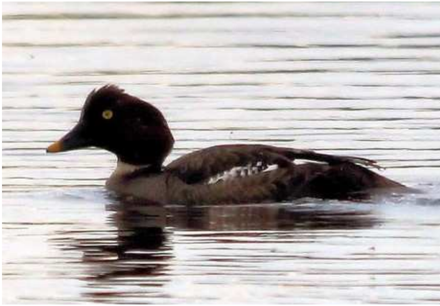
Garrot à œil d'or Bucephala clangula fem., avril 2014, Lussat (23) S. Touze.