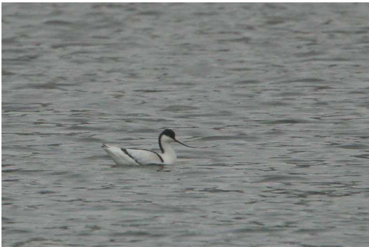
Avocette élégante Recurvirostra avosetta , décembre 2014, Royère de Vassivière (23) Ch. Mercier.

Lors de la migration postnuptiale, la période classique d'apparition de l'espèce en Limousin est novembre/décembre. Ces observations ne dérogent pas à cette règle. Les 12 individus constituent le second groupe en termes d'importance après celui de 17 mentionné le 29/11/2010 à l'étang des Landes.