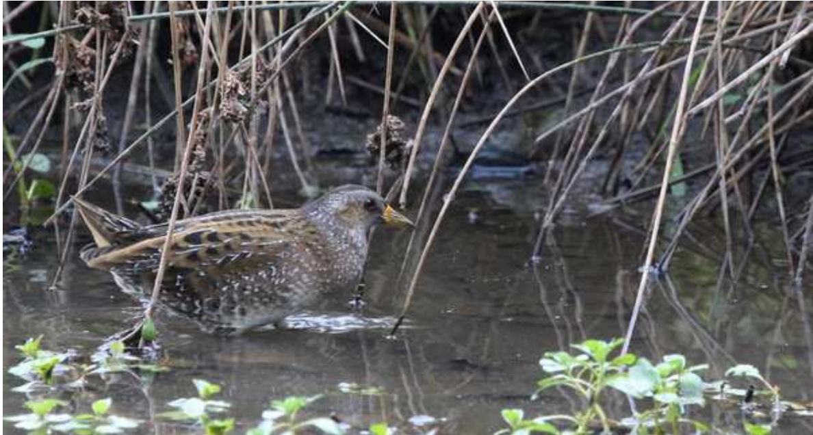
Marouette ponctuée Porzana porzana , septembre 2014, Limoges (87) M. Maurice.