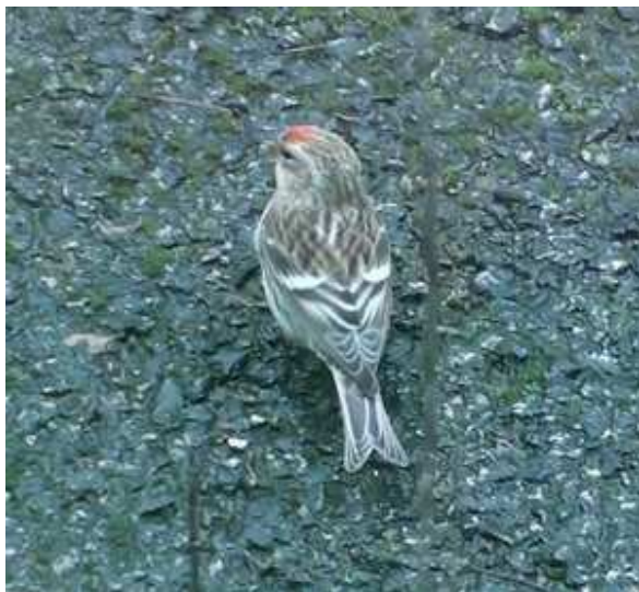
Sizerin flammé Carduelis flammea mâle ad., mars 2014, Limoges (87) E. Lagandogne.