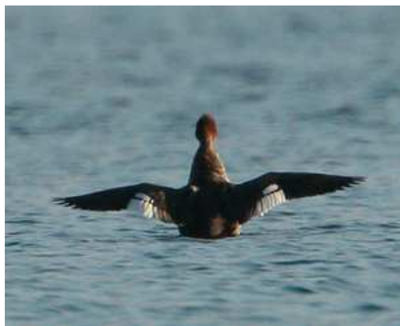
Harle huppé Mergus serrator type fem., novembre 2014, Peyrat-le-Château (87) Ch. Mercier.