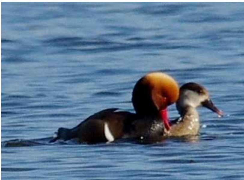
Nettes rousses Netta rufina cple, mars 2014, Lussat (23) J.-P. Toumazet.

L'année 2014 voit le premier hivernage complet de la Nette rousse sur l'étang des Landes, seul site à accueillir régulièrement l'espèce depuis 2011. La présence simultanée de plusieurs couples au début des printemps 2013 et 2014 laisse espérer la nidification de l'espèce en Limousin pour les prochaines années (comme c'est déjà le cas en Auvergne et en Brenne). L'individu déjà présent en 2013 n'est pas comptabilisé dans l'effectif de 2014.