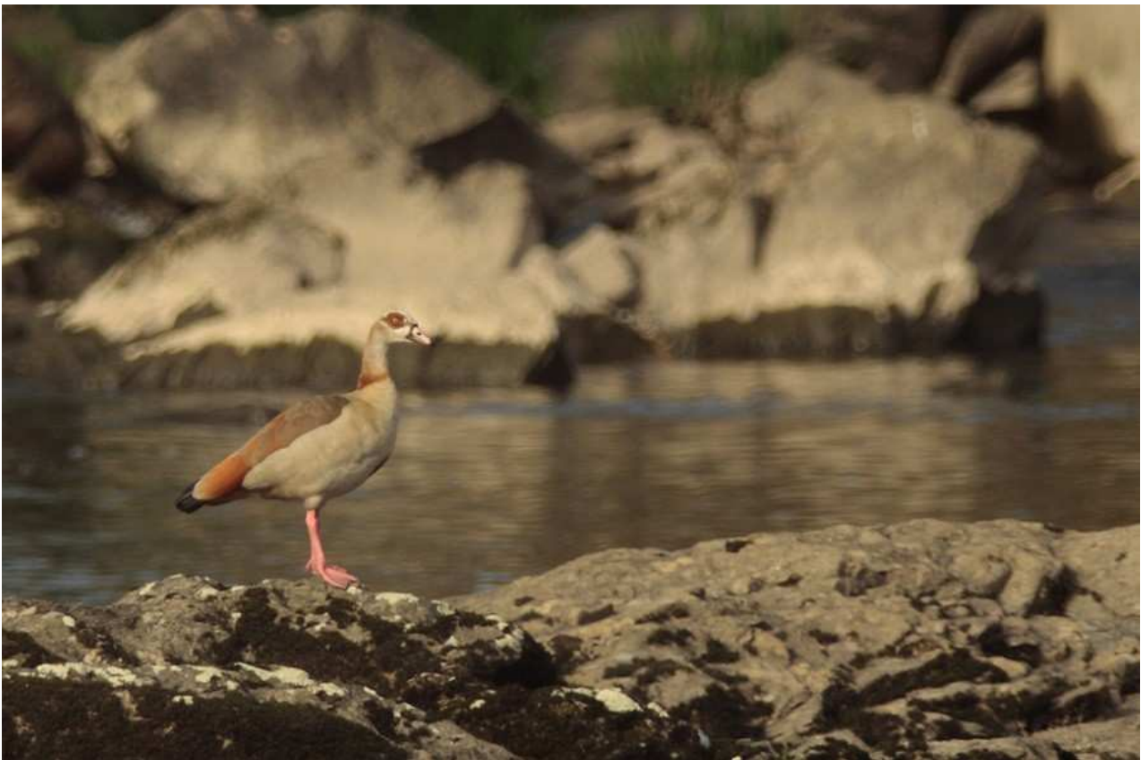
Ouette d'Égypte Alopochen ægyptiaca , mai 2011, Condat-sur-Vienne (87) Ch. Mercier.

Haute-Vienne - Condat-sur-Vienne/sur la Vienne, le 06/04/2011, photo (Ch. Mercier).