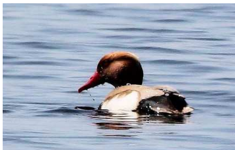
Nette rousse Netta rufina mâle, avril 2014, Lussat (23) S. Touze.