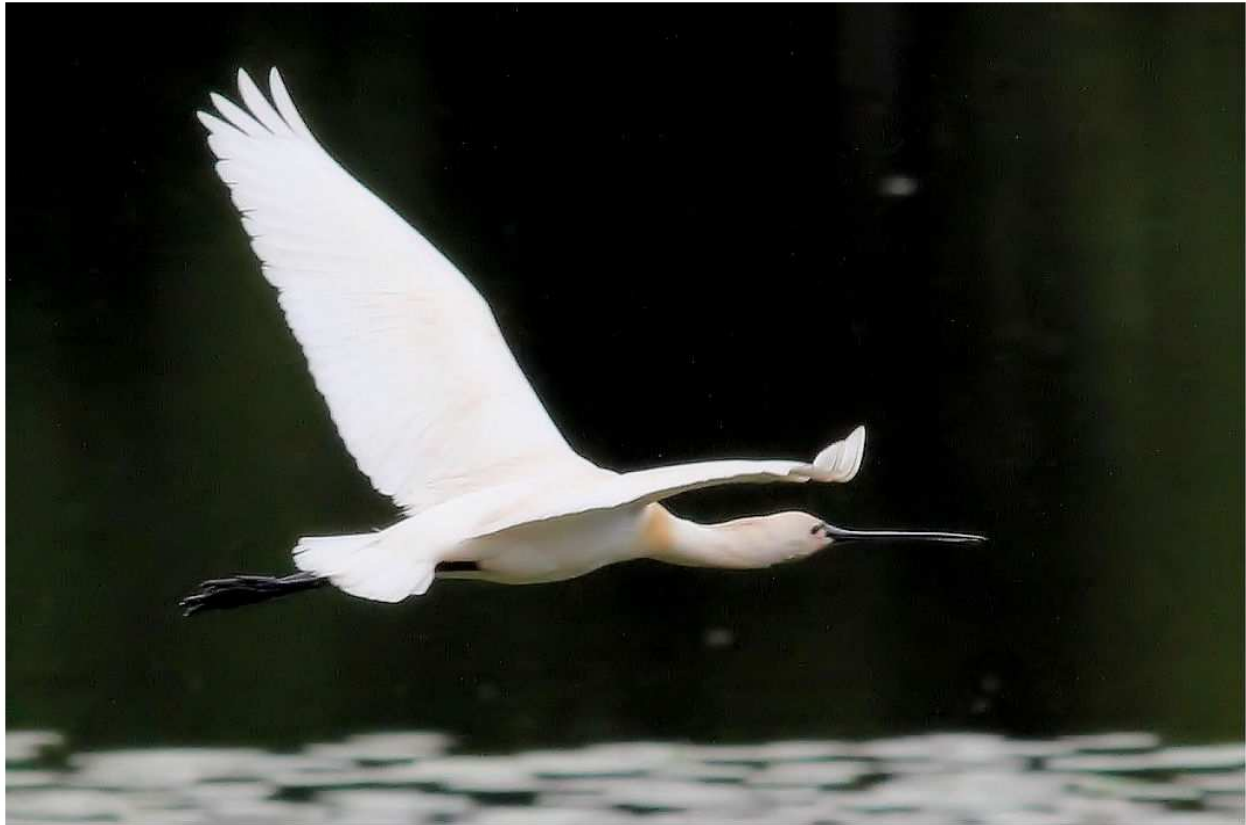
Spatule blanche Platalea leucorodia ad., mai 2014, Lussat (23) S. Touze.