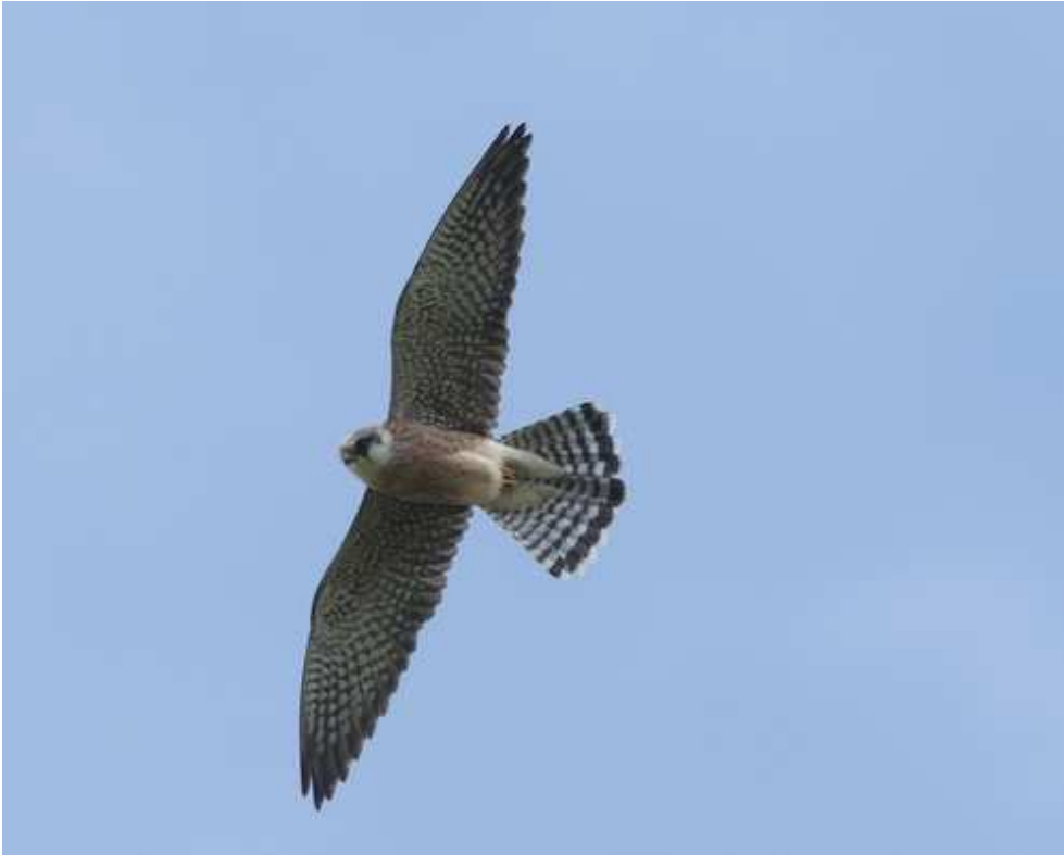
Faucon kobez Falco vespertinus fem. 2A, mai 2014, Tarnac (19) F. Taboury.

Ce migrateur oriental reste un oiseau très rare en Limousin, principalement contacté au passage pré-nuptial. Il ne s'agit que de la seconde observation homologuée depuis 2009. Cet individu a stationné durant un minimum de quatre jours dans un secteur très ouvert du plateau de Millevaches qui a déjà accueilli l'espèce en 1998, 2000 et 2002 !