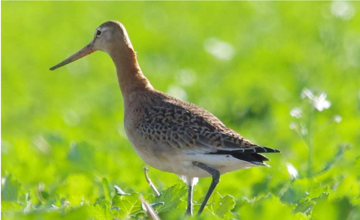
Barge à queue noire Limosa limosa imm., septembre 2014, Lussat (23) J.-P. Toumazet.