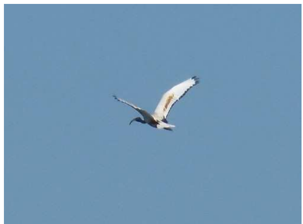
Ibis sacré Threskiornis aethiopicus ad., juillet 2014, Lussat (23), M. Ruchon.