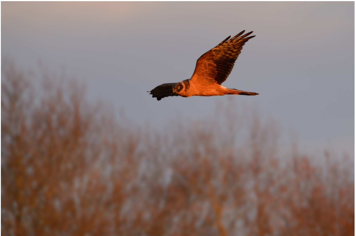
BUSARD PÂLE Circus macrourus 1 ère année, décembre 2014, Gorre (87), F. Taboury.