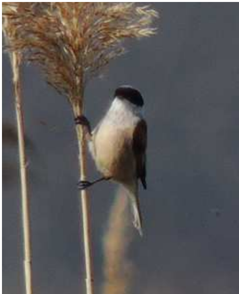
Rémiz penduline Remiz pendulinus , mâle adulte, mars 2014, Lussat (23) L. Toumazet.

Ces 3 dernières années, la totalité des observations se répartit entre l'étang des Landes, essentiellement lors de la migration postnuptiale, et le petit marais en bord de Vienne à Limoges au printemps.