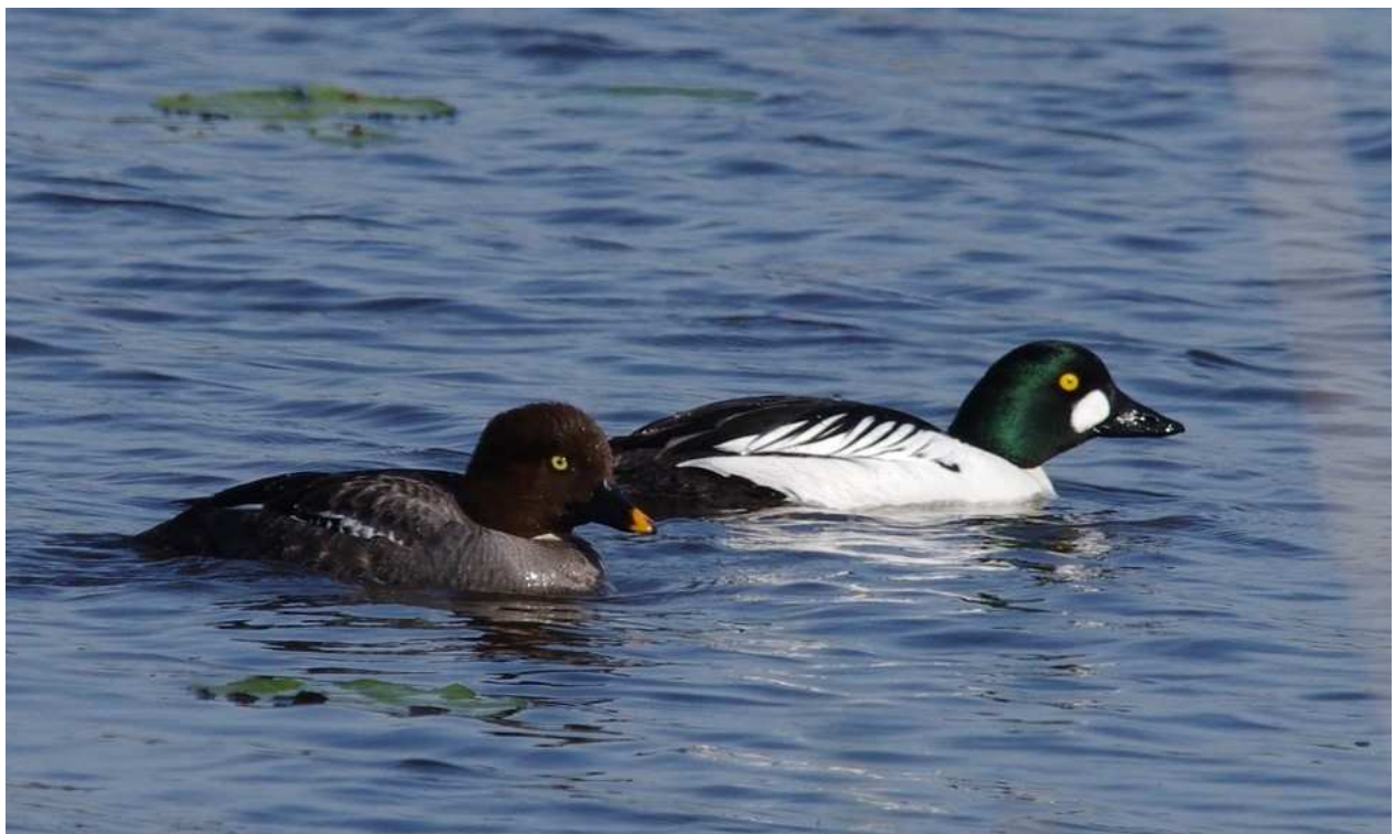
Garrot à œil d'or Bucephala clangula cple., mai 2014, Lussat (23) WNat J.-P. Toumazet.