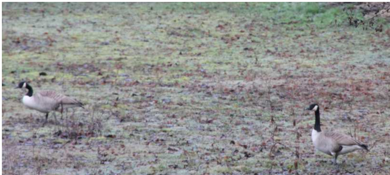
Bernache du Canada Branta canadensis , février 2014, Condat-sur-Ganaveix (19) A. Gendeau.

Les observations sont de plus en plus régulières dans notre région. Elles concernent probablement des échappés de captivité, mais on ne peut exclure que des individus issus des populations férales, notamment celles de la Brenne, puissent apparaître en Limousin.