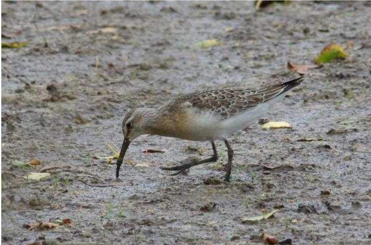
Bécasseau cocorli Calidris ferruginea juv., septembre 2014, Lussat (23) J.-P. Toumazet.