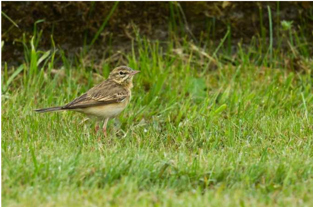
Pipit rousseline Anthus campestris ad., mai 2014, Saint-Etienne-aux-Clos (19)