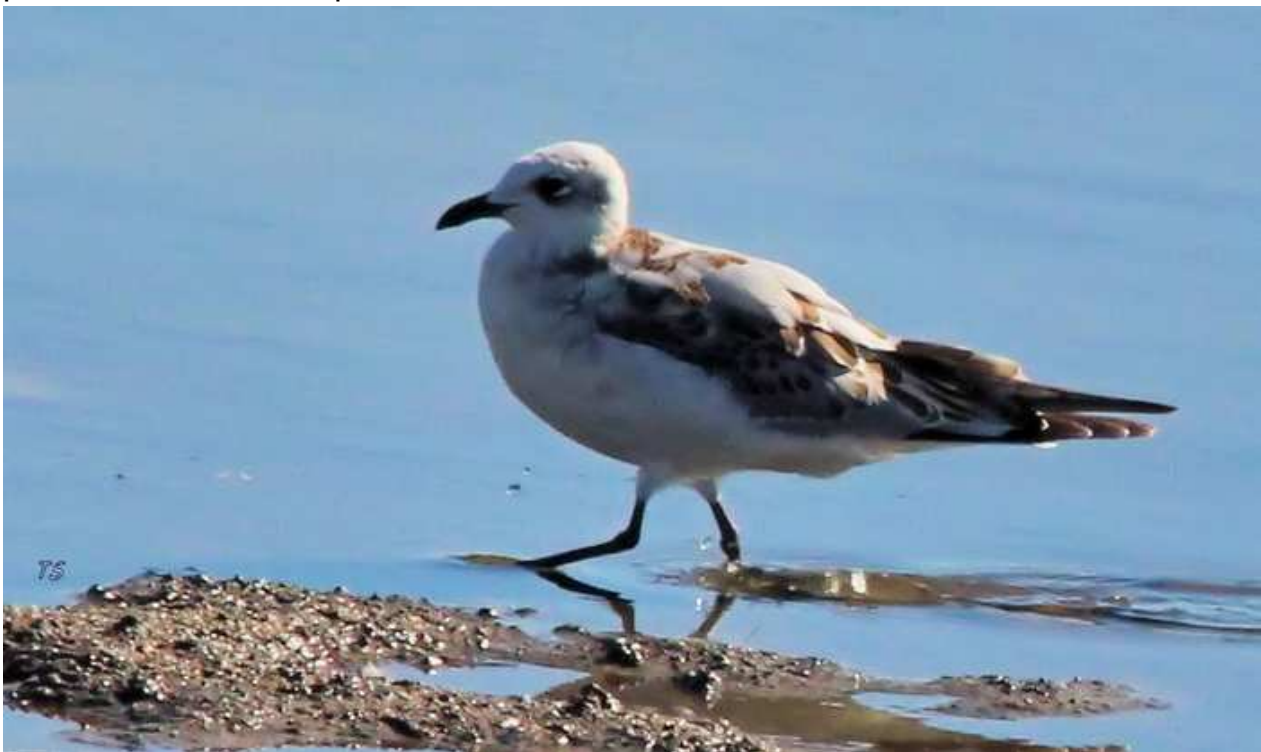
Mouette mélanocéphale Larus melanocephalus juv., octobre 2014, Lussat (23) S. Touze.

Creuse - Lussat/étang des Landes, 1A du 18/10/2014 au 20/10/2014, photo (S. Touze). Année modeste avec cette unique donnée. Toutefois, le 20 octobre constitue la date la plus tardive relevée depuis 2009.