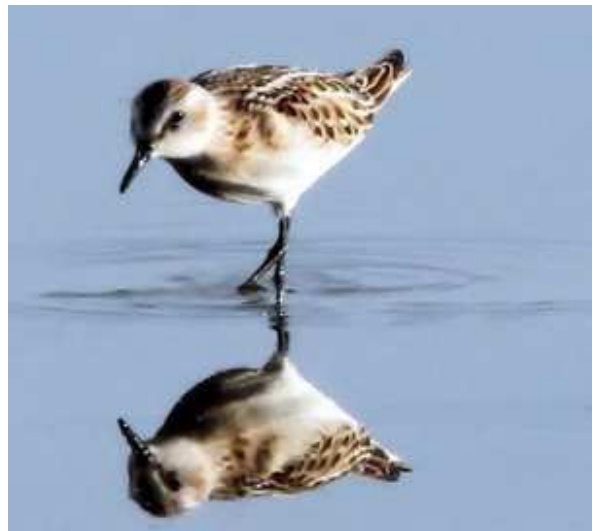
Bécasseau minute Calidris minuta juv., septembre 2014, Lussat (23) S. Touze.