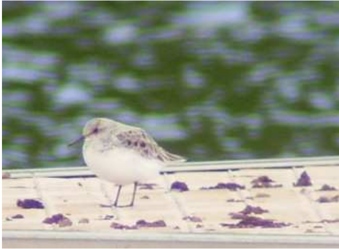
Bécasseau minute Calidris minuta ad., mai 2014, Aubazine (19) P. Marthon. On remarquera que cet oiseau est en mue.