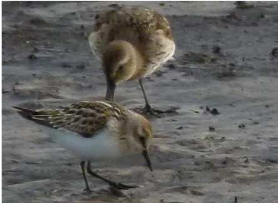
Bécasseau minute Calidris minuta , octobre 2014, Royère de Vassivière (23) G. Labidoire. en compagnie d'un Bécasseau variable Calidris alpina (arrière plan).