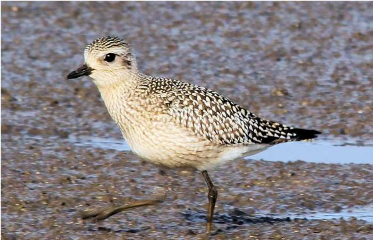
Pluvier argenté Pluvialis squatarola 1A., octobre 2014, Lussat (23) S. Touze.