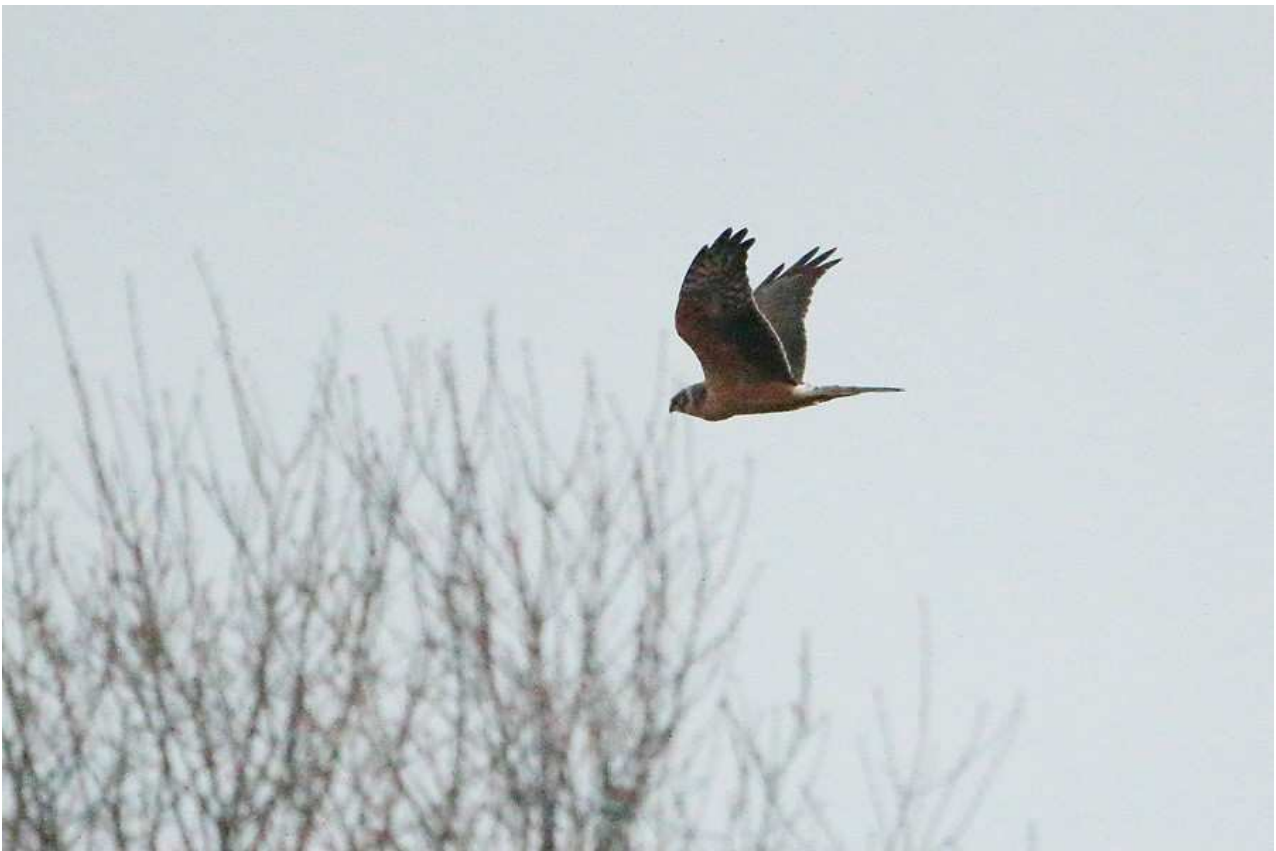
Busard pâle Circus macrourus mâle 1A, décembre 2014, Gorre (87) Ch. Mercier.

La première mention de l'espèce ne date que de 2012, mais elle est observée à nouveau en 2013 puis deux fois en 2014 ! L'oiseau du plateau de Millevaches est contacté à une date classique correspondant au passage pré-nuptial. La mention hivernale de Haute-Vienne est extraordinaire. Elle concerne un jeune mâle fréquentant un dortoir de Busards Saint-Martin sur une lande, et présent plusieurs jours consécutifs. D'autres individus ont été signalés en France au cours de l'hiver (Camargue, Charente maritime, Vendée), ce qui est tout aussi exceptionnel.