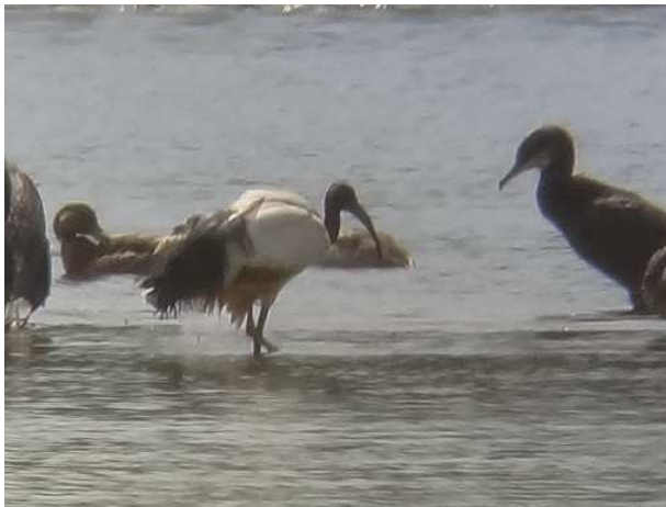
Ibis sacré Threskiornis aethiopicus , juillet 2014, Lussat (23), L. Ton.

Ce sont les deux premières mentions depuis 2009. Les observations de l'étang des Landes concernent probablement le même individu. La donnée de Haute-Vienne est nettement plus surprenante, tant par le lieu que par le nombre d'oiseaux.