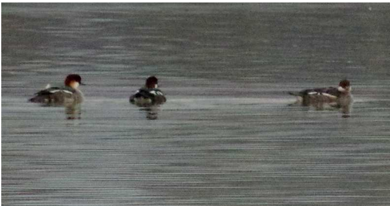
Harle piette Mergellus albellus , décembre 2014, Lussat (23) J.-P. Toumazet.

La femelle présente fin 2013 a effectué un hivernage complet à l'étang des Landes, de ce fait elle n'est pas comptabilisée. Depuis la création du CHR, hormis en 2011, un individu a été homologué chaque année. Les individus observés sont le plus souvent des immatures ou des femelles. La présence simultanée de 3 individus au mois de décembre est remarquable.