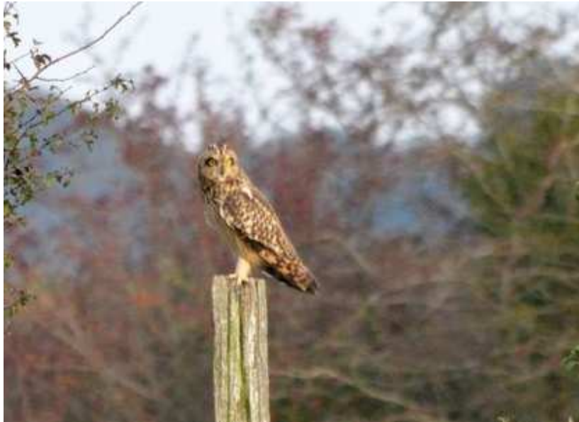
Hibou des marais Asio flammeus , octobre 2014, Saint-Vaury (23) J.-M. Bienvenu.

Année remarquable pour cette espèce, la moyenne annuelle était de 4 individus. La majorité des observations sont survenues en Creuse. Un afflux de Hiboux des marais a été constaté sur l'Europe de l'Ouest, et notamment dans tout le Massif Central.