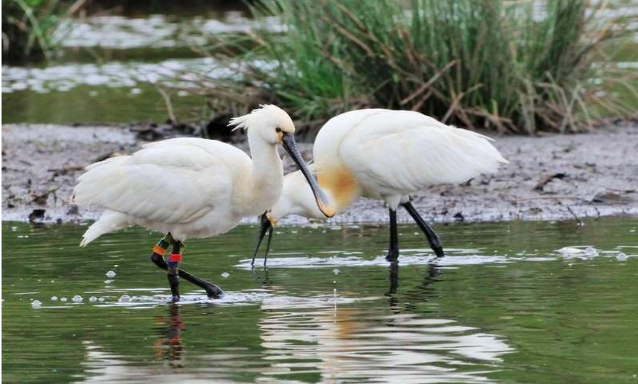
Spatules blanches Platalea leucorodia ad. et imm. bagué, mai 2014, Limoges (87)

individus observés (autant qu'au cours des cinq années précédentes). L'espèce est souvent contactée à l'unité ; les deux observations concernant deux individus ensemble sont donc notables. Celle du lac d'Uzurat, à Limoges, concernait un adulte accompagné d'un immature bagué, probablement un oiseau né aux Pays-Bas d'après la combinaison des bagues couleurs.