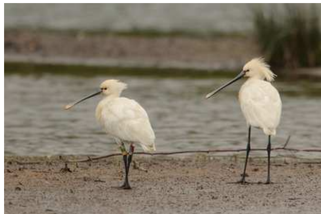
Spatules blanches Platalea leucorodia ad. et imm. bagué, mai 2014, Limoges (87) Ch. Mercier.