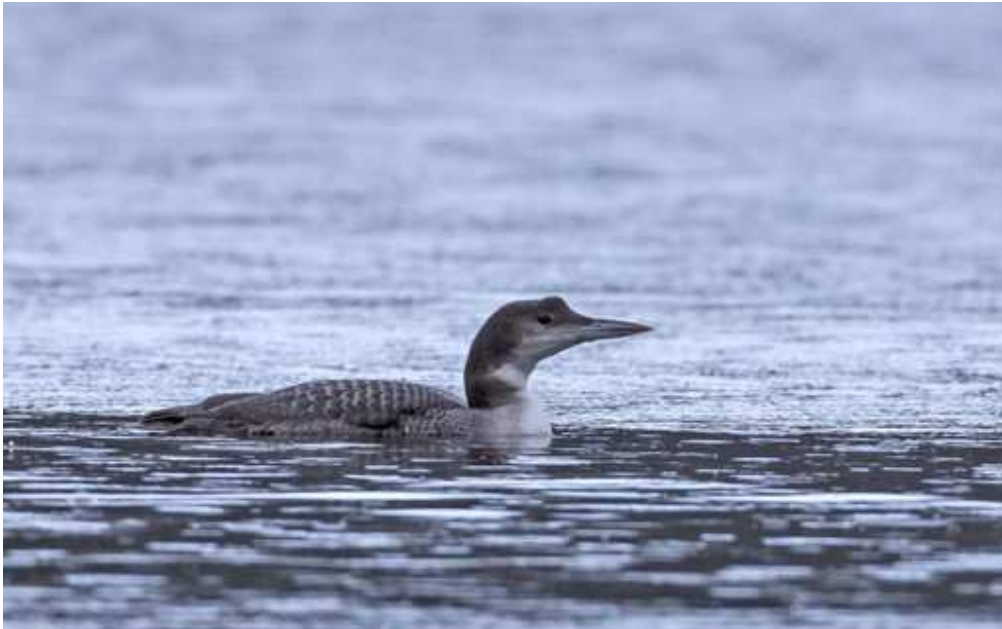
Plongeon imbrin Gavia immer juv., janvier 2014, Bort-les-Orgues (19), J. Pappalardo.

L'imbrin reste le plongeon le plus régulier en Limousin. Chaque hiver, entre novembre et mars, on observe en moyenne un ou deux individus, généralement des immatures, sur les grands plans d'eau. Le site visité en 2014 est assez classique pour cette espèce.