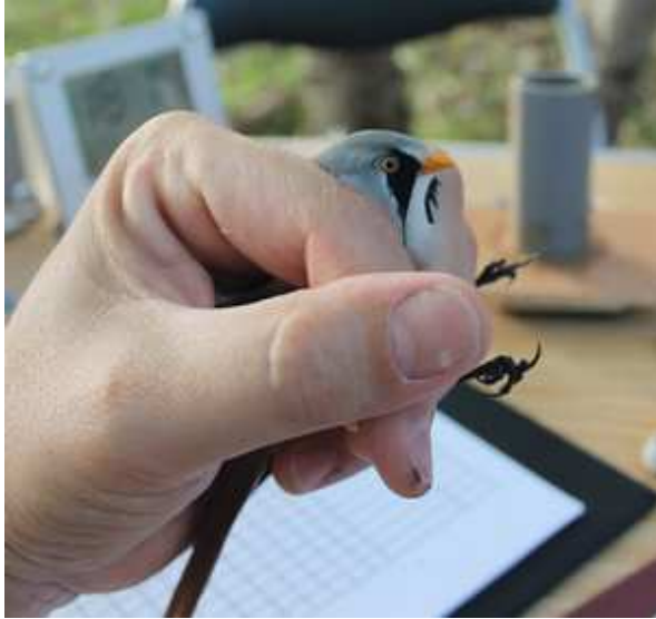
Panure à moustaches panurus biarmicus , octobre 2014 Lussat (23) K. Guerbaa.