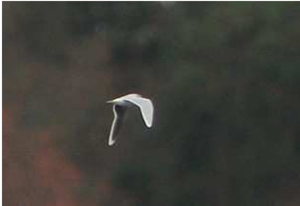
Mouettes pygmées Hydrocoloeus minutus 5 ind., novembre 2014, Peyrat-le-Château (87) Ch. Mercier.

Classiquement, l'étang des Landes concentre la majorité des citations. Les effectifs sont élevés cette année, puisqu'ils représentent près des \frac{3}{4} du total relevé depuis 2009. Les groupes de 6 individus notés à Lussat et de 5 individus à Peyrat-le-Château constituent ainsi des effectifs remarquables pour notre région.