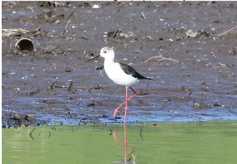
Échasse blanche Himantopus himantopus , avril 2017, Limoges (87) M. Maurice.