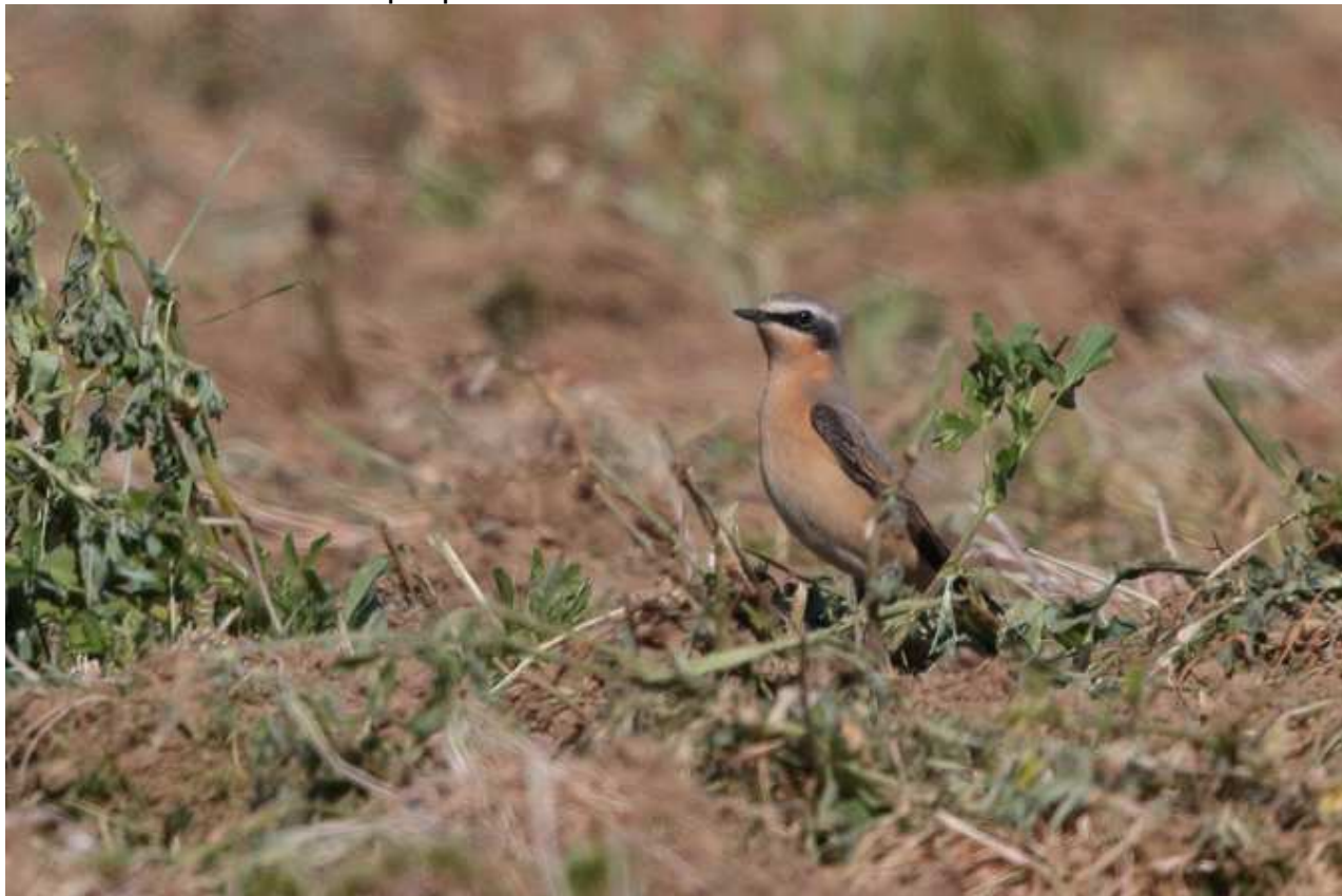
Traquet motteux du Groenland Oenanthe oenanthe leucorhoa , avril 2017, Flavignac (87) F. Desage.

Ce traquet se reproduit du Nord-est du Canada à l'Islande. Jusqu'à ces dernières années seul un examen biométrique pouvait certifier le taxon.