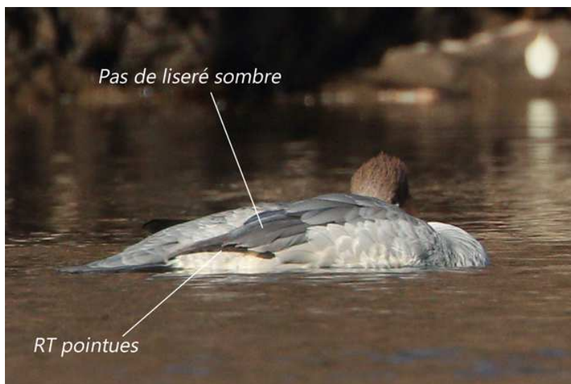
Harle bièvre Mergus merganser , type fem. 2A janvier 2017, Limoges (87) Ch. Mercier.