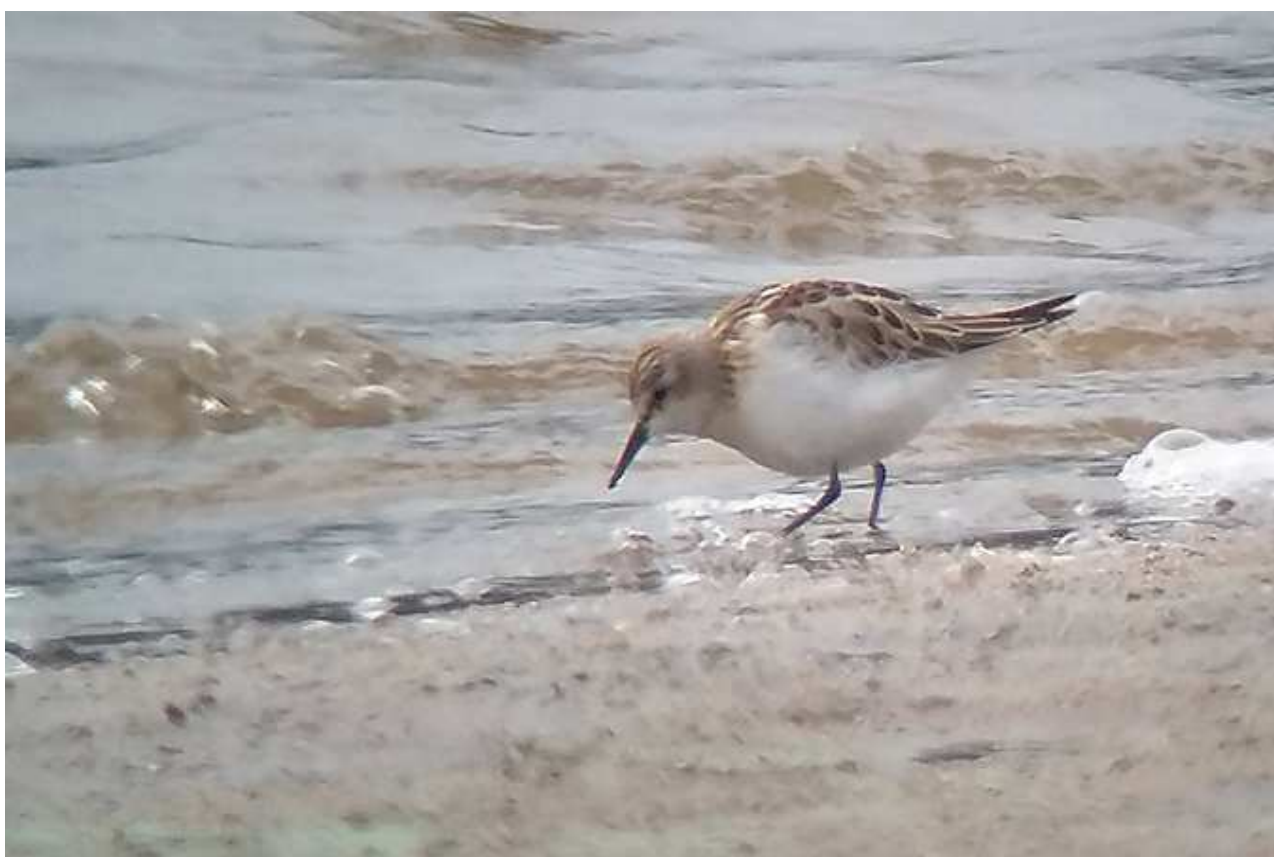
Bécasseau minute Calidris minuta , ind. 1A, septembre 2017, Saint-Pardoux (19) Ch. Mercier.

Les trois données haut-viennoises sont assez exceptionnelles car en dehors de la commune de Lussat les données sont extrêmement rares. Tous les individus observés sont généralement des oiseaux de 1 ère année.