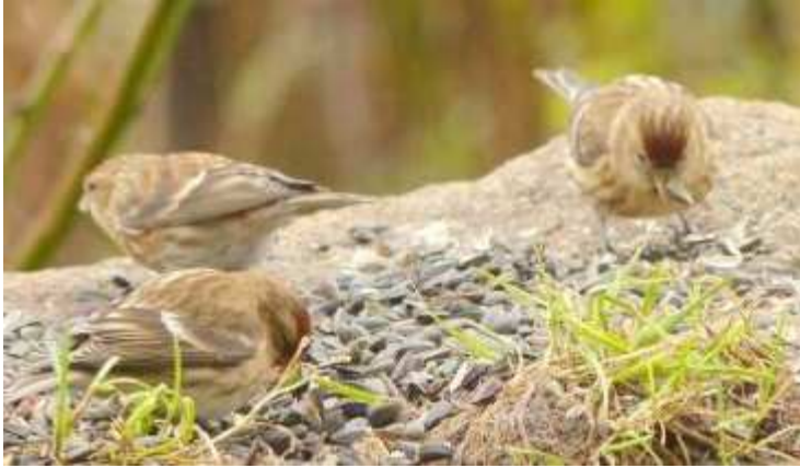
Sizerin cabaret Carduelis flammae cabaret , type fem. Décembre 2017, Roussac (87) A. Boeufgras.