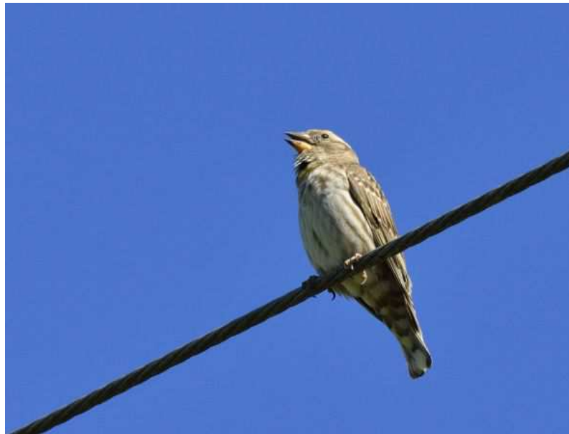
Moineau soulcie Petronia petronia , avril 2017, Neuville (19) D. Testaert.

Une prospection ciblée sur le Moineau soulcie offrirait certainement d'autres belles surprises pour cette espèce méditerranéenne un peu négligée.