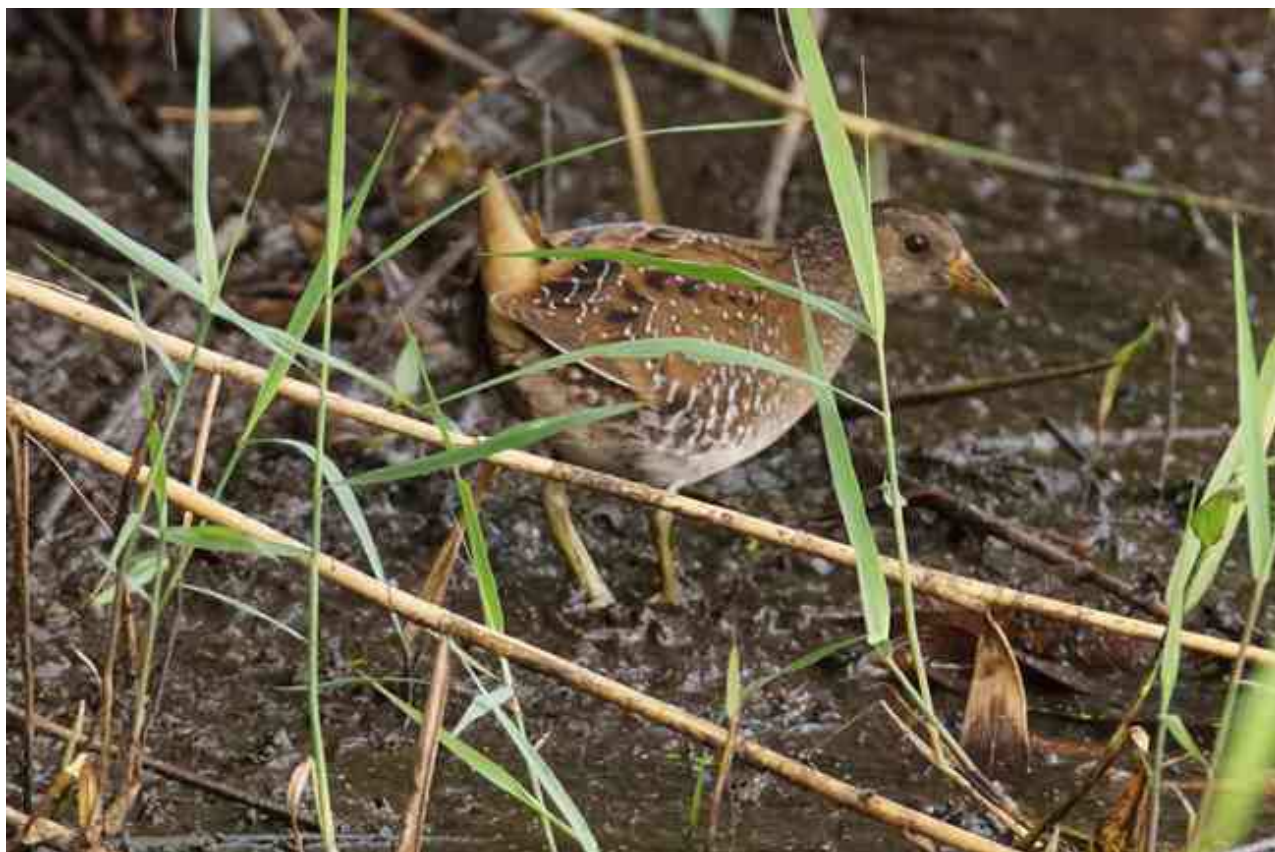
Marouette ponctuée Porzana porzana , ind. 1A, septembre 2017, Lussat (23) D. Philippon.

ÉCHASSE BLANCHE Himantopus himantopus (31/62 - 7/11) - du 01/01/2009 au 01/07/2017.