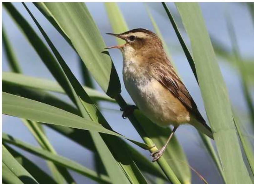
Phragmite des joncs Acrocephalus schoenobaenus , juin 2017, Lussat (23) B. Brunet.

Seules sont prises en compte les données jusqu'au 01/07/2017, à cette date le Phragmite des joncs a été retiré de la liste des espèces soumises à homologation régionale.