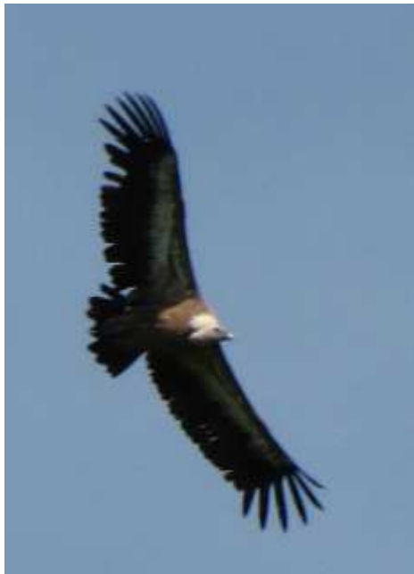
Vautour fauve Gyps fulvus , mai 2017, La Croisille-sur-Briance (87) G. Didierre.

Excellent premier semestre en nombre d'apparitions. Seules sont prises en compte les données jusqu'au 01/07/2017, à cette date le Vautour fauve a été retiré de la liste des espèces soumises à homologation régionale.