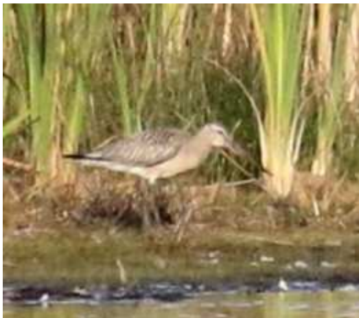
Barge rousse Limosa lapponica , octobre 2017, Lussat (23) J.P. Toumazet.

Le dernier contact avec la Barge rousse remonte à août/septembre 2013 quand un individu avait stationné cinq semaines à l'Étang des Landes. L'autre homologation régionale était survenue à Neuvic en 2011, l'espèce étant très rare à l'intérieur des terres.