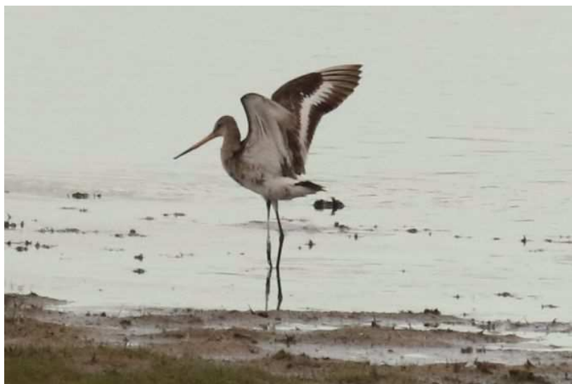
Barge à queue noire Limosa limosa , septembre 2017, Lussat (23) J.P. Toumazet.