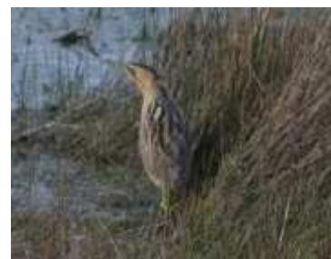
Butor étoilé Botaurus stellaris , Avril 2017, Ambazac(87) E. Fressinaud Mas de Feix.