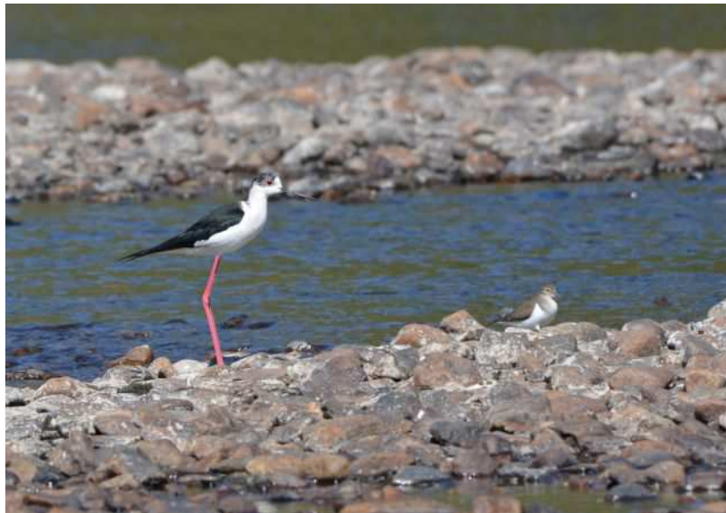
Échasse blanche Himantopus himantopus , avril 2017, Limoges (87) E. Le Roy.