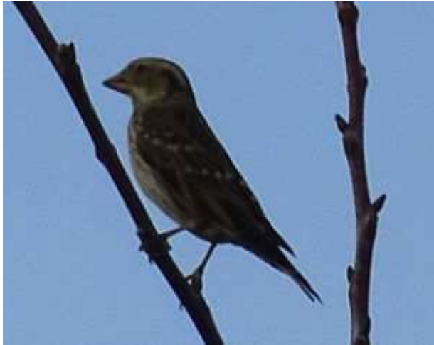
Moineau soulcie Petronia petronia , novembre 2017, Meyssac (19) M. Vérité.