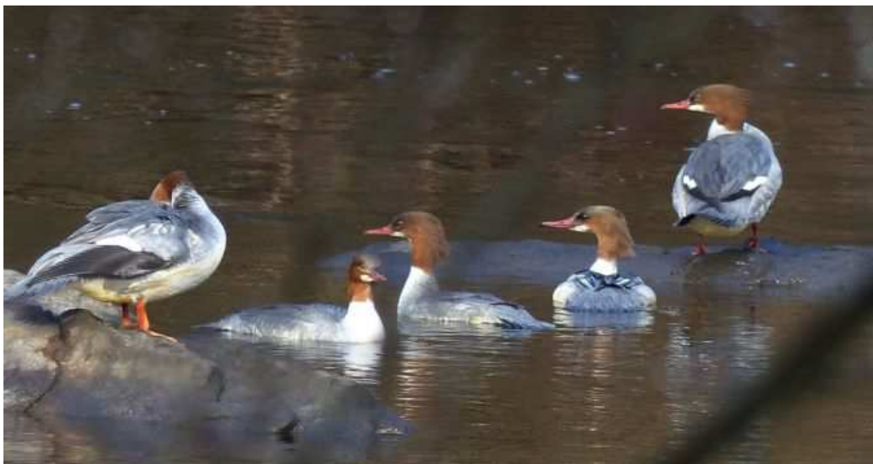
Harle bièvre Mergus merganser , février 2017, Limoges (87) N. Lagarde.