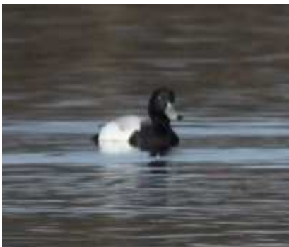
Fuligule milouinan Aytha marila , février 2017, Lussat (23) E. Fressinaud Mas de Feix.

Pour la première fois l'espèce est homologuée à l'Étang des Landes où il a effectué une halte d'un mois. Pour son hivernage, ce nicheur nordique préfère les rivages marins.