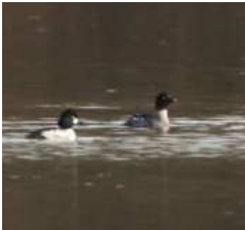
Garrot à œil d'or Bucephala clangula , cple, février 2017 ,Lussat (23) M. Ruchon.