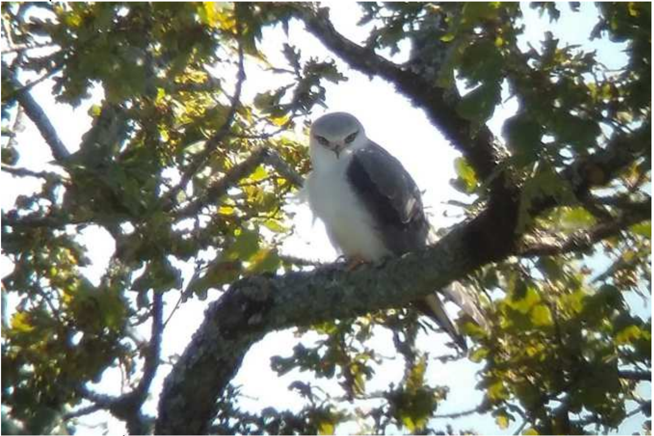
Élanion blanc Elanus caeruleus , ind.1A septembre 2017, Saint-Bonnet-Briance (87) Ch. Mercier.

Après une première régionale en 2008, nous avons assisté à une explosion des données d'Élanions blancs. Commencée en Haute-Vienne l'aire des observations s'est étendue vers la Corrèze. La durée du stationnement d'un individu à Saint-Bonnet-Briance est remarquable.