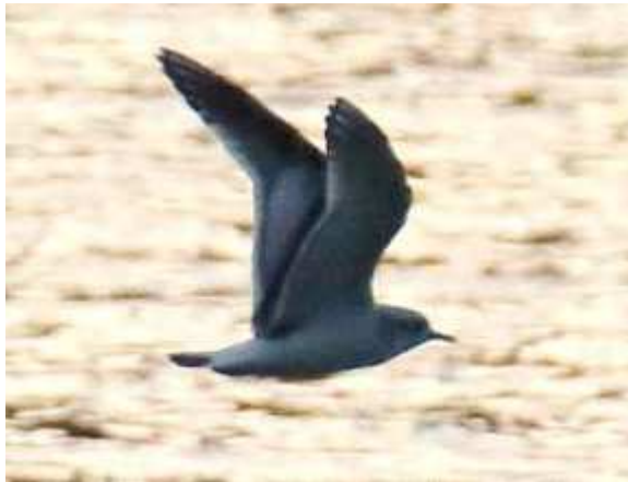
Mouette pygmée Hydrocoloeus minutus , ind. 1A, Novembre 2017, Lissac-sur-Couze (19) J-M Bigaud.