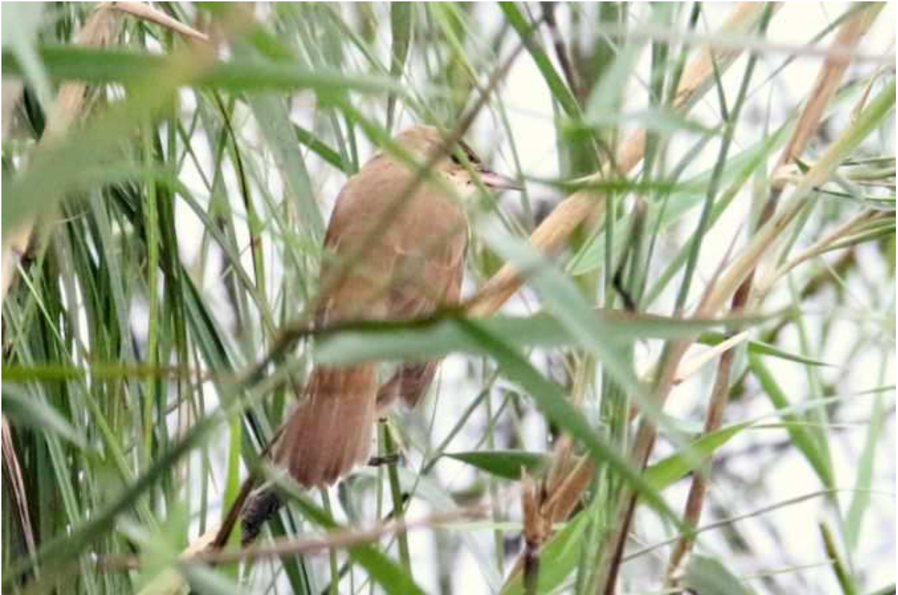
Rousserolle turdoïde Acrocephalus arundinaceus , Août 2017, Lussat (23) J. P. Toumazet.

L'observation au mois de mai survenue en période de nidification pourrait être porteuse d'espoir, depuis 1977 sa reproduction n'a plus été documentée sur ce site. Ces trois dernières années, notamment grâce aux programmes de baguage, l'espèce apparaît régulièrement lors de sa migration post-nuptiale. A cette période, les données documentées font uniquement état d'oiseaux de 1 ère année.