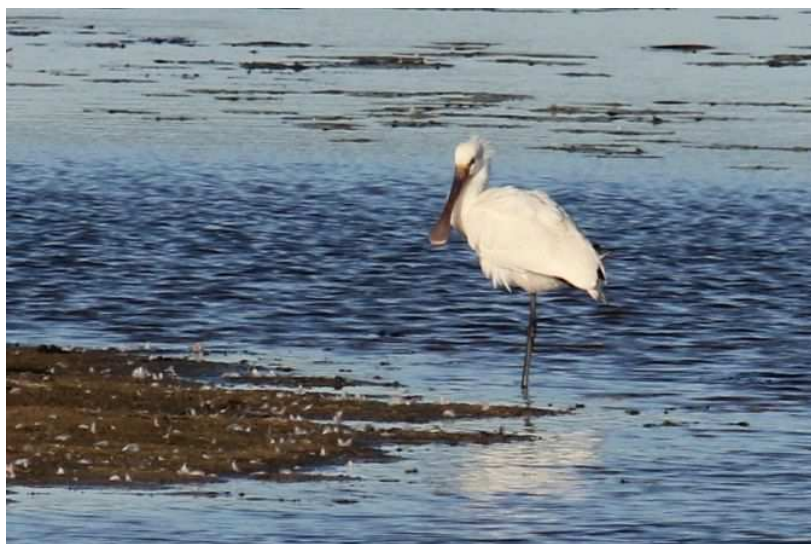
Spatule blanche Platalea leucorodia , imm. août 2017, Lussat (23) J.P. Toumazet.

En dehors du bassin de Lussat, quelques observations peuvent être réalisées au printemps de manière aléatoire sur quelques plans d'eau comme à Neuvic cette année.