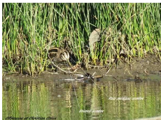
Bécassine sourde Lymnocyrtus minimus , avril 2017, Saint-Dizier-Leyrenne (23) F. et Ch. Collin.

probablement sous-estimée. Observée dans les trois départements, elle peut être présente un peu partout mais l'espèce est très difficile à observer. Le meilleur moyen pour la détecter est de la déranger en passant à quelques mètres de l'endroit où elle se tapit.