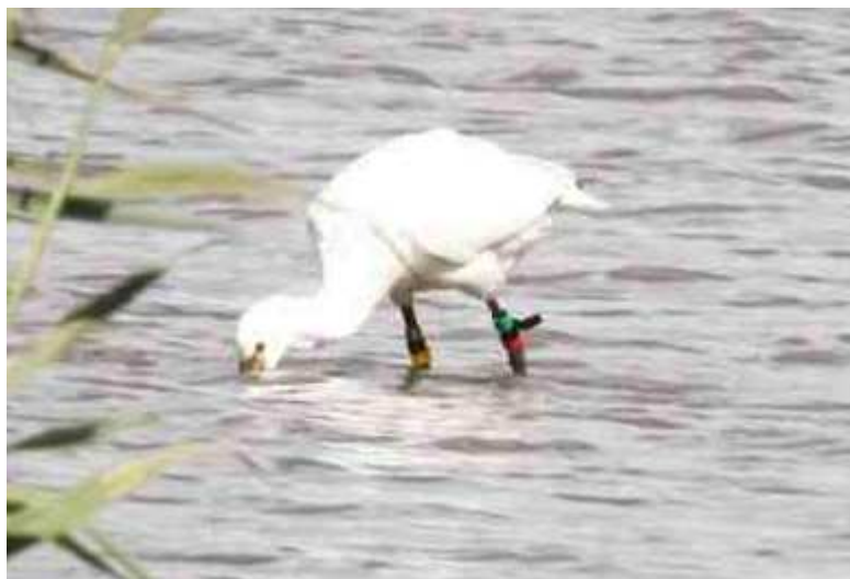
Spatule blanche Platalea leucorodia , baguée, septembre 2017, Lussat (23) D. Philippon.