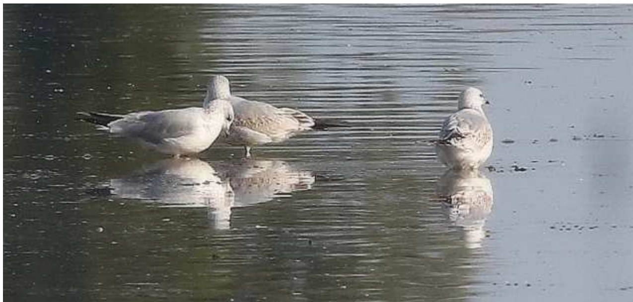
Goélands cendrés Larus canus , novembre 2017, Lussat (23) B. Brunet.