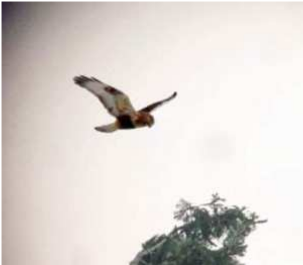
Buse pattue buteo lagopus , janvier 2017, Neuvic (19) P. Dur.