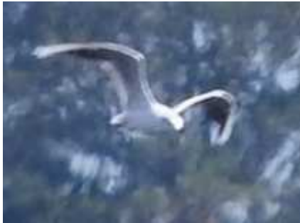
Mouette pygmée Hydrocoloeus minutus , août 2016, Lussat (23) F. Van Rooij.

Cette année le nombre des contacts s'équilibre entre les deux passages migratoires. Généralement ils sont plus nombreux lors de la migration post-nuptiale. Le plus souvent l'Étang des Landes enregistre la totalité des données. Sur ce dernier site on retiendra la présence d'un groupe de onze individus. La première apparition régionale de l'espèce remonte à 1977. Cet oiseau nordique hiverne essentiellement en mer.