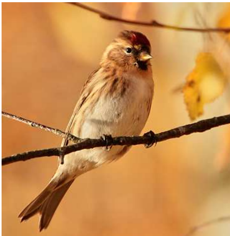
Sizerin cabaret Carduelis flammae cabaret , ind. 1A novembre 2017, Peyrat-le-Château (87) Ch. Mercier.