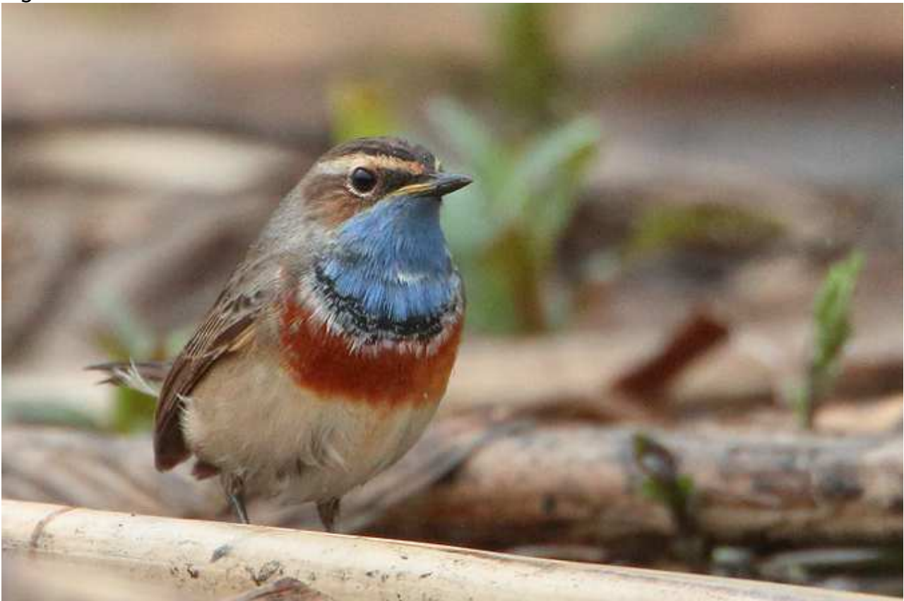
Gorgebleue à miroir Luscinia svecica , mâle, mars 2017, Limoges (87) Ch. Mercier.

Seules sont prises en compte les données antérieures 01/07/2017, date à laquelle la Gorgebleue à miroir a été retirée de la liste des espèces soumises à homologation régionale.