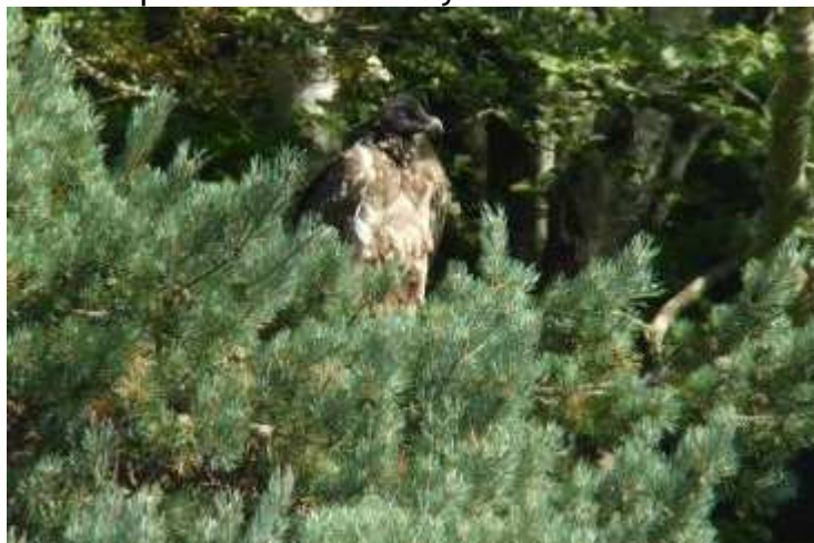
Gypaète barbu Gypaetus barbatus , ind.1A août 2017, Viam (19) M. Mas.

Viaduc est un mâle, né le 29/01/2017 au centre d'élevage d'Haringsee en Autriche. Il a été lâché à Nant dans le département de l'Aveyron le 02 mai 2017.