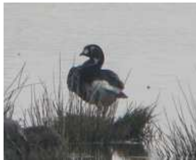
Bernache à cou roux Branta ruficollis , avril 2009, Lussat (23) N. Deschaumes.

Observation homologuée par le CHN pour la période du 03/11/2008 au 11/01/2009. L'oiseau a été présent sur le site jusqu'au 4 avril 2009.