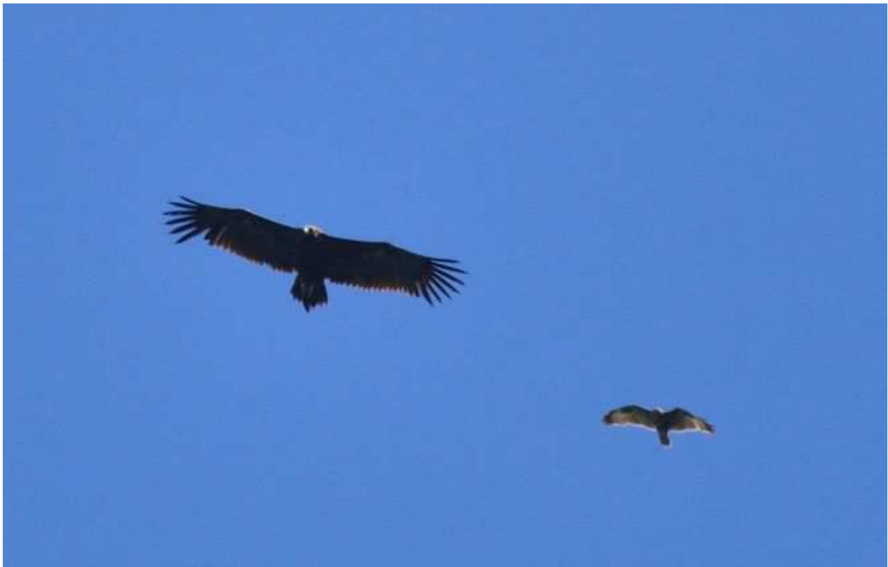
Vautour moine Aegypius monachus , imm. avril 2017, Saint-Julien-le-Pèlerin (19) D. Testaert.

Pour la première fois depuis le premier contact régional en 2009 l'espèce est citée à deux reprises. Toutes les données précédentes concernaient des individus isolés. Se déplaçant à haute altitude ces oiseaux passent probablement inaperçus. La totalité des observations concerne le nord-est du Limousin, essentiellement le plateau de Millevaches.