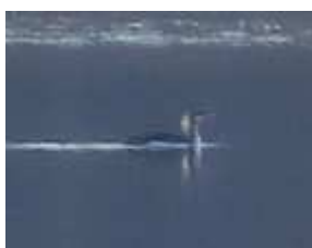
Plongeon catmarin Gavia stellata , 2A janvier 2017, Royère-de-Vassivière (23) B. Brunet.

Cet oiseau était déjà présent en 2016 aussi il n'est pas comptabilisé. Il a stationné un mois durant sur un des rares sites de la région où il a déjà été observé dans le passé. En hivernage, si c'est le plongeon le plus commun dans le nord de la France il est très rare dans le sud-ouest du pays.