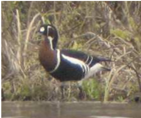
Bernache à cou roux Branta ruficollis , novembre 2008, Lussat (23) Ch. Mercier..

Creuse - Lussat/Étang des Landes, du 31/10/2008 au 04/04/2009 (G. Dubois, Ch. Mercier, N. Deschaumes et al.).