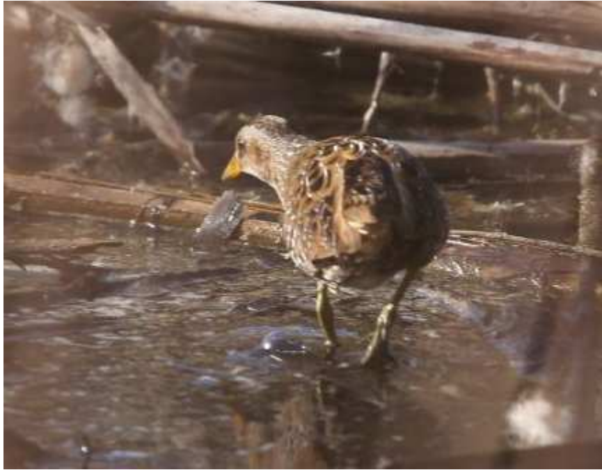
Marouette ponctuée Porzana porzana , mars 2017, Limoges (87) E. Biarnex.