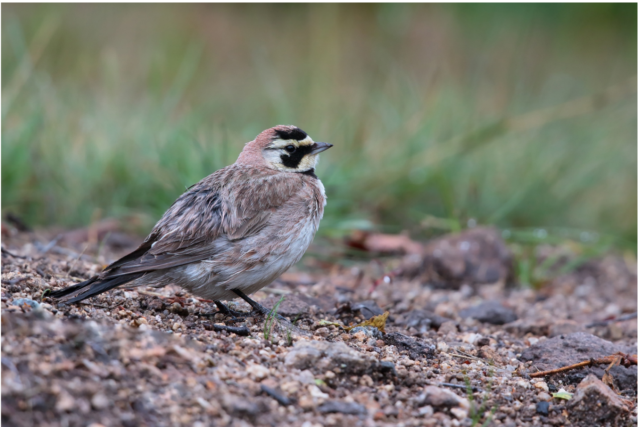
Alouette haussecol Eremophila alpestris , juillet 2017, Royère-de-Vassivière (23) F. Desage.