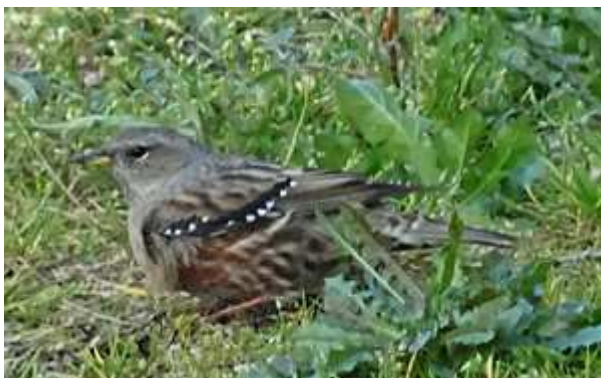
Accenteur alpin Prunella collaris , novembre 2017, Puy d'Arnac (19) M. Vérité.

Nous sommes loin des pics d'apparition de l'hiver 2012/2013, mais avec ces deux données le bilan est satisfaisant. Le relief accidenté des deux sites documentés est favorable à l'espèce, mais les deux données ont trait à des oiseaux de passage.