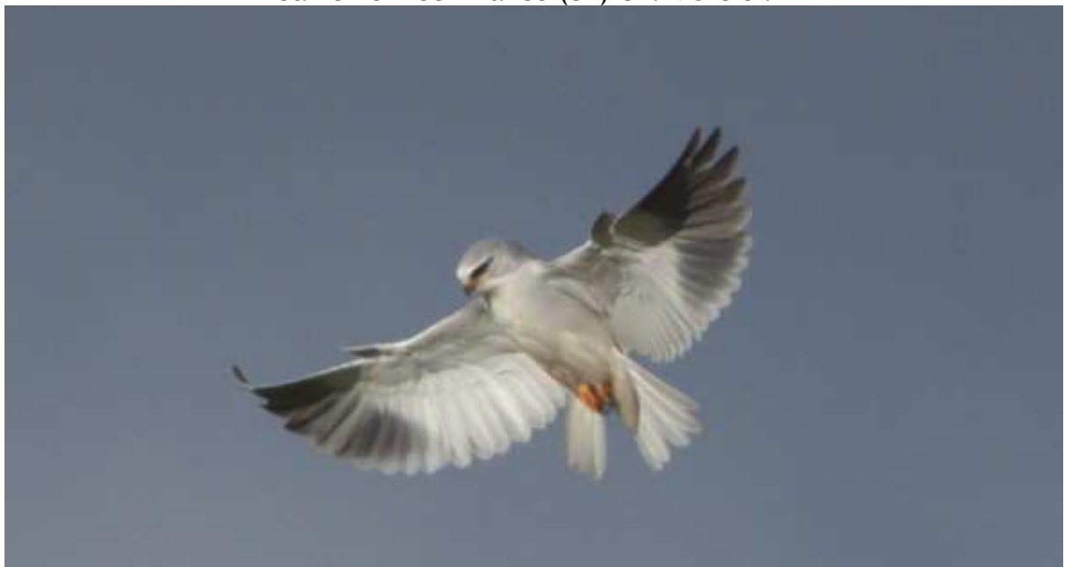
Élanion blanc Elanus caeruleus , ind.1A décembre 2017, Saint-Bonnet-Briance (87) R. Petit.