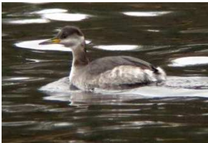
Grèbe jougris Podiceps grisegena , février 2017, Royère-de-Vassivière (23) A. Virondeau.