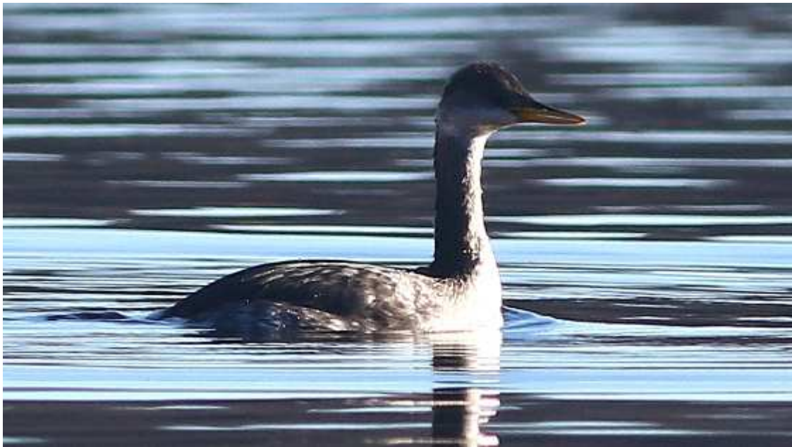
Grèbe jougris Podiceps grisegena , janvier 2017, Beaumont-du-Lac (87) B. Brunet.

Cet oiseau n'est pas comptabilisé car il est arrivé sur le Lac de Vassivière en novembre 2016. Il a été présent durant plus de trois mois sur son site d'hivernage. Il a fait le bonheur de nombreux ornithologues. En Limousin la plupart des observations sont hivernales et concernent de jeunes oiseaux.