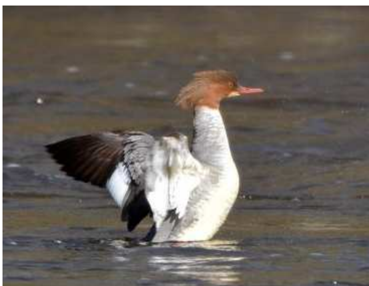
Harle bièvre Mergus merganser , mars 2017, Limoges (87) E. Le Roy