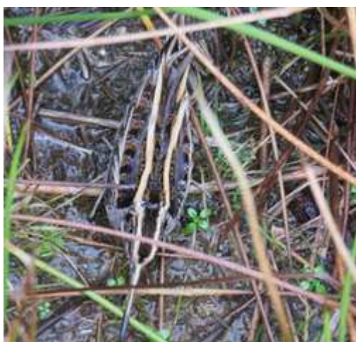
Bécassine sourde Lymnocyrtus minimus , décembre 2017, Ambazac (87) E. Fressinaud Mas de Feix