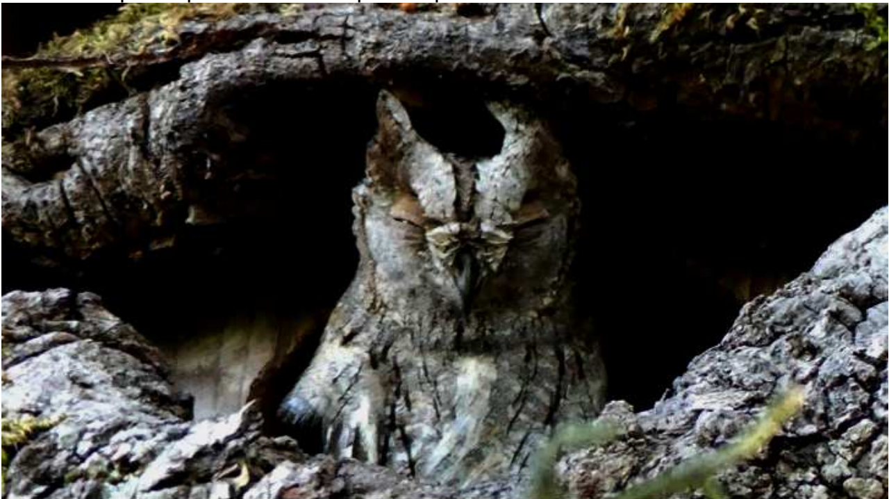
Petit-Duc scops Otus scops , mai 2017, Verneuil-sur-Vienne (87) J. Lechevallier.

Après trois ans d'absence pour la deuxième année consécutive l'espèce est contactée dans la région. Bien que n'ayant jamais été très abondante, ces dernières années, il semblerait que l'espèce se fasse de plus en plus rare.