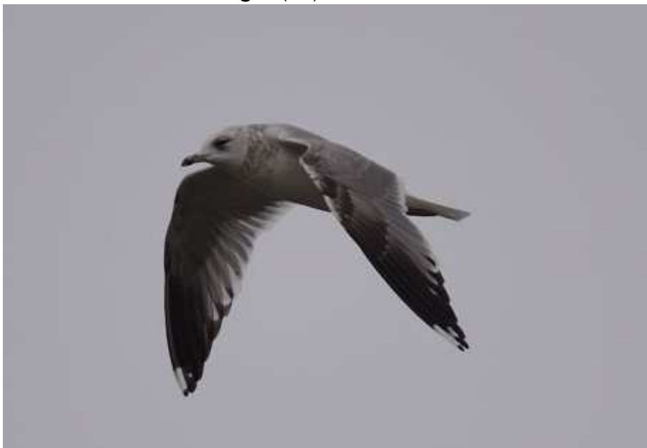
Goéland cendré Larus canus , ind. 3 A, février 2017, Lussat (23) F. Taboury.