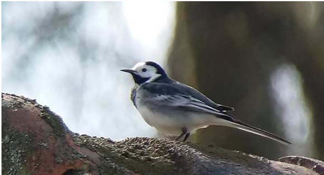
Bergeronnette de Yarrell Motacilla alba yarrelli , avril 2017, Saint-Sylvestre (87)