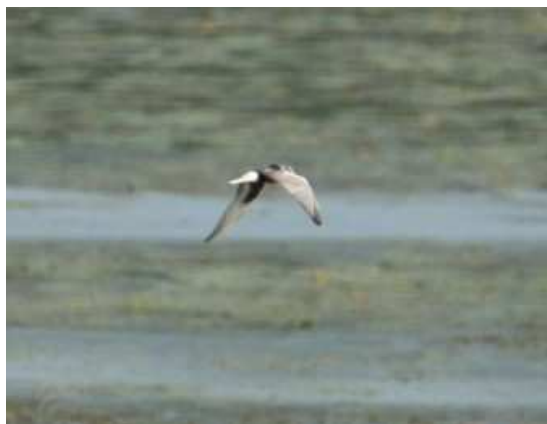
Guifette leucoptère Chlidonias leucopterus , août, Lussat (23) M. Ruchon.

A l'instar des années précédentes l'Étang des Landes a de nouveau accueilli cette guifette. Pour la première fois l'espèce est homologuée fin août. Les autres données étaient survenues au mois de mai. Toutes les citations concernent des oiseaux isolés. Ce nicheur du sud-est de l'Europe demeure extrêmement rare chez nous, il est apparu pour la première fois en Limousin en 1999.