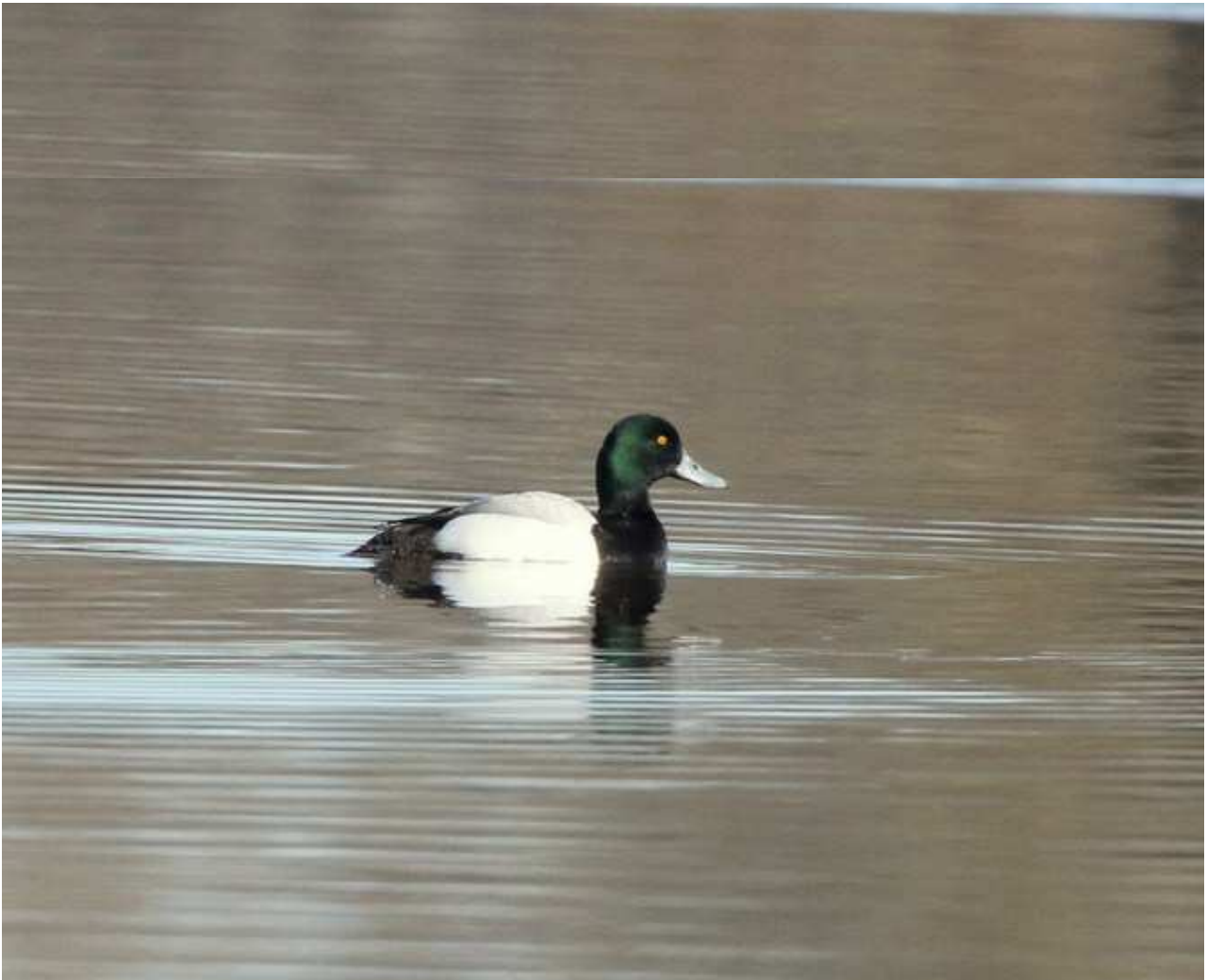
Fuligule milouinan Aythya marila , mars 2017, Lussat (23) J.P. Toumazet.