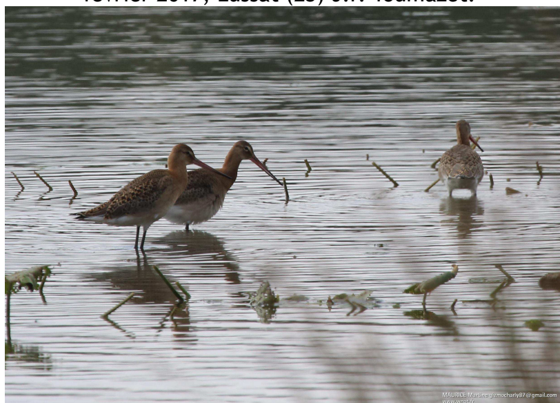
Barge à queue noire Limosa limosa , Août 2017, Saint-Martin-le-Mault (87) M. Maurice.