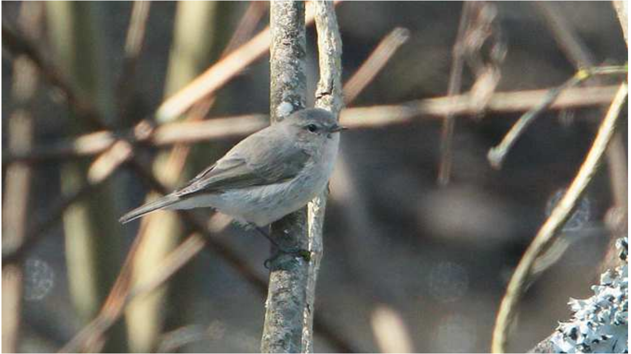
Pouillot de type sibérien Phylloscopus collybitatristis/fulvescens , mars 2017, Limoges (87) Ch. Mercier.