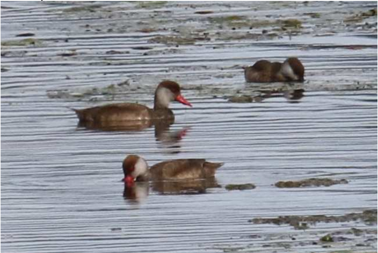
Nette rousse Netta rufina , août 2017, Lussat (23) J.P. Toumazet.

Le pattern d'apparition a été très large à l'Étang des Landes qui est le seul site à avoir accueilli l'espèce. Malgré des observations printanières, la nidification de l'espèce n'a pas encore été décelée. À chaque migration l'espèce a été observée parfois sur des périodes relativement longues. De ce fait il n'est pas évident de savoir combien d'oiseaux y ont transité.