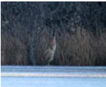
Butor étoilé Botaurus stellaris , janvier 2017, Montagnac-Saint-Hippolyte(19) R. Petit.

Les apparitions de janvier ne sont pas surprenantes, celle du Marais du Brezou à Lagraulière en avril est assez inattendue. Avec 6 individus en tenant compte de ceux de 2016, l'année est assez exceptionnelle pour une espèce de plus en plus rare en Limousin. Déjà présents fin 2016 les 2 oiseaux de l'Étang neuf à Lagraulière et de l'Étang de Cieux ne sont comptabilisées.