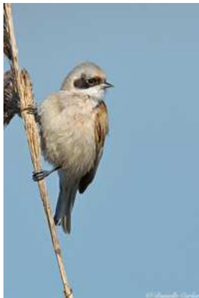
Rémiz penduline Remiz pendulinus , avril 2017, Lussat (23) D. Carlier.

Seules sont prises en compte les données jusqu'au 01/07/2017, à cette date la Rémiz penduline a été retirée de la liste des espèces soumises à homologation régionale.