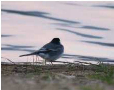
Bergeronnette de Yarrell Motacilla alba yarrelli , avril 2017, Ambazac (87) E. Fressinaud Mas de Feix