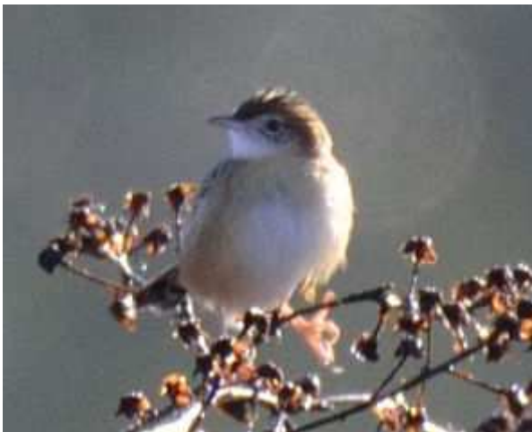
Cisticole des joncs Cisticola juncidis , décembre 2017, Monceaux-sur-Dordogne (19) D. Testaert.