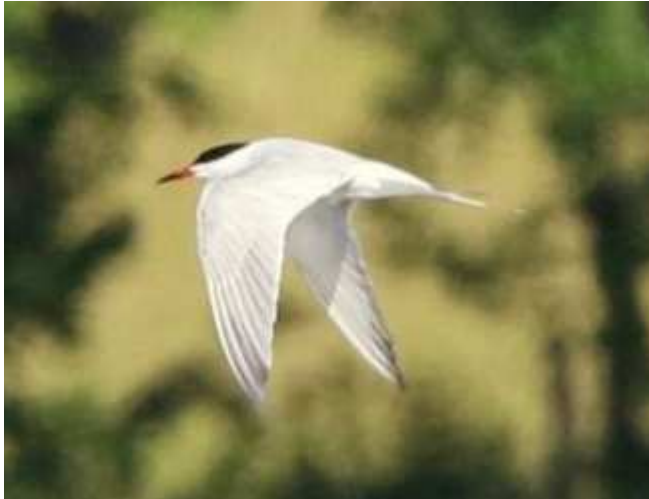
Sterne pierregarin Sterna hirundo , juin 2017, Lussat (23)

Seules sont prises en compte les données jusqu'au 01/07/2017, à cette date la Sterne pierregarin a été retirée de la liste des espèces soumises à homologation régionale.