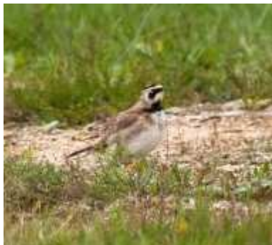
Alouette haussecol Eremophila alpestris , juillet 2017, Royère-de-Vassivière (23) Y. Thouret.

La première apparition régionale de cette alouette aura fait le bonheur de nombreux ornithologues. L'espèce niche de la Scandinavie au nord de l'Eurasie. En France, elle fréquente en petit nombre le nord-ouest du pays à la mauvaise saison. En hivernage elle est très rare à l'intérieur des terres.