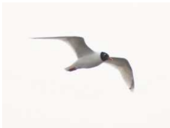
Mouette mélanocéphale Larus melanocephalus , ad., mars 2017, Neuvic (19) N. Gauthier.