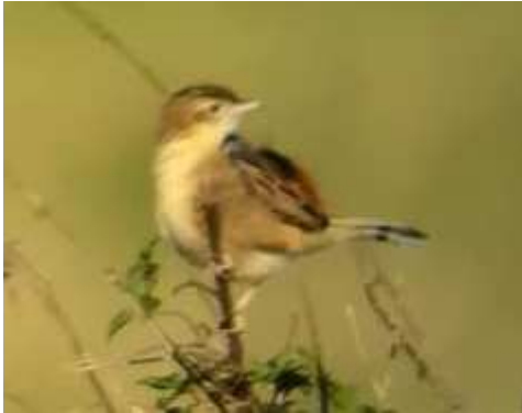
Cisticole des joncs Cisticola juncidis , novembre 2017, Vutezac (19) L. Ton.

Cette année le nombre de données explose, pourtant avec 7 individus l'année 2016 était déjà exceptionnelle. Les 3 départements sont représentés. La présence durant plusieurs mois au printemps à Saint-Viance et à Saint-Pantaléon-de-Larche engendre de fortes suspicions de nidification. En Limousin les habitats favorables sont nombreux, une implantation durable de la Cisticole des joncs peut-être envisagée à conditions que les hivers ne soient pas trop rudes.