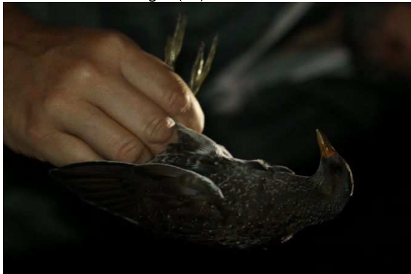
Marouette ponctuée Porzana porzana , ind. 1A, août 2017, Lussat (23) K. Guerbaa.