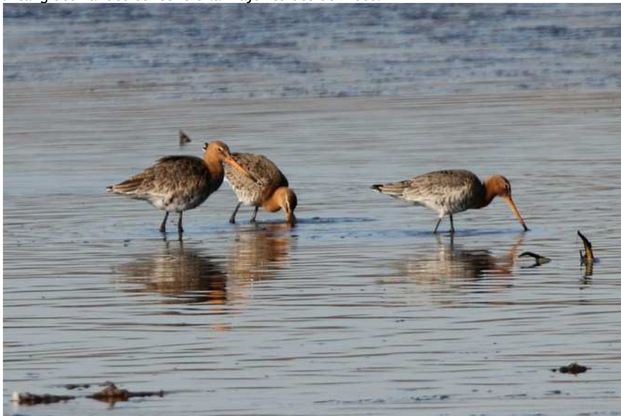
Barge à queue noire Limosa limosa , février 2017, Lussat (23) J.P. Toumazet.

seconde année consécutive l'espèce est présente en Haute-Vienne. Classiquement l'Étang des Landes concentre la majorité des données.