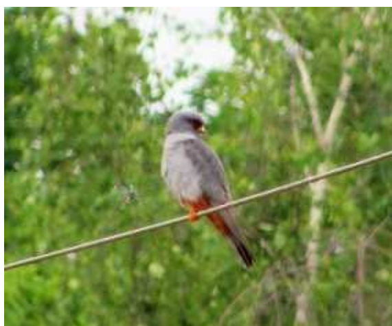
Faucon Kobez Falco vespertinus , mâle, mai 2017, Château-Chervix (87) R. Coutant.

Année remarquable pour le Faucon kobez qui est apparu dans les trois départements lors de sa migration pré-nuptiale. Les trois dates d'apparition sont conformes à la phénologie migratoire dans la région, fin avril, mai. En France l'essentiel du passage se situe dans le sud-est du pays.