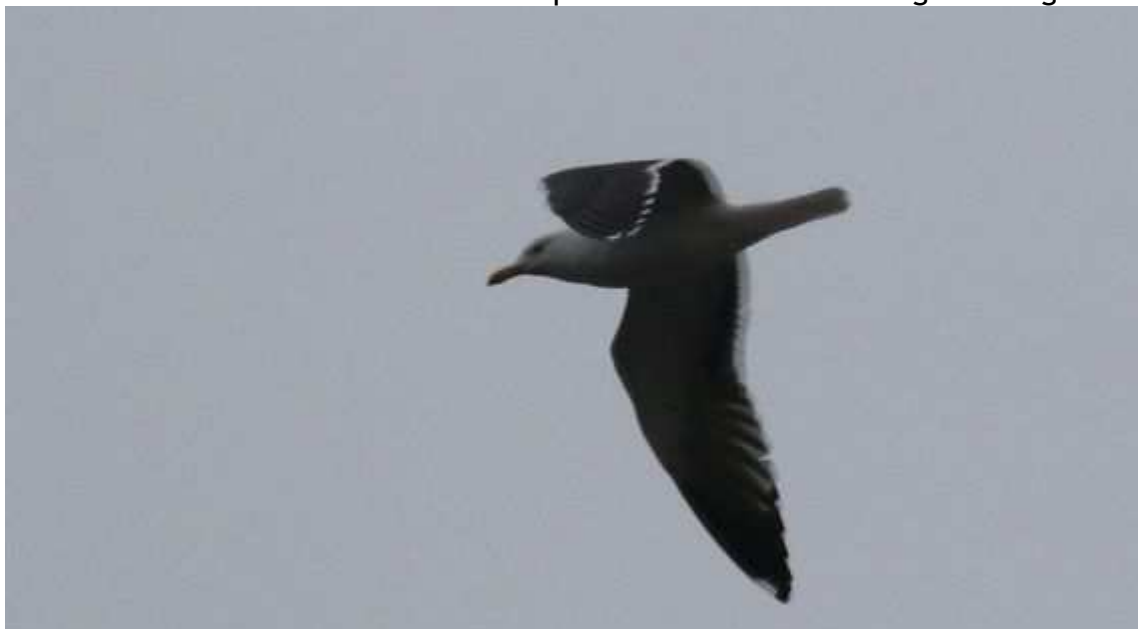
Goéland brun Larus fuscus , mars 2017, Neuvic (19) E. Ducos

Le Goéland brun est régulier en Limousin le plus souvent lors de la migration pré-nuptiale. Seules sont prises en compte les données jusqu'au 01/07/2017, à cette date le Goéland brun a été retiré de la liste des espèces soumises à homologation régionale.