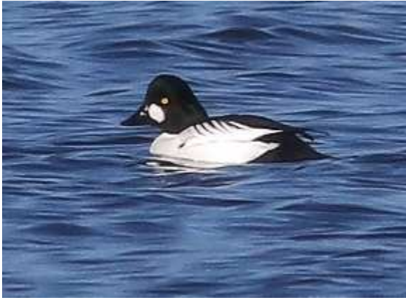
Garrot à œil d'or Bucephala clangula , mâle, février 2017 ,Lussat (23) B. Brunet.