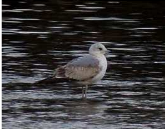
Goéland cendré Larus canus , ind.2 A, janvier 2017, Limoges (87) N. Lagarde.