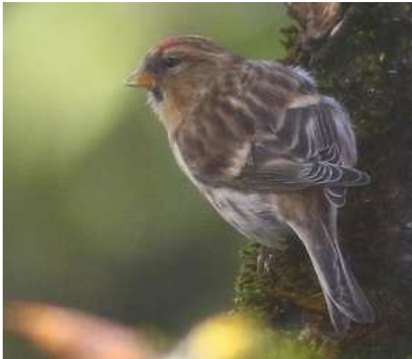
Sizerin cabaret Carduelis flammae cabaret , type fem. novembre 2017, Guéret (23) B. Brunet.

La dernière invasion remonte à l'hiver 2005/2006. Cycliquement selon la nourriture disponible l'espèce effectue une transhumance qui peut la conduire en grand nombre dans notre région. Les premières apparitions sont survenues au nord de la région puis peu à peu des sizerins sont apparus dans nos trois départements. Leur origine est mal définie. Ils peuvent provenir du massif alpin et du Jura ou des Îles britanniques. Les données en terme de citations et de nombre d'individus ne sont pas mentionnées pour les années précédentes.