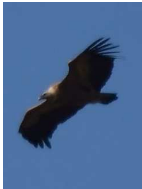
Vautour fauve Gyps fulvus , mai 2017, Albussac (19) D. Testaert.