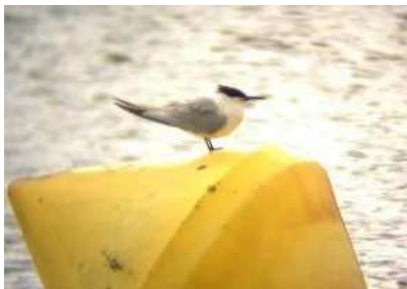
Sterne caugek Sterna sandvicensis , mai 2017, Saint-Pardoux (87) P. Salière.

Avec trois citations l'année est exceptionnelle pour cette sterne très rare à l'intérieur des terres. Généralement dans la région l'espèce est contactée lors de la migration pré-nuptiale. Le groupe de onze individus observés le 08 août est également le plus important jamais signalé dans la région. La migration post-nuptiale est précoce, la dispersion des jeunes débute en juillet.