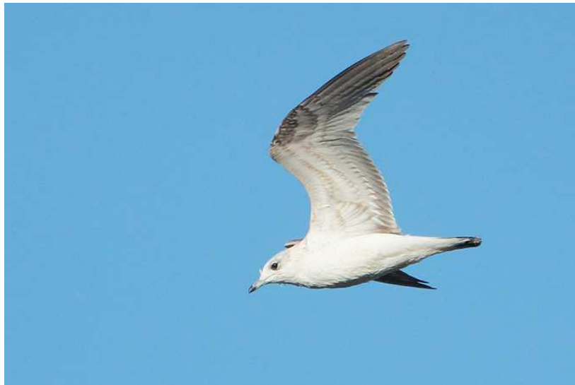
Goéland cendré Larus canus , ind.2 A, janvier 2017, Limoges (87) Ch. Mercier.