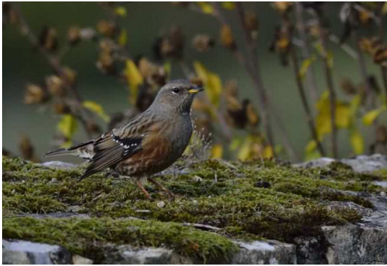
Acenteur alpin Prunella collaris , novembre 2017, Puy d'Arnac (19) D. Testaert