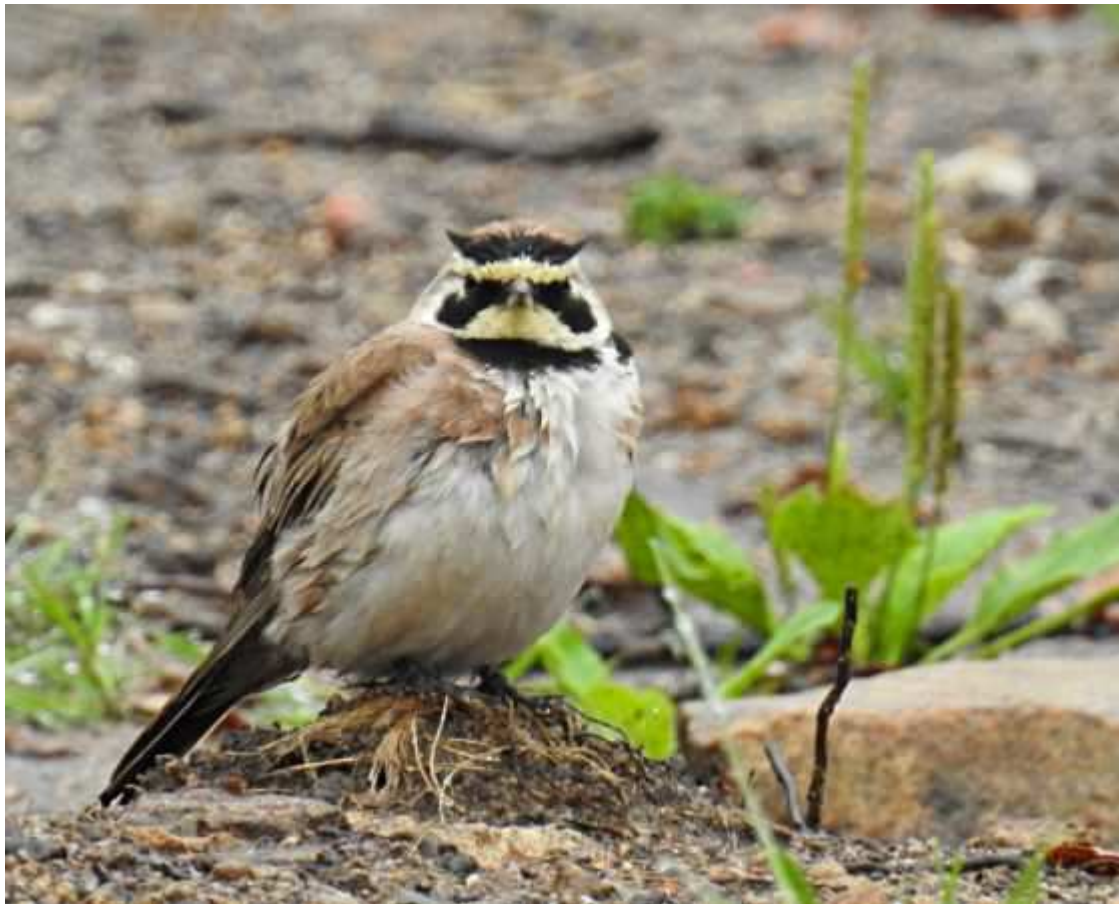
Alouette haussecol Eremophila alpestris , juillet 2017, Royère-de-Vassivière (23) L. Noally.