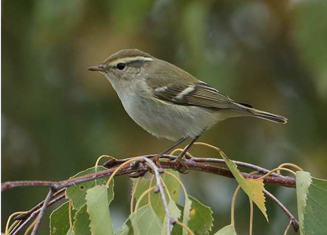
Pouillot à grands sourcils Phylloscopus inornatus , octobre 2017, Panazol (87) Ch. Mercier.