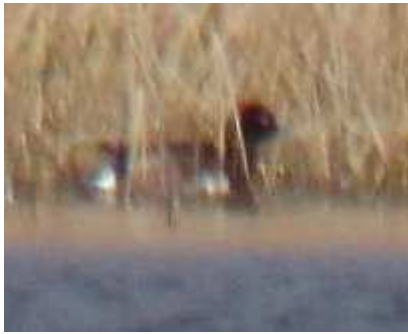
Fuligule Nyroca Aythya nyroca , janvier 2017, Saint-Hilaire-les-Courbes (19) D. Dupont.

Jamais ce fuligule n'avait été homologué hors de l'Étang des Landes et pour la première fois l'espèce est contactée en Corrèze. A ce jour, toutes les données régionales concernent des individus isolés. Bien que fréquentant tous les types de plan d'eau l'espèce préfère ceux avec une végétation bien développée. En France l'espèce est essentiellement observée dans la moitié est du pays.