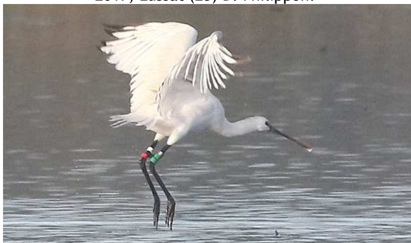
Spatule blanche Platalea leucorodia , 1A, baguée, octobre 2017, Lussat (23) B. Brunet.