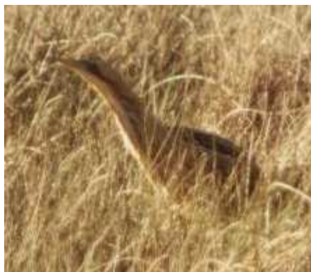
Butor étoilé Botaurus stellaris , Avril 2017, Ambazac(87) L. Fleytou.