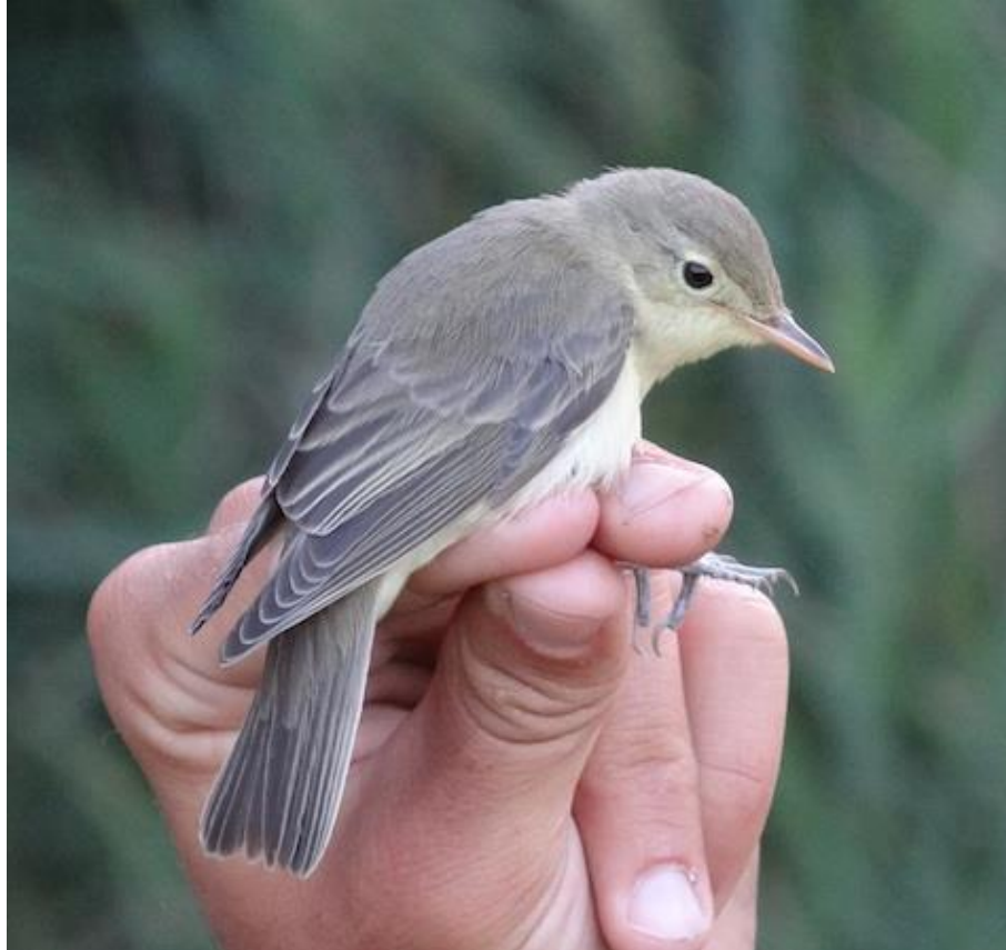
Hypolaïs icterine Hippolais icterina , Herbignac, août 2013