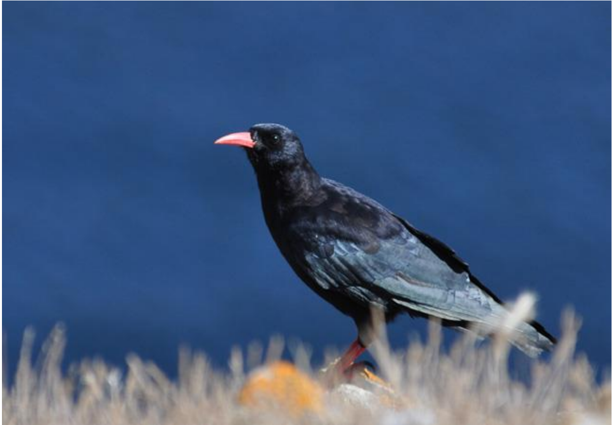
Crave à bec rouge Pyrrhocorax pyrrhocorax , Île d'Yeu, septembre 2013