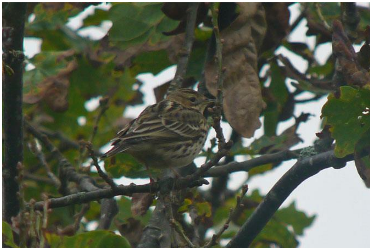
Pipit à gorge rousse Anthus cervinus , Île d'Yeu, octobre 2012

Migrateur rare et irrégulier sur les deux départements. Il s'agit de la première donnée concernant cette espèce depuis la création du comité.