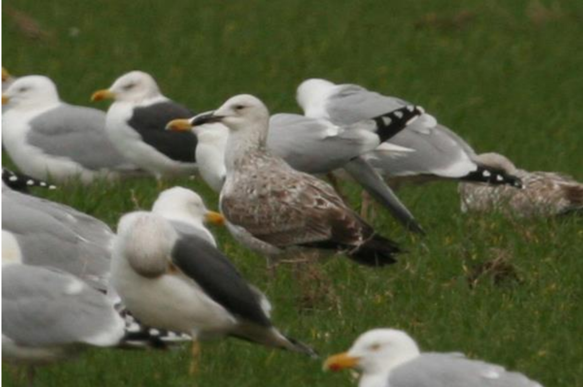
Goéland pontique Larus cachinnans , Jans, janvier 2013