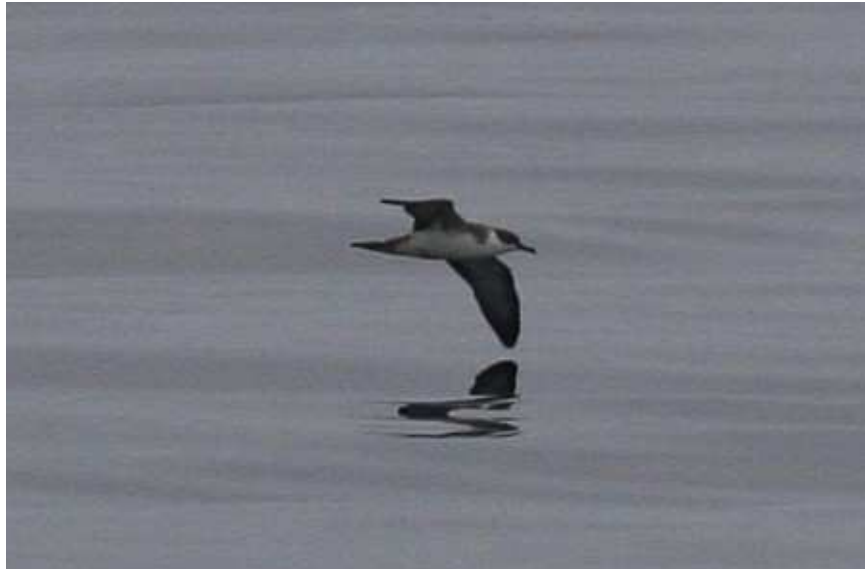
Puffin majeur Puffinus gravis , Les Sables-d'Olonne, août 2010 (T. Perrier).

(Niche dans quelques îles de l'Atlantique Sud : Inaccessible, Nightingale, Tristan da Cunha et Gough). Migrateur très rare et très irrégulier, observé le plus souvent au large de nos côtes.