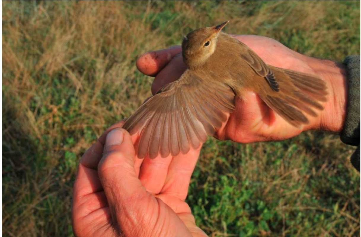
Rousserolle verderolle Acrocephalus palustris , 1 re année, Donges, août 2010 (ACROLA).