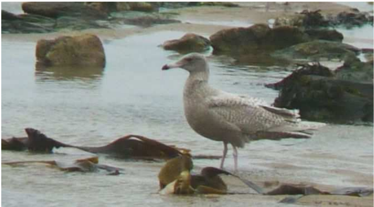
Goéland bourgmestre Larus glaucoides , Noirmoutier-en-l'île, novembre 2010.

La localisation est plutôt originale pour l'oiseau de Loire-Atlantique.