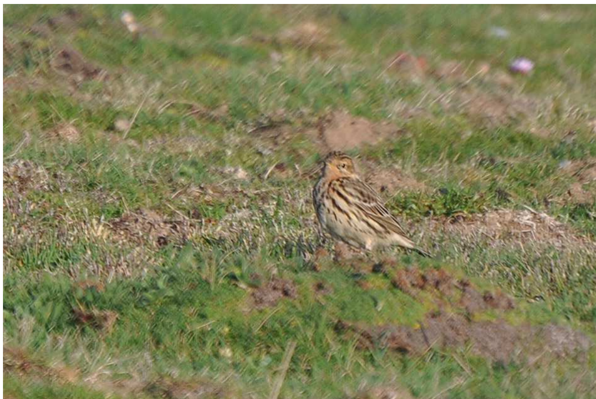
Pipit à gorge rousse Anthus cervinus , Île d'Yeu, avril 2010 (F. Portier).