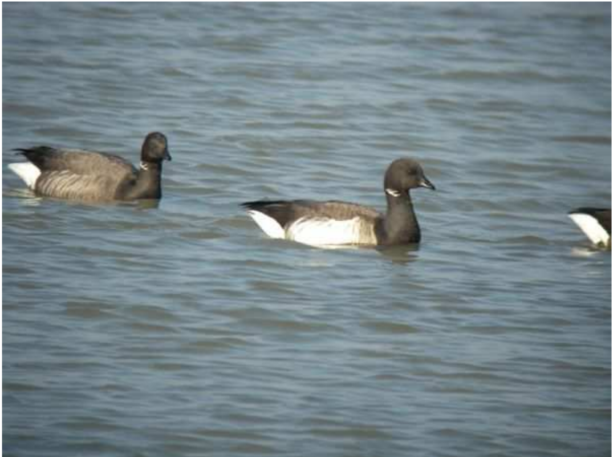
Bernache cravant à ventre pâle Branta bernicla hrota , Batz-sur-mer, mars 2010.

(Scandinavie, Sibérie). Migratrice et hivernante rare, surtout en Vendée. A rechercher l'hiver dans le sud de ce département.