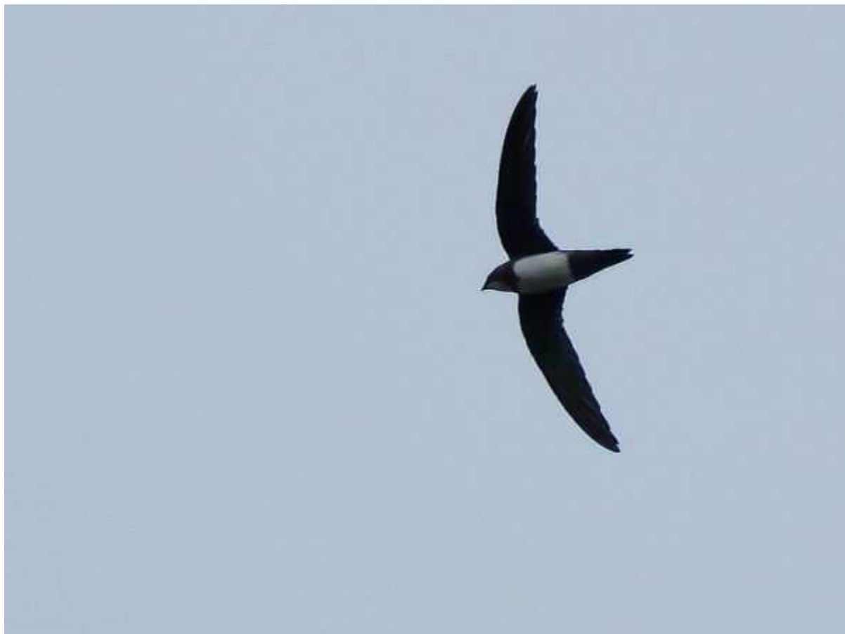
Martinet à ventre blanc Apus melba , Ile d'Yeu, octobre 2010.

(Sud de l'Europe, Asie mineure et Afrique du nord). Migrateur rare sur les deux départements. L'année 2010 apporte les premières mentions pour le lac de Grand-Lieu et pour l'île d'Yeu.