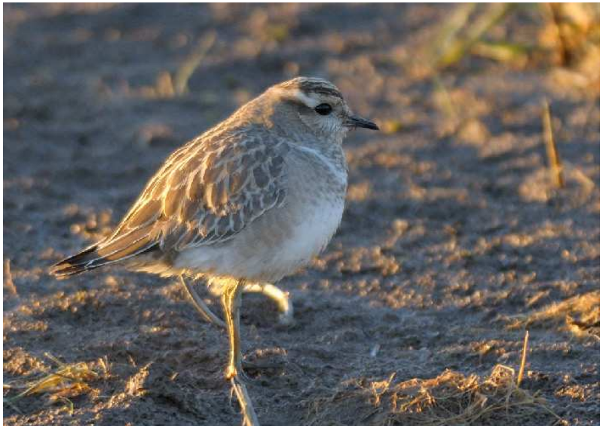
Pluvier guignard Charadrius morinellus , Bouin, mars 2010.

(Niche en Ecosse et de la Scandinavie jusqu'au sud-est de la Russie, à la Mongolie et à la Sibérie orientale. Hiverné des contreforts de l'Atlas marocain jusqu'à l'Iran en passant par tout le Maghreb, et sporadiquement dans le sud de l'Europe). Migrateur rare et irrégulier sur les deux départements aux deux passages.