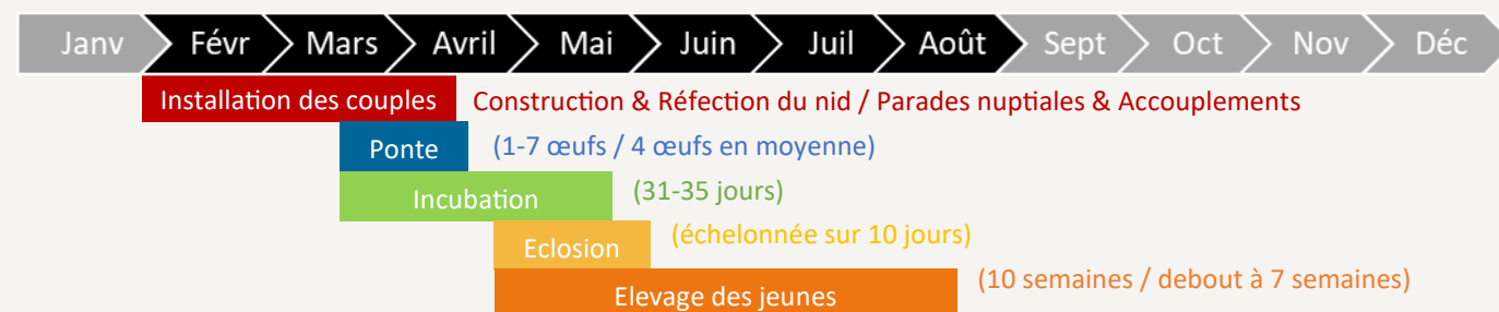
Schéma de la phénologie de reproduction de la Cigogne blanche