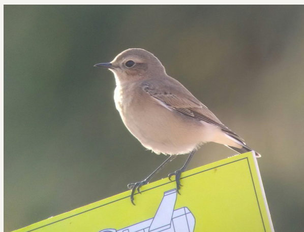
Traquet oreillard femelle/juv