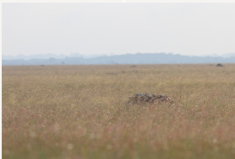
Plaine de Crau - © Laurent Rouschmeyre

En PACA il est présent majoritairement dans le département des Bouches-du-Rhône, connu dans le Vaucluse, le Var et les Alpes Maritimes et quasi absent des Alpes-de-Haute-Provence et des Hautes-Alpes. Les zones de présence connues sont très localisées notamment sur nos reliefs comme les Alpilles ou encore la Sainte-victoire ainsi que sur nos grands espaces ouverts tels que La Crau.