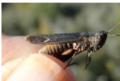
Criquet des garrigues

Une femelle tardive observée sur la commune de Joucas (84). Les 2 dernières années, l'espèce avait été notée au plus tard les 18/11/2015 et 13/11/2014. Les derniers adultes peuvent se montrer encore en décembre, voire en janvier.