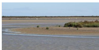
Faune-PACA Publication n° 66 Comptage Wetlands International Bilan régional Provence-Alpes-Côte d'Azur 2016

Le bilan 2016 est à retrouver en cliquant ici .