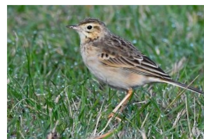
Pipit de Richard

Ailleurs, 1 au sud de l'Almanarre, Hyères (83) le 13/11 et 2 à Gréolières (06) le 10/11. La donnée des Alpes-Maritimes n'est que la quatrième dans la base Faune-PACA.