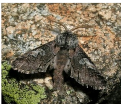
Le Double-Omega

Elle représente aussi la 1ère donnée mentionnée dans le Var sur la commune de La Celle (83).