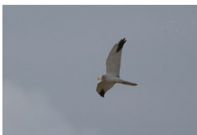
Busard pâle

Une observation solitaire d'un mâle adulte sur le site d'hivernage camarguais du Mas Cameroun et, de manière surprenante, plus aucune observation par la suite !