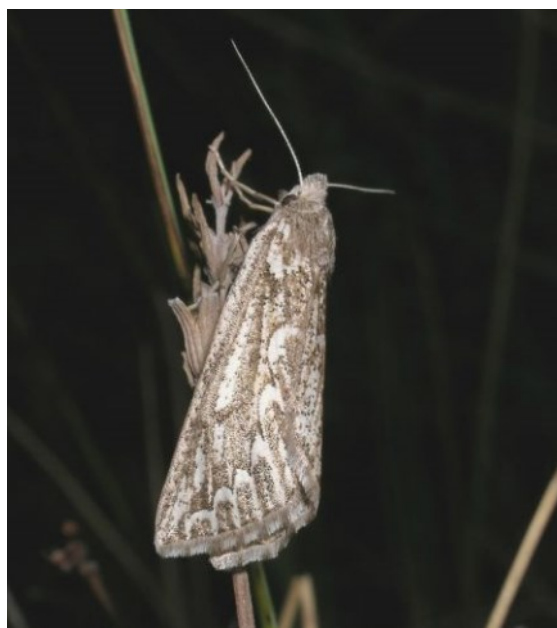
Compsoptera jourdanaria