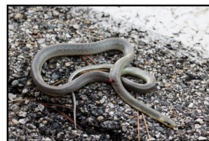
Couleuvre d'Esculape

Une donnée tardive pour cette espèce dont 1 individu a été retrouvé mort, victime d'une collision routière, sur la commune de Malauca (84).