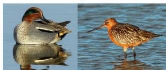
www.faune-paca.org Le site des naturalistes de la région PACA