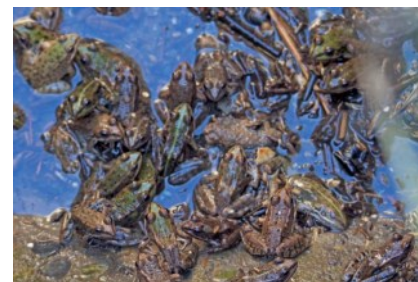
Pelophylax sp.

Une soixantaine d'individus de Grenouille du complexe rieuse/de Perez/de Graf bloqués dans un regard en ciment au Mas Cameroun, Arles (13).