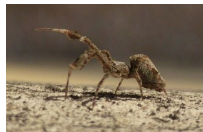
Uloborus plumipes

Observée à Grasse (06) trois fois sur le même lieu-dit : en février, en octobre et en novembre 2016. C'est une espèce déterminante ZNIEFF qui vit dans les herbes hautes. Sa toile est sensiblement horizontale, faite de mailles assez larges et de fils épais dans sa partie extérieure.