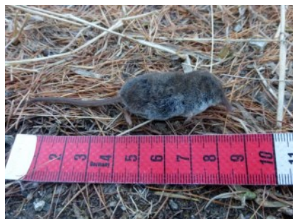
Musaraigne pygmée

1 individu retrouvé mort dans un mélezin à 1700 mètres d'altitude sur la commune d'Isola (06). Bien que largement répartie en France, cette espèce est plus rare en PACA où sa présence se limite principalement aux vallées alpines malgré quelques données plus provençales. A la différence des autres musaraignes du genre Sorex (notamment le complexe des Musaraignes carrelet/couronnée/du Valais) que seule la génétique permet de différencier, la musaraigne pygmée peut se déterminer grâce à des critères mesurables sur des animaux en main (cf. Dupasquier et Rigaux 2012).