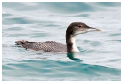
Plongeon imbrin