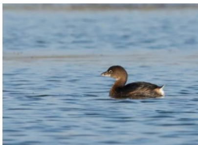
Grèbe à bec bigarré

Toujours là, mais ces dates correspondent aux deux derniers jours de présence de cette espèce américaine car elle n'a plus été contactée par la suite. L'oiseau était établi sur la Baisse de Raillon, Saint-Martin-de-Crau (13), depuis au moins le 03/07/2016.