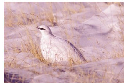
Lagopède alpin en plumage hivernal

Le Lagopède alpin est une espèce très sensible aux dérangements, notamment humains. En effet, la forte fréquentation touristique, en période hivernale (station de ski), peut déranger les oiseaux pendant cette période sensible. La chasse joue aussi un rôle non négligeable en prélevant un certain nombre d'individus.