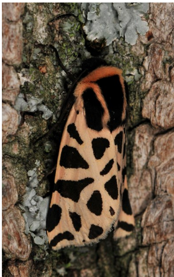
Ecaille pudique Cymbalophora pudica