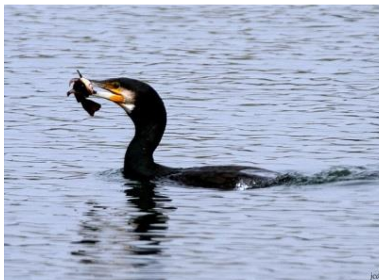
Grand Cormoran, Miribel-Jonage, mars 2017