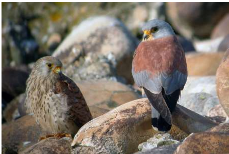
Faucons crécerellettes

Résumé : un Faucon crécerellette Falco naumanni , équipé d'une balise dans l'Hérault, a séjourné dans le Rhône du 4 août au 11 septembre 2019. C'est la première donnée de l'espèce pour le département du Rhône.