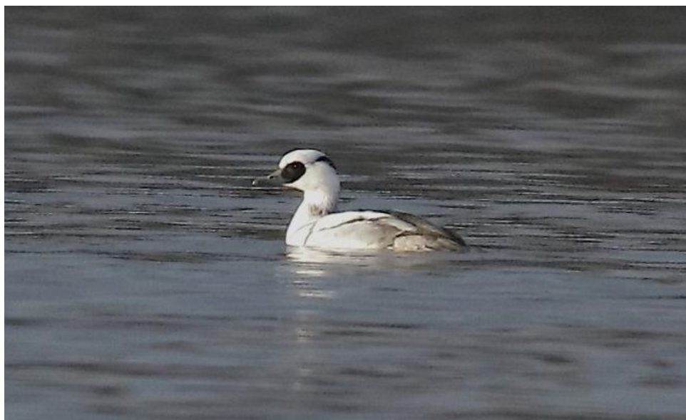
Harle piette, la Forestière, décembre 2020

Un Harle piette Mergellus albellus mâle de 2 e hiver est découvert le 12 décembre à Miribel-Jonage et va y séjourner jusqu'à la fin de l'hiver (Pierre-Laurent LEBONDIDIER et al. ). Assez peu farouche, il a fait la joie de nombreux photographes. Il s'agit sans doute du même oiseau, bien qu'il ait été d'abord observé avec quelques traces brunes immatures signant son âge, puis en plumage adulte.