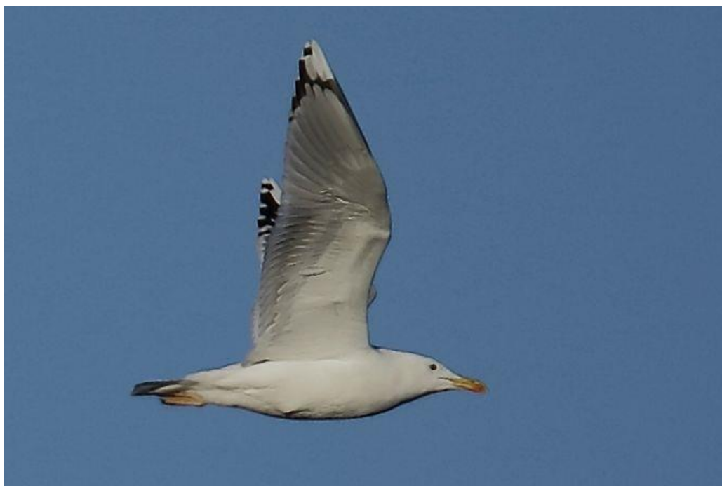
Goéland pontique, Saint-Laurent-de-Mure, décembre 2020, Loïc LE COMTE. Noter les longues langues blanches sur les primaires les plus externes P9 et P10.

Un autre est au Grand Large les 28 et 30 novembre (J.M. BÉLIARD, L. LE COMTE). Un est noté à Saint-Bonnet-de-Mure le 21 décembre (Quentin CONTRERAS), à Genas le 24 (L. LE COMTE) et à Taponas le 4 février (G. CORSAND).