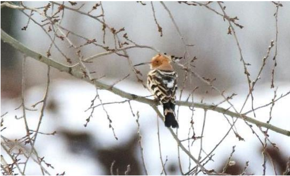
Huppe fasciée, Dardilly, janvier 2021, Michaël FONTAINE