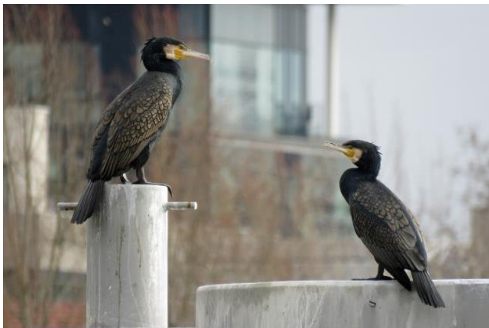
Grands Cormorans, Lyon Confluence, février 2020, D. TISSIER

Merci aux nombreux participants bénévoles qui permettent le suivi de cette espèce, parfois décriée à tort !