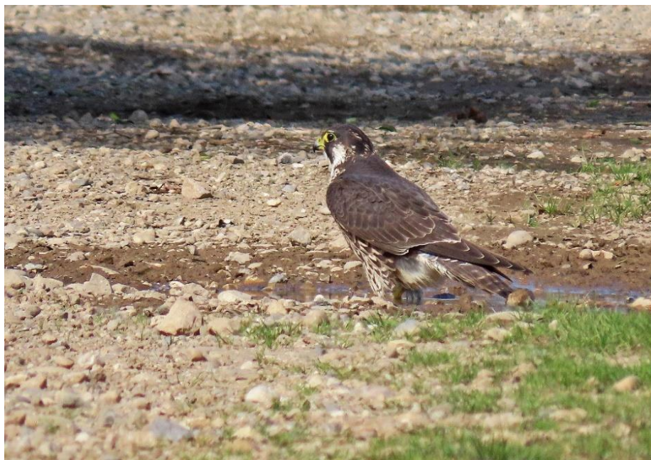
Photo n°1 : Faucon pèlerin, juvénile, Genas, septembre 2021, D. TISSIER. Peut-être un des jeunes nés à Chassieu !

À Chassieu, la tour hertzienne a été également occupée par le couple présent depuis 2015. Là aussi, des travaux d'entretien ont eu lieu pendant la couvaison, mais sans conséquence sur la reproduction puisque 4 jeunes se sont bien envolés en 2021, comme en 2019 et 2020. Malheureusement, un des jeunes a disparu après son envol ( vide Cyrille FREY, Justine GAY, Pascal GALGUEN et al. ).