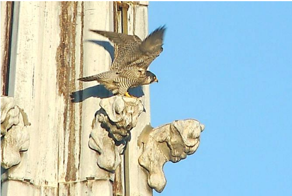
Photo n°4 : Faucon pèlerin, Villefranche-sur-Saône, janvier 2022, Frédéric LE GOUIS