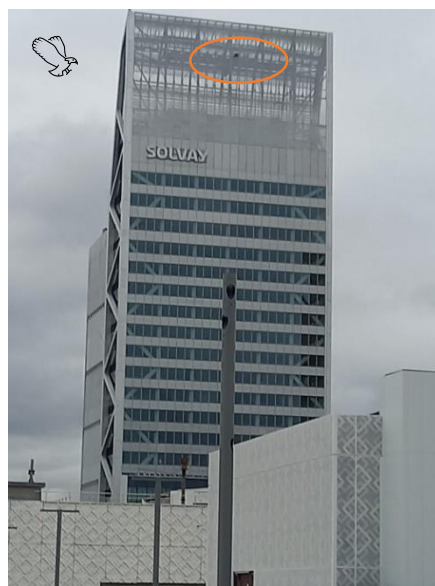
Photo n°2 : nichoir sur la tour Silex 2, novembre 2021 →

Lyon. Part-Dieu : un faucon pèlerin aperçu au sommet de la tour Silex 2 (leprogres.fr)