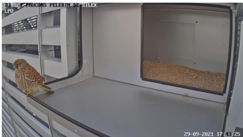
Photo n°3 : nichoir sur la tour Silex 2, septembre 2021, avec un visiteur imprévu !