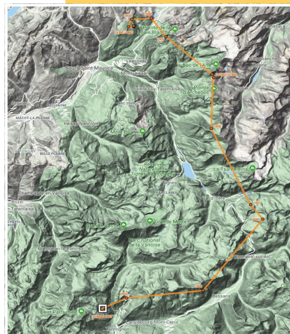
Périple d' Altitude le jour de l'IOD

Trudi contacté en haute-Maurienne en juillet 2018 mais depuis un an, son plumage a dû s'éclaircir, sa tête blanchir (type subadulte)...