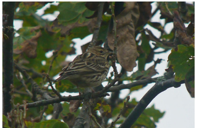
Pipit à gorge rousse Anthus cervinus L'Île d'Yeu, octobre 2012

Migrateur rare et irrégulier dans les deux départements. Il s'agit de la première donnée depuis la création du comité.