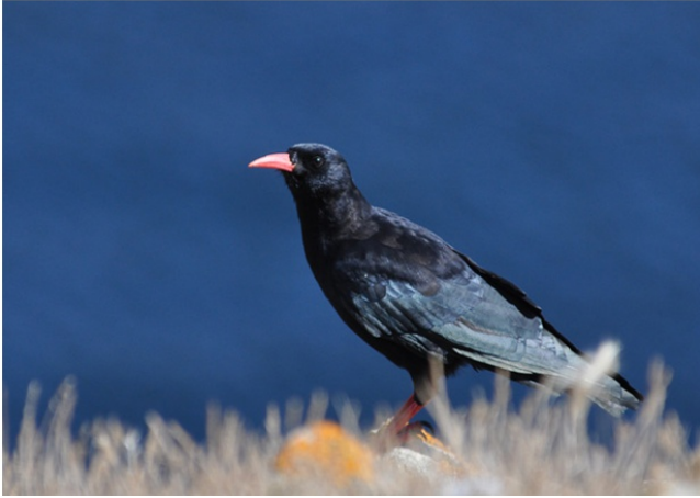
Crave à bec rouge Pyrrhocorax pyrrhocorax L'Île d'Yeu, septembre 2013