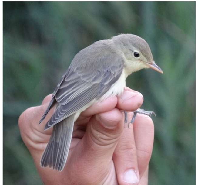
Hypolais icterina Hippolais icterina