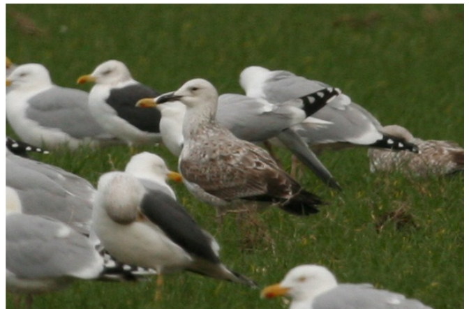
Goéland pontique Larus cachinnans

(Niche de la mer Noire jusqu'au Kazakhstan. S'est installé récemment près de Moscou ainsi qu'en Pologne et en Allemagne. Hivérne dans le golfe Persique, en mer Rouge