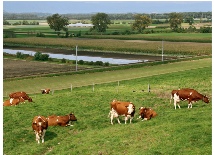
Pour s'alimenter, les choucas affectionnent les pâturages aux environs des pylônes auxquels sont accrochés leurs nichoirs (photo : Niklaus Zbinden).

Les nichoirs peuvent être posés dans les environs immédiats des pâturages et des prairies extensives que les choucas fréquentent régulièrement, même hors saison de nidification. Les grands arbres