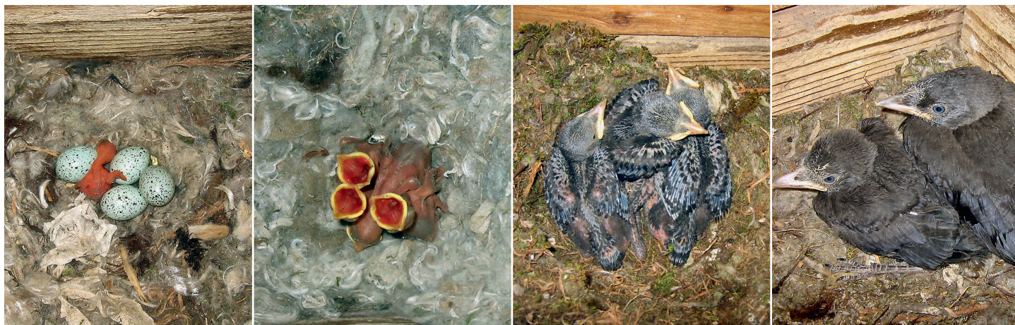
Aperçu de la vie de famille chez les choucas des tours : les 3 à 6 poussins naissent après 17-18 jours d'incubation (photo 1). Les petits quémandent leur becquée à voix haute dès le 1 er jour : leurs gorges rouges sont bien visibles (photo 2). Le plumage des jeunes choucas âgés de deux semaines est en plein développement (photo 3). A 29 jours (photo 4), les jeunes sont presque prêts à s'envoler (photos : Andreia Koller).

Afin de découvrir le type de culture agricole qui remplit au mieux les exigences de cette espèce, nous avons posé des nichoirs à choucas dans différentes zones du Grand Marais BE/FR à partir de 2004. Les oiseaux nous donnaient eux-mêmes des indications sur les endroits où la demande en cavités de nidification était la plus importante. Un couple s'était approprié un nichoir à faucon crécerelle sur un pylône électrique, un autre disputait un nichoir dans une grange à un couple d'effraies des clochers. Cependant, le succès de cette mesure était très variable selon les types de cultures du sol des envi-