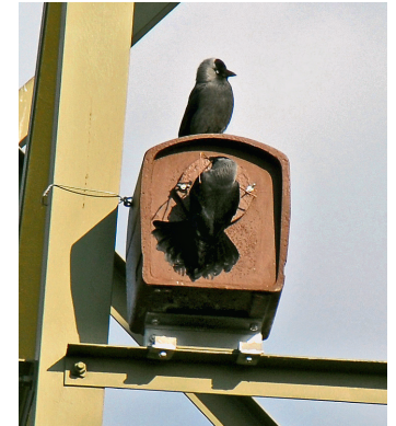
Ce nichoir de Schwegler a déjà bien fait ses preuves sur les pylônes électriques. Un élément supplémentaire est toutefois nécessaire pour le fixer.

Le choix d'un type de nichoir et de ses dimensions dépend de l'architecture du support, mais les mensurations ne devraient pas être inférieures à 300 x 400 x 500 mm. L'orientation en longueur et en hauteur ne joue qu'un rôle mineur. Le nichoir « Dohlennisthöhle Nr. 29 » de Schwegler ( http://www.schweglernatur.de ) a fait ses preuves sur les pylônes électriques, alors que les nichoirs à effraie fonctionnent bien sur les bâtiments. Les caisses en bois traditionnelles ou le nichoir à chouette n° 4 de Schwegler (Raufusskauz-