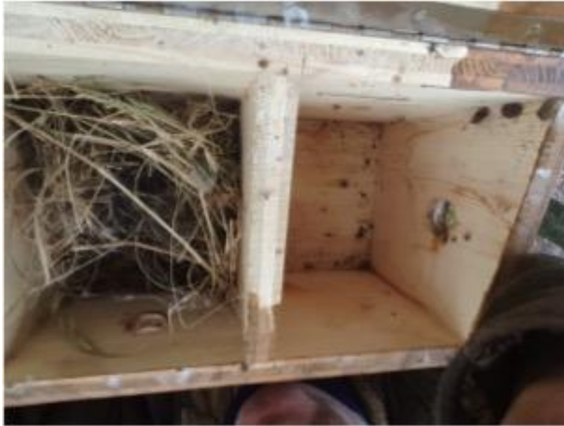
Nid possible de Moineau friquet en 2019

A Bardonnex, les nichoirs 7 et 8 contenaient 3 nids chacun (mésange sp.). Le nichoir n°9 était vide. Le nichoir n°10 contenait un nid avec de la paille, qui pourrait appartenir au Moineau friquet (voir photo du nid ci-dessous.).