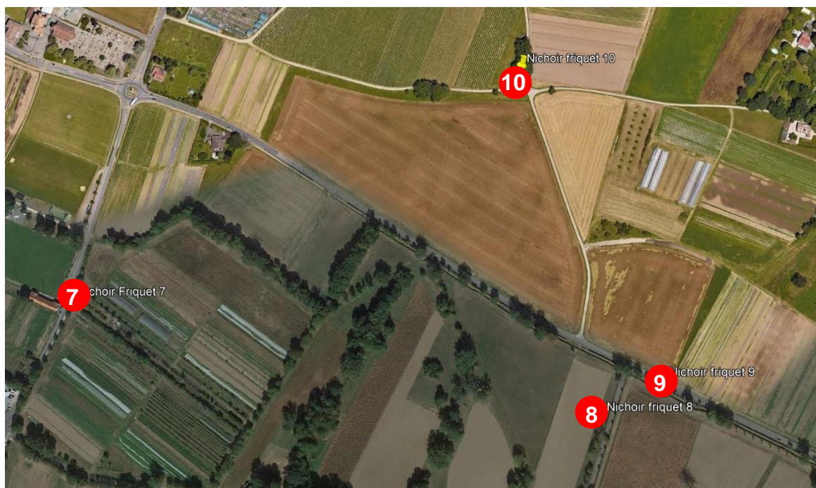
Emplacements des nichoirs à Bardonnex

En début d'année 2018, le GOBG a posé des nichoirs pour tenter de soutenir les dernières petites populations du canton à Lully et Bardonnex. Le Moineau friquet étant grégaire même en période de nidification, les nichoirs sont composés de trois compartiments, avec une ouverture donnant respectivement sur la face et les deux côtés. Dans un premier temps, quatre nichoirs triples ont été posés à Bardonnex (carte ci-dessous).