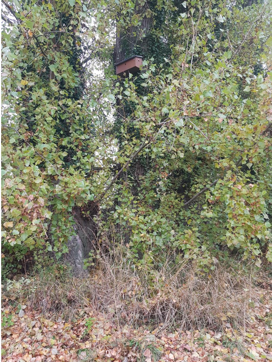
Un nichoir en place à Lully (GE)

Quelles sont les chances de revoir des Moineaux friquets nicher à nouveau sur le canton? Probablement très faibles, mais nous ne perdons pas espoir.