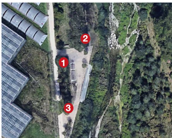
Emplacements des nichoirs à Lully (Bernex)

Trois nichoirs ont été posés à Lully au bord de l'Aire en amont du pont de Lully (1,2,3) puis début 2019, trois nouveaux nichoirs ont été installés en aval du même pont (4,5,6).