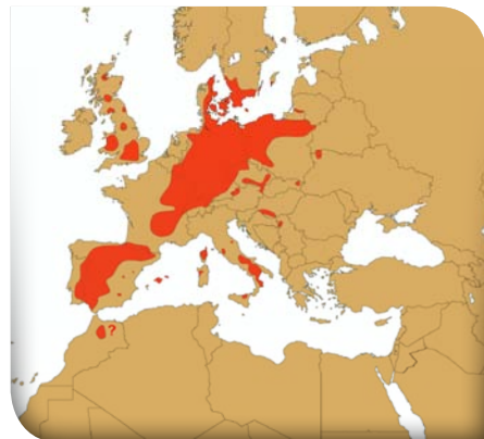
Fig.1: Distribution of the Red Kite in Europe in 2008 Répartition du Milan royal en Europe en 2008

Dans les 10 pays où l'évolution du Milan royal a été suivie entre 1850 et 1950, on a constaté une forte diminution pendant cette période. Ensuite, entre 1970 et 1990, les effectifs ont augmenté dans 70 % des pays (dans lesquels des données étaient disponibles) et diminué dans les 30 autres pour cent (Portugal, Espagne, Italie et Slovaquie). De 1990 à 2000, une tendance positive s'est manifestée dans seulement la moitié des pays, alors que dans certains des pays bastions pour l'espèce (e.g. Allemagne, France, Espagne), un déclin marqué était observé. Si la régression s'est poursuivie ces dernières années en France et en Espagne, en revanche dans la plupart des régions allemandes les populations se sont plutôt stabilisées et dans 9 autres pays les effectifs ont continué ou ont recommencé à croître. Il est intéressant de remarquer que, dans la plupart des pays où l'espèce est en augmentation, il y a aussi beaucoup d'hivernants (e.g. au Royaume-Uni, en Suède, en République tchèque, en Suisse, en Italie), probablement en grande partie nicheurs dans ces mêmes pays.