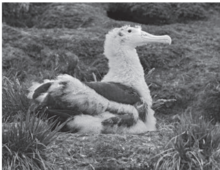
Albatros hurleur, Diomedea exulans

Bien après que le carnage a cessé en 1922 pour les otaries, puis en 1956 pour les baleines, les Terres australes françaises (inhabitées à l'exception d'une petite base militaire et scientifique sur chaque île) ont finalement été classées en 2006 comme réserve naturelle nationale. Dès lors, toute une série de projets de réhabilitation y a été entreprise et continue jusqu'à ce jour. En 2018, la France a proposé qu'elles soient classées au Patrimoine mondial naturel de l'UNESCO, désignation la plus haute pour une aire protégée. Or avec tout leur passé ensanglanté, ces îles remplissent-elles aujourd'hui tous les critères pour figurer sur la prestigieuse liste de l'UNESCO? La conférencière