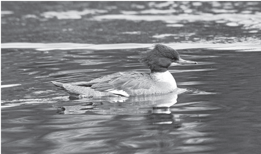
Harle bièvre femelle.