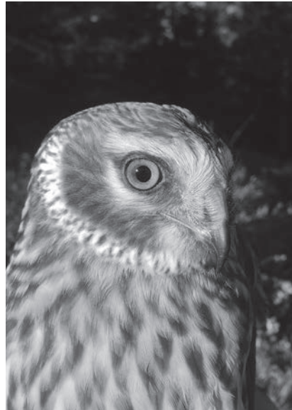
Busard Saint-Martin capturé le 12.10.2018 à la Berra.

Concernant la migration à la Berra, on peut considérer qu'il s'agit d'une petite saison avec seulement 36 espèces capturées pour 826 oiseaux bagués. (1340 en 2017). Dans le cadre du « MoDem » de la Station Ornithologique plusieurs sessions de printemps ont eu lieu, ce qui a permis la capture de 70 oiseaux, dont une Chevêchette d'Europe. Parmi les captures intéressantes de l'automne mentionnons celles d'un Busard Saint-Martin, 1 ère mention pour la Berra et la quatrième mention pour le Pouillot à grands sourcils, tous les deux capturés dans la journée du 12 octobre.