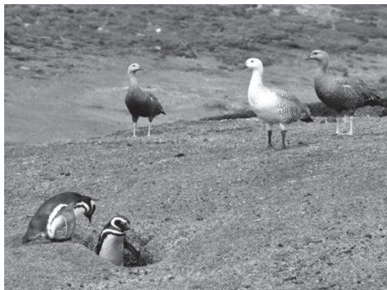
Manchots de Magellan. Spheniscus magellanicus cuset Ouettes de Magellan. Chloephaga picta

C'est l'occasion, pour les membres qui le désirent, de présenter leurs images de vacances (maximum 50 images par personne et maximum 12 minutes par personne).