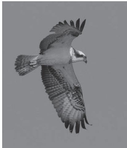
PR9, qui a pris son envol en 2016 à Bellechasse, y est revenu le 28.07.2018.

La réintroduction du Balbuzard pêcheur en Suisse a été initiée par Nos Oiseaux , société romande d'étude et de protection des oiseaux. Ce projet se déroule en terre fribourgeoise, dans la région de Bellechasse. Un bon nombre d'ornithologues du COF participent à ce grand projet que ce soit au niveau de sa réalisation, du volontariat, du nourrissage des jeunes dans les volières ou encore