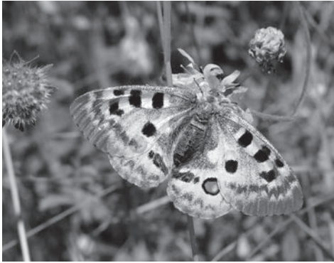
Apollon, Parnassius apollo

moitié de la surface de Suisse ne contient par exemple aucune observation de papillon. Le Canton de Fribourg est l'un des cantons avec le plus de lacunes. Cette conférence a pour objectif de vous donner tous les trucs et astuces pour devenir rapidement un excellent connaisseur de ce groupe et partir vous-même à