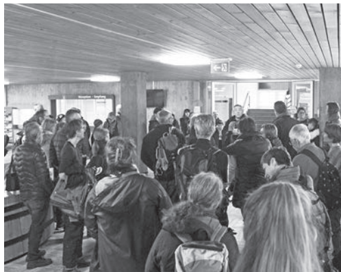
Accueil des participants à la «Nuit de la chouette» par le président du COF.

Les plus chanceux d'entre eux auront réussi à observer et entendre le Hibou moyen-duc, ainsi que la Chouette hulotte. D'autres groupes seront malheureusement rentrés bre-