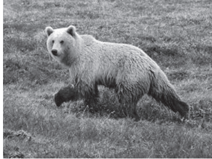
Ours brun, Ursus arctos

En Europe, l'Ours brun fait son grand retour. Un succès pour la conservation de ce carnivore si emblématique. On comprend cette espèce de mieux en mieux malgré les nombreuses questions qui se posent encore. En Scandinavie, les Ours bruns ont presque été chassés jusqu'aux derniers. Aujourd'hui, la population se remet de cette persécution. De 130 ours en 1930, la population est passée à plus de 2700 individus. Se promener dans les bois pendant que l'ours y est ? Oui ! Et les Scandinaves aiment bien être dans la nature. Ceci est l'histoire d'une cohabitation entre l'Homme et l'Ours brun, une situation qui pourrait devenir une réalité pour de multiples pays d'Europe, dont la Suisse.