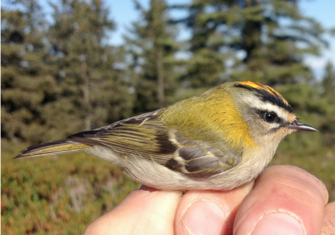
Roitelet à triple bandeau, 9 octobre 2015 (M. Beaud)