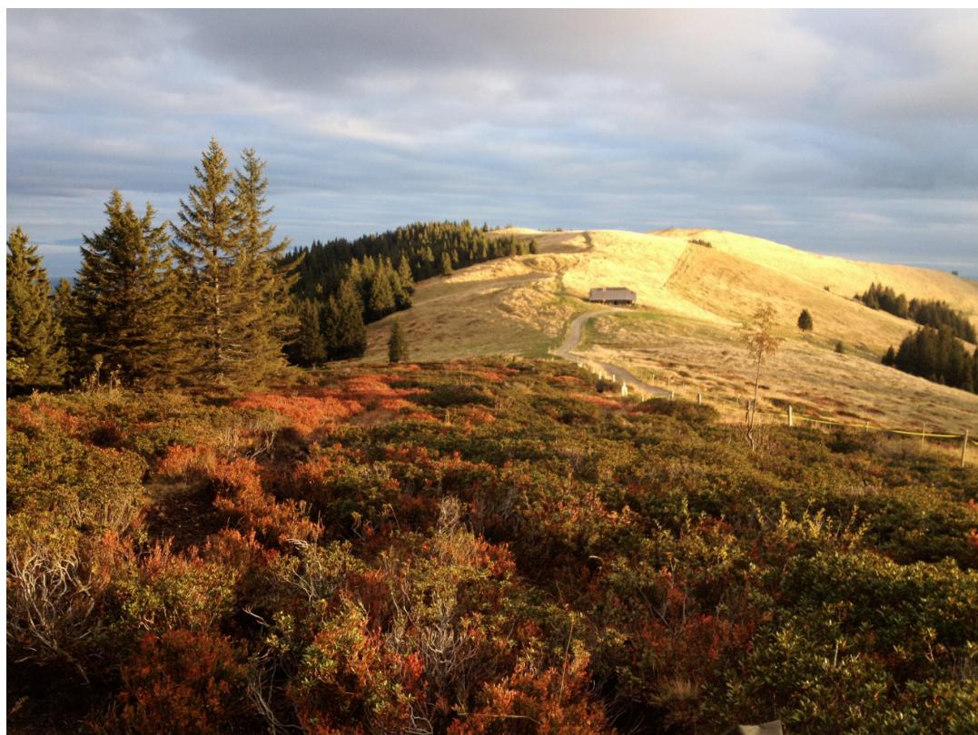
Vue depuis la table de baguage, le 3 octobre à 8h00

Rapport terminé le 21.1.2016, Michel Beaud