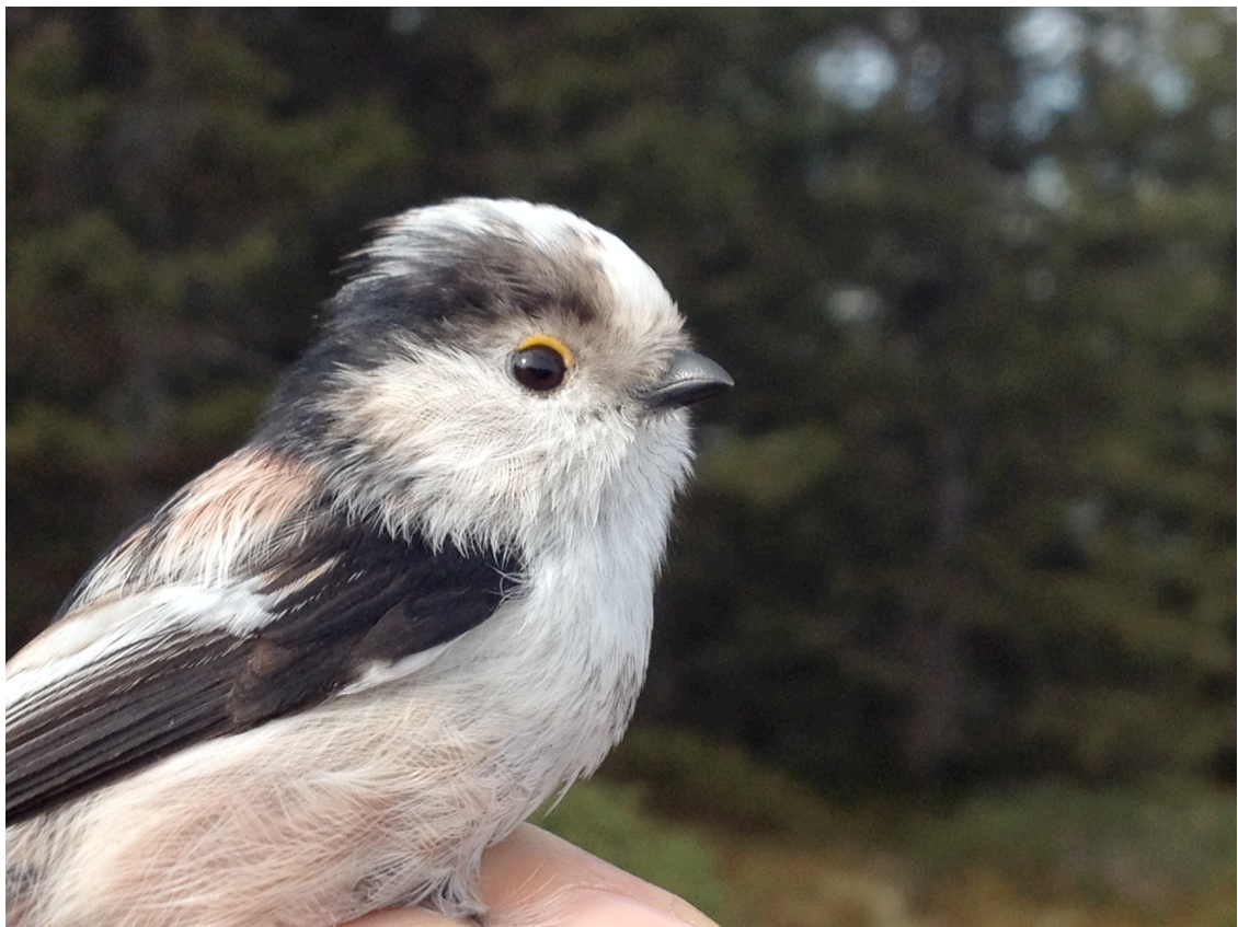
Mésange à longue queue, 25 octobre 2015 (M. Beaud)