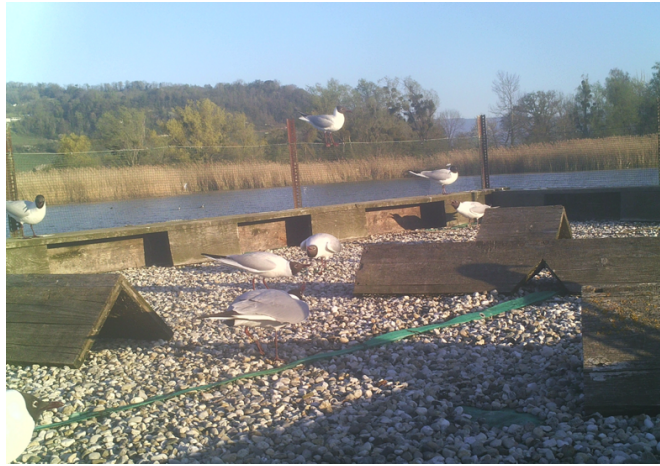
Visite de Mouettes sur la plateforme No 1, Sugiez, le 17 avril 2022