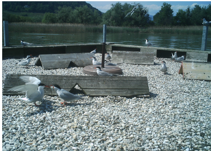
Premières parades sur la plateforme No 2, Sugiez, le 15 mai 2022.