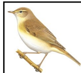
Mosquiter de passa

El mosquiter de passa s'assembla molt al mosquiter comú , però té les ales més llargues i el cant és força diferent. A més, té les potes més clares (i no negres com el mosquiter comú ), el plomatge general és més groguenc i la cella més marcada. El plomatge del tallarol gros és marró amb gris als costats del coll. A més, és més gran amb el bec més gruixut i les potes més curtes.