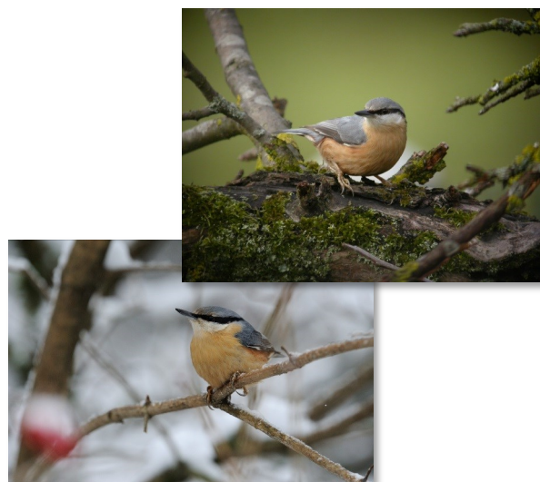
Mascle i femella

Mascles, femelles i joves tenen el plomatge idèntic . El pica-soques blau es reconeix fàcilment perquè és l'únic ocell capaç de baixar d'un arbre amb el cap per avall.