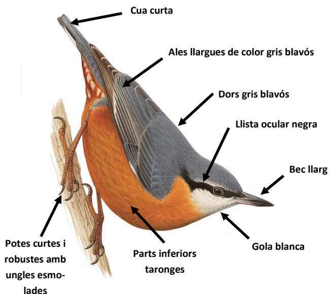
Mascle, femella i joves