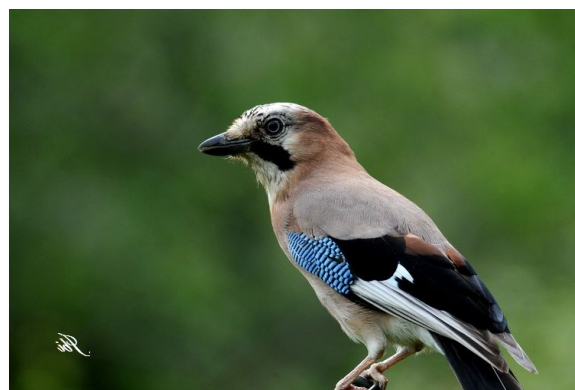
Mâle ou femelle

Mâles, femelles et jeunes ont un plumage identique .