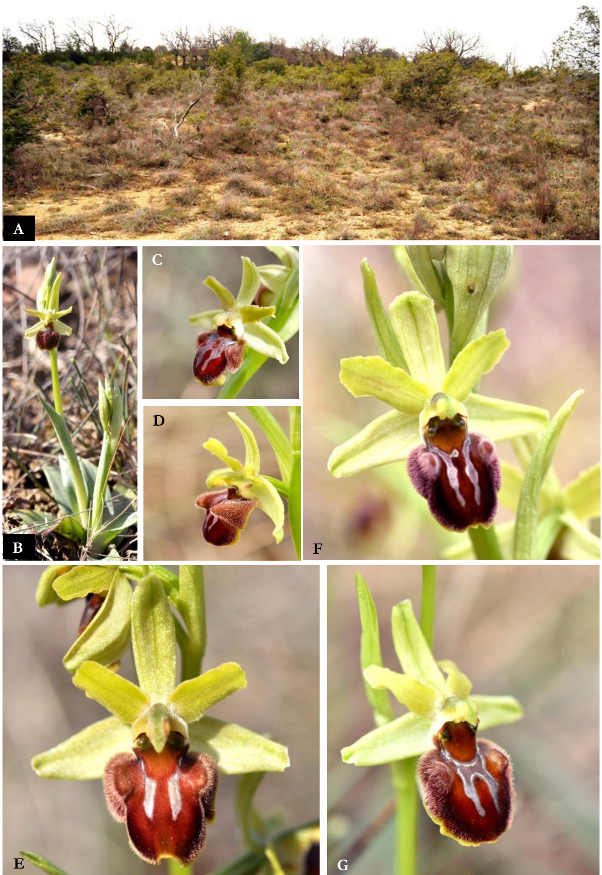
Figure 2. A : Station d' Oam à Saint-André-de Cruzières (07, le 08/03/2015); B : Oam à Saint-André-de-Cruzières (07, le 08/03/2015); C : Oam à Beaulieu (07, le 28/03/2015); D : Oam à Saint-Sauveur-de-Cruzières (07, le 21/03/2015); E : Oam à Grospierres (07, le 08/04/2015); F et G : Oam à Sauteyrargues (34, le 19/03/2015).