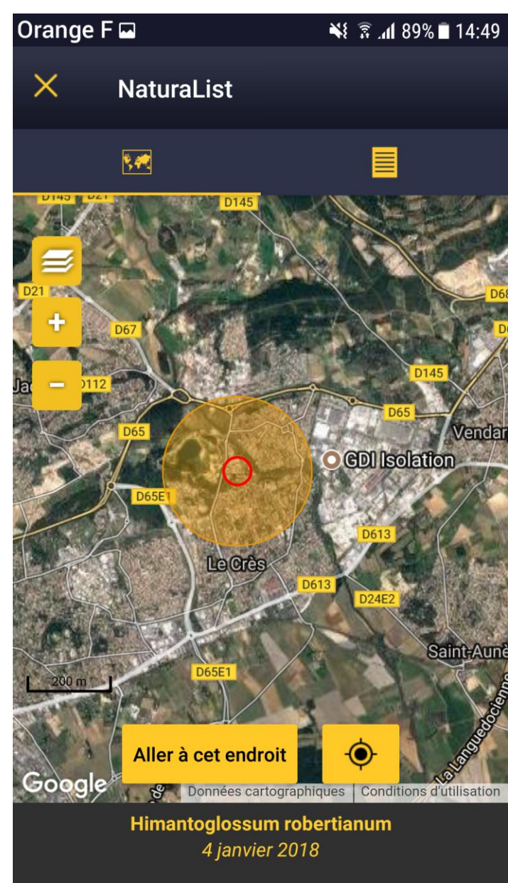
Capture d'écran de l'application NaturaList