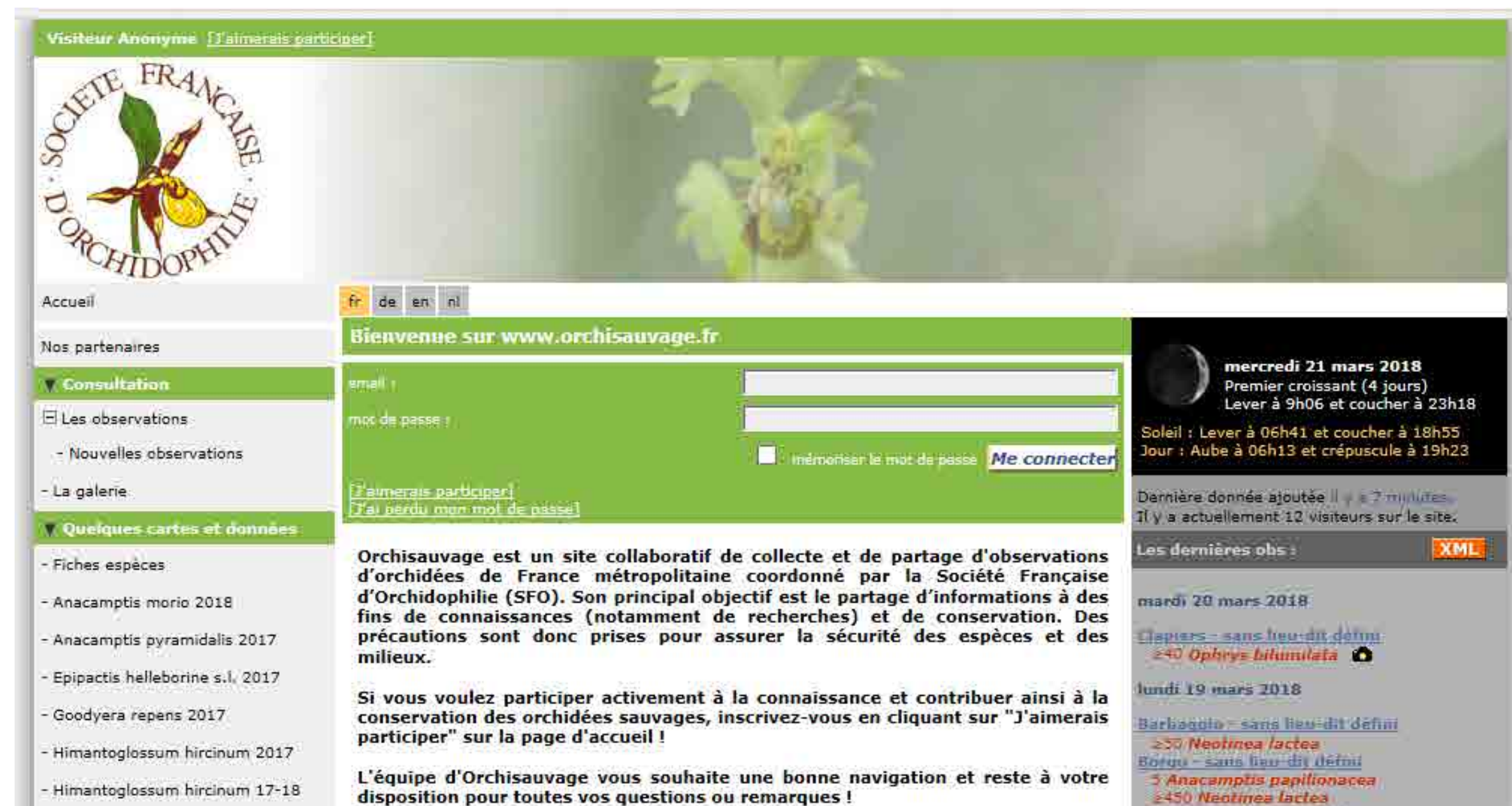
Page d'accueil du site

Une autre façon de contribuer à la connaissance et la préservation des orchidées