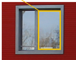
Kollisionsscheibe, 4.1.2022 Seerose 1, Sempach, Foto: M. Burkhardt