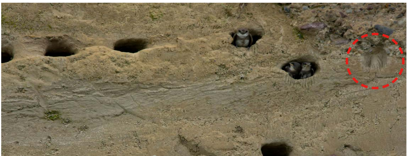
Abb. 2: Detailansicht einer von Uferschwalben begonnenen, aber nicht als potenzielle Brutröhre zu wertenden Vertiefung (roter Kreis). Ein wichtiges Kriterium für eine potenzielle Brutröhre ist, dass das Röhrenende nicht sichtbar ist. Das ist hier eindeutig der Fall.