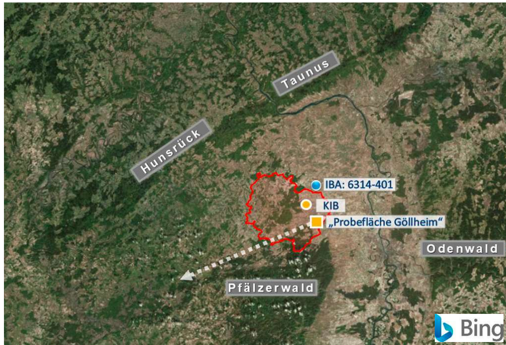
Abb. 2: Lage des Donnersbergkreises (rot umrandet) zwischen Hunsrück und Taunus im Norden sowie Pfälzerwald und Odenwald im Süden mit der Kreisstadt Kirchheimbolanden (KIB), der Probefläche bei Göllheim (gelbe Symbole) und der Lage des NATURA 2000-Gebietes „Ackerplateau zwischen Ilbesheim und Flornborn“ (IBA-Gebiet 6314-401; blauer Punkt). Der Pfeil markiert den ungefähren Verlauf von Göllheimer Hügelland, Kaiserstraßensenne und St. Ingbert-Kaiserslauterer Senke. Kartengrundlage: Microsoft Bing Maps

gorie 1 („Vom Aussterben bedroht“), für Deutschland (RYSILAVY 2021) in Kategorie 2 („Stark gefährdet“; Braunkehlchen), resp. Kategorie 1 (Steinschmätzer) geführt. Und beide Arten sind in mehrfacher Weise bedroht; es sind bodenbrütende Offenlandarten, Langstreckenzieher und Insektenfresser. Sie zählen damit zu ökologischen Gilden, in denen besonders viele Arten in einem kritischen Erhaltungszustand sind (WAHL et al. 2015).