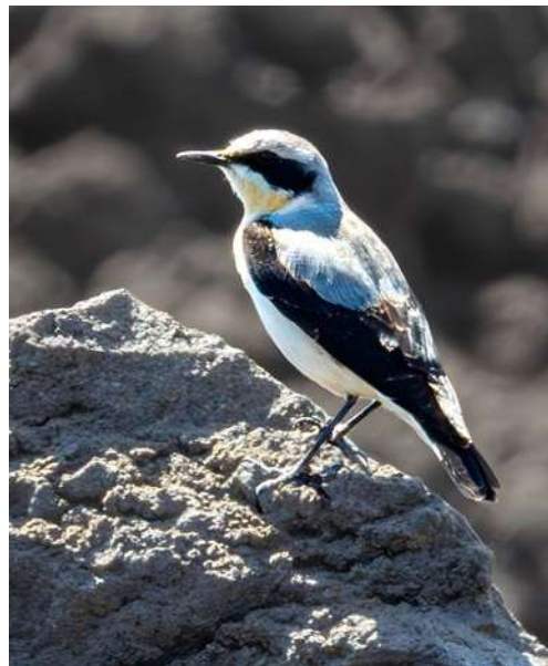
Abb. 1: Braunkehlchen ( Saxicola rubetra ; links) und Steinschmätzer ( Oenanthe oenanthe ); Fotos: H.-V. und A. Bastian