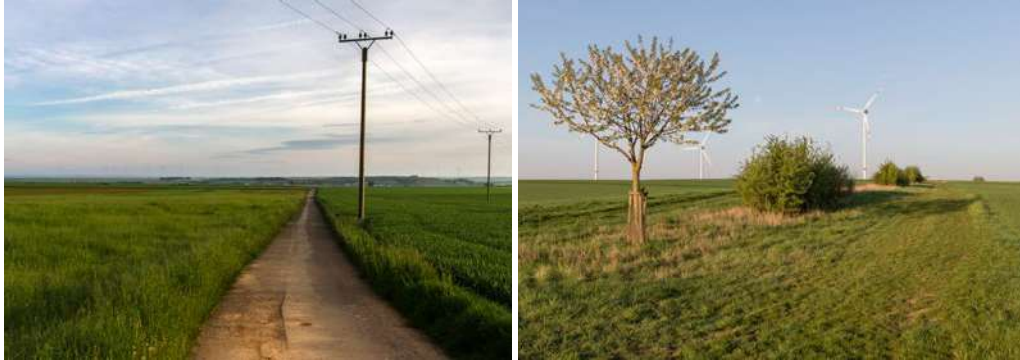
Abb. 4: Typische Rasthabitate auf der „Probefläche Göllheim“. Steinschmätzer werden häufig auf den Feldwegen beobachtet (links), Braunkehlchen nutzen dagegen meist Büsche und einzelstehende Bäume zwischen den Feldern und entlang von Wegen (rechts).